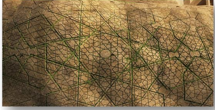
شكل رقم (11) جزء آخر مفصل من الجدارية مستخدماً معالجات طبيعية من البيئة

وهنا في شكل (7) سوف نستعرض معالجات تشكيلية وجمالية وتقنية قد صاغها الفنان لهذه الجدارية مستخدماً بلاطات القرميد، ففي عام 2007 قد نُشر بحث علمي يثبت أن القرميد له نفس الخواص التي تتمتع بها بلورات الكريستال، وقد تم اختبار ذلك عملياً، لذا فهو يصلح كمعالجة تشكيلية تعبر عن الفكر الإسلامي.