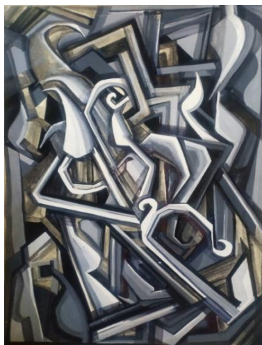
تجربة رقم (1) (حبر علي ورق)

وهنا قد حاولت الباحثة الخروج بعنصر الزخرفة الإسلامية من الإطار التشكيلي النمطي وإعطاءه طراز حديث أكثر ليونة، وهنا حاولت دمج عنصر الزخرفة الإسلامي الهندسي مع التوريقات الإسلامية المعروفة، وإعطاء حس تصويري بالأبيض والأسود.