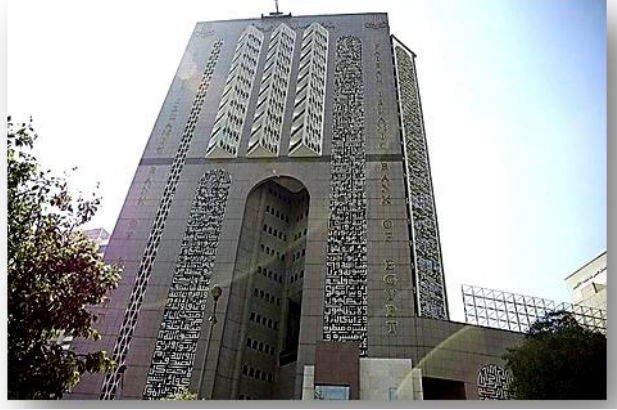
شكل رقم (8) بنك فيصل الاسلامي المصري - الجيزة

نماذج للمعالجات التشكيلية النمطية في العمارة المعاصرة: نموذج رقم (1): بنك فيصل الإسلامي المصري: