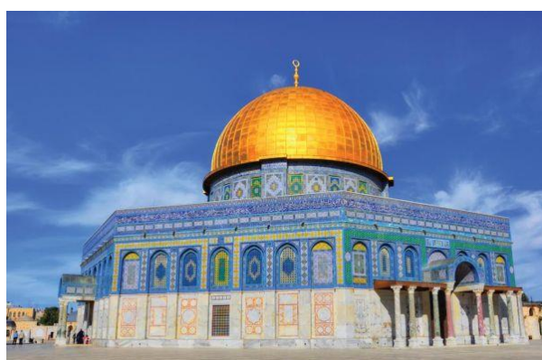
شكل رقم (6) مسجد قبة الصخرة - القدس