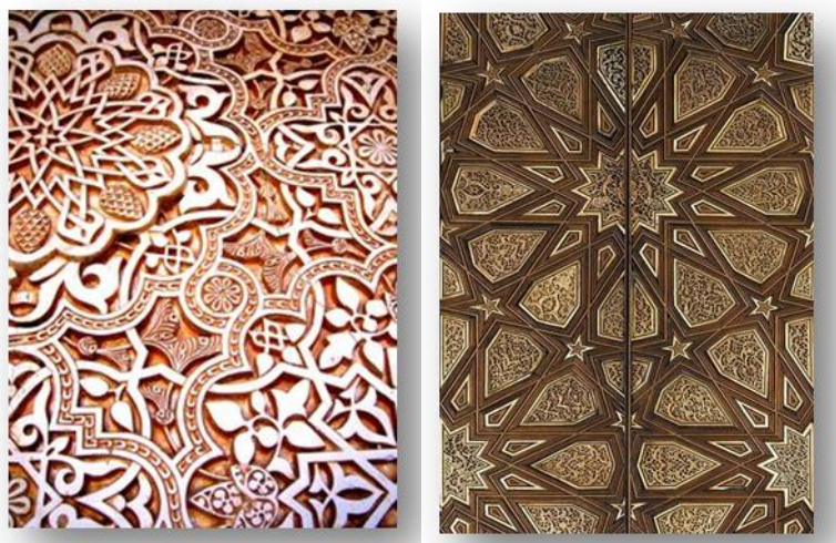
شكلي (2'1) نماذج هندسية ونباتية، من عنصر الزخرفة الإسلامية