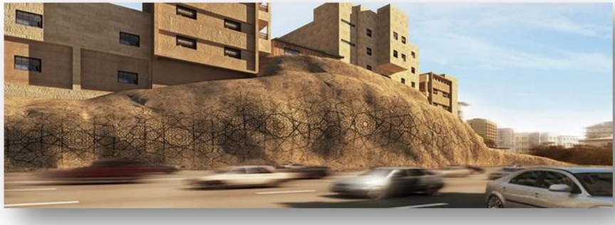
شكل رقم (10) جزء من جدارية (الموالا)

جدارية (الموالا): وهو تصميم المهندس أحمد البدوي في مكة المكرمة، عام 2013، وقد اتبع هنا فلسفة معينة استلهمها من تصميم الصخرة الملهم والمصمم طبيعياً، حيث الصعود إلى ذروة مرئية واضحة، ثم النزول للأرض مرة واحدة.