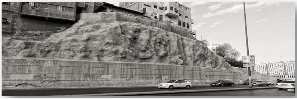
شكل رقم (9) El- Mualla cemetery mural - السعودية

نموذج رقم (2) جدارية (الموالا) للمعماري احمد البدوي: