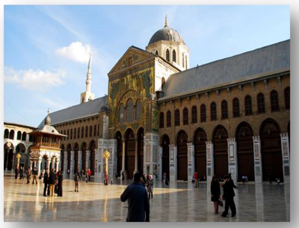
شكل رقم (5) واجهة المسجد الأموي - دمشق