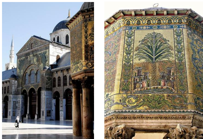
شكلي رقم (3'4) تفاصيل من المسجد الأموي -دمشق

من خلال دراسة عنصر الزخرفة الإسلامية دراسة واسعة والتعرف علي الحقب المختلفة للفن الإسلامي وعرض طرق التفكير في عنصر الزخرفة الإسلامي نجد أنه أكثر الفنون شعبية في المناطق العربية خاصةً في مصر ، وأشارت الدلائل أن الجداريات كانت سمة مهمة في الحضارة الإسلامية ، فهناك العصر الأموي الذي خلف جدارية المسجد الأموي في دمشق (607-715 هجرية ، ومسجد قبة الصخرة في القدس (691-692)، وقصر خربة المفجر في فلسطين (724-743) وكانت كل هذه الجداريات مصنوعة من بلاط الفسيفساء وتأثرت ببعض الحضارات السابقة مثل الفترات اليونانية والبيزنطية ، لذلك لم تكن جداريات إسلامية بحتة حتي ظن المؤرخون أن هذه الجداريات قد صنعها علي الأرجح حرفيون رومانيون .