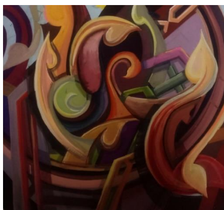
تجربة رقم (3) ألوان جواش علي ورق

وهنا تحاول الباحثة خلق إطار تصويري جديد للنظام الإسلامي النمطي المعروف، ومحاولة خلق علاقة تصويرية بين العناصر وبعضها.