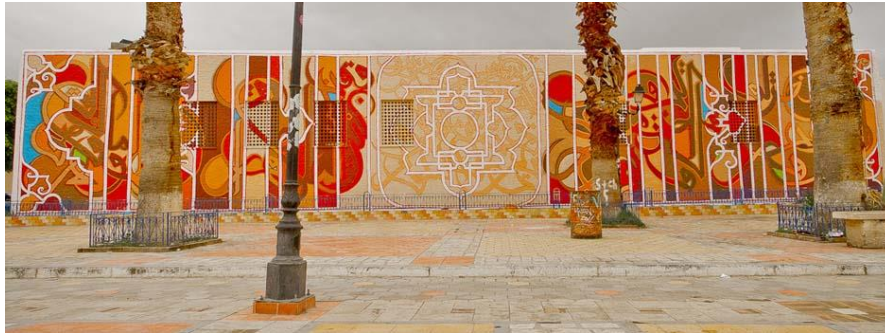
شكل رقم (10) جزء مفصل من الجدارية

وهنا استخدم اتبع الفنان (السيد) طريقة تسمى فن (الجرافيتي) مستخدماً عناصر الخط العربي المدمجة بعناصر زخرفية محورة من عنصر الزخرفة الإسلامية، محدثاً صياغة تشكيلية بعيدة عن عنصر الزخرفة الإسلامية النمطي والمتكرر مراعيًا للمفردات المعمارية والمحددات المكانية والمفردات البيئية.