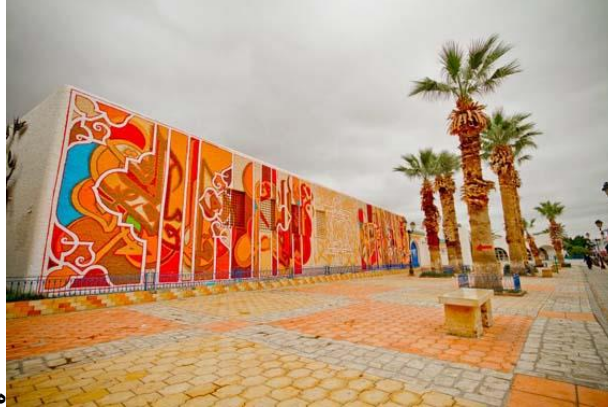
شكل رقم (9) جدارية منفذة في مدينة القيروان بتونس من أعمال الفنان (السيد)-2012 (40m x 7m)

نماذج للمعالجات الجدارية التشكيلية المستخدمة عنصر الخط العربي مدمجاً بالخط العربي: نموذج رقم (3):