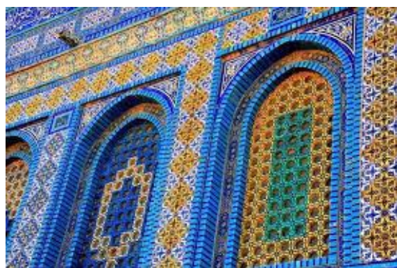
شكل رقم (7) جزء من مسجد قبة الصخرة - القدس

ومن المعروف أن هناك سمات قد عززت الفن الإسلامي ليكون أحد الأساليب المعروفة في الفن التجريدي مثل: الخطوط، والأشكال الهندسية، والتضاد بين الكتلة والفراغ، ومنها نتجت الحيوية والحركة والتكرار والتنوع والوحدة والتجريد. وهذه النقطة قد نوقشت في أبحاث عدة، وهذا ما استدعي إلي مناقشة الفن الإسلامي وإمكانية صياغته بمنطق جداري تصويري يتفق مع العمارة المعاصرة، وإيجاد معالجات تشكيلية للعمارة الإسلامية مع الاحترام الكامل لهوية الفن الإسلامي والمحافظة علي التراث الموروث منه.