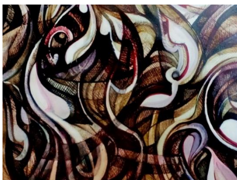
تجربة رقم (2) أقلام رصاص ملونة علي ورق

وهنا قد حاولت الباحثة الخروج بعنصر الزخرفة الإسلامية من الإطار التشكيلي النمطي وإعطاءه طراز حديث أكثر ليونة، وهنا حاولت دمج عنصر الزخرفة الإسلامي الهندسي مع التوريقات الإسلامية المعروفة، وإعطاء حس تصويري بالأبيض والأسود.