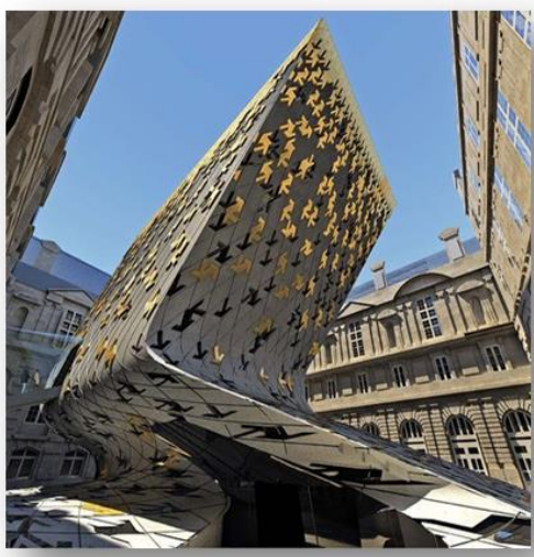
شكل رقم (11) عمل من أعمال المعمارية زها حديد

أعمال معاصرة مستوحاة من فن الزخرفة الإسلامية: في هذا الجزء سأعرض أعمال إسلامية معاصرة مستوحاة من فن الزخرفة الإسلامية كالتالي: -