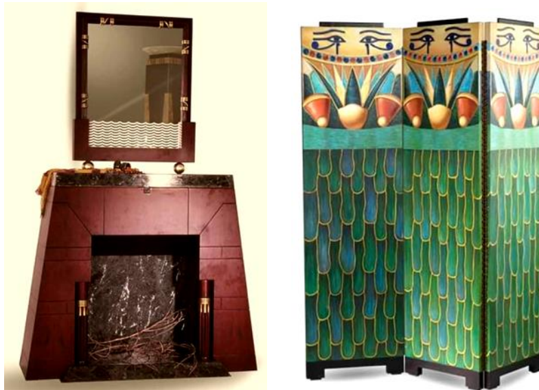
صورة رقم ( ) ، ( ) توضح نماذج أثاث من تصميم د/ خالد محرز للحفاظ على الهوية "الثبات" من خلال الحفاظ على الموروثات المصرية القديمة والإبداع المادي في تكوين العلاقات من خلال النسب الهندسية و مفرداتها. التشكيلية، وانعكاسها على تصميم الأثاث.