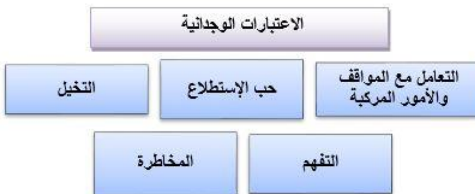
شكل (2) يوضح الإعتبارات الوجدانية المؤثرة في تشكيل الجانب الإبداعي لدى المصمم.

ب – المرونة التلقائية: وتكمن في القدرة على تقديم إستجابات مختلفة في مواقف مختلفة كما تعتبر الإعتبارات الوجدانية لدى المصمم من العناصر الأساسية والفعالة في التعبير عن قدراته الإبداعية وأبعاده الفكرية التي تمتاز بالذاتية عند تعامله مع أي مشكلة تصميمية وتتمثل تلك الإعتبارات الوجدانية فيما يلي: