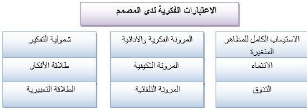
شكل (1) يوضح القدرات والخصائص الفكرية والإبداعية لدى المصمم