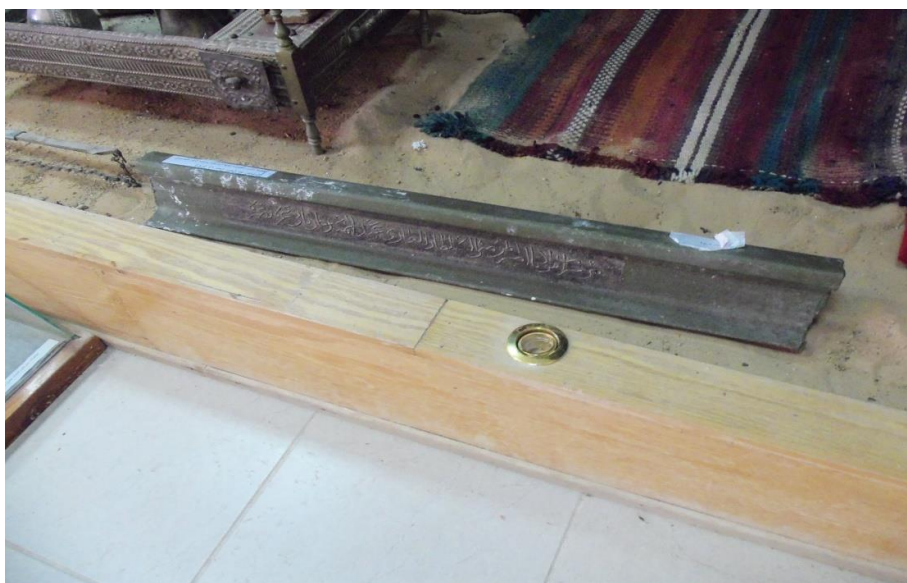
( لوحة 1 ) منظر عام للقضبان الحديدی ( تصوير الباحث )

خط - سلك - حديد https://ar.wikipedia.org