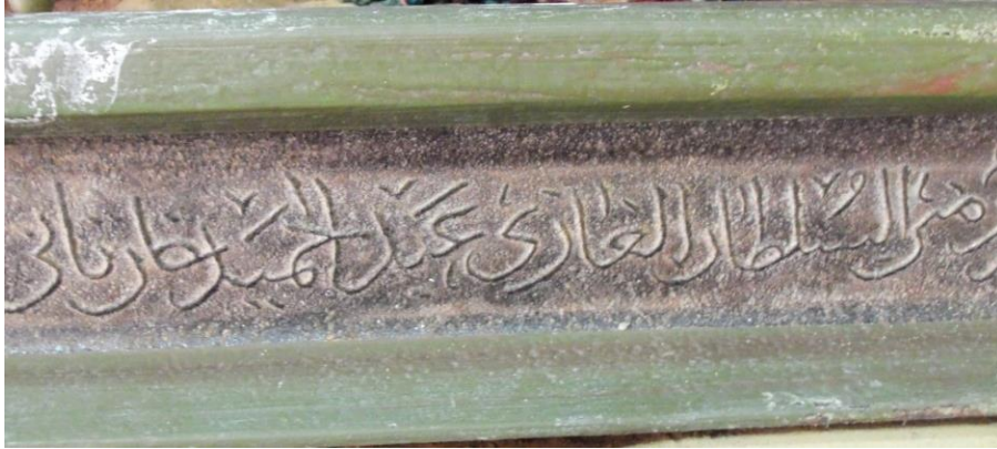
( لوحة 4 ) تفاصيل من النقش الكتابي