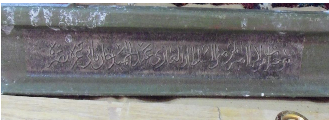
( لوحة 2 ) منظر عام من النقش على القضبان الحديدی