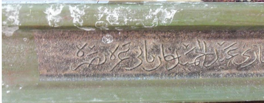
( لوحة 5 ) تفاصيل من النقش الكتابي