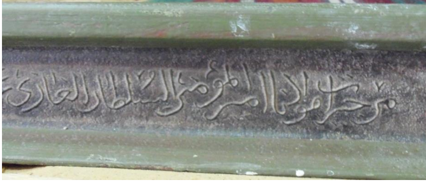
( لوحة 3 ) تفاصيل من النقش الكتابي