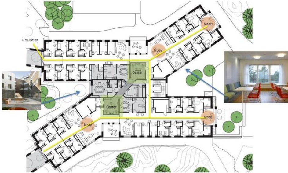
صورة (1b) توضح التصميم المعماري و تقسيم الفراغات ل احد مستشفيات الطب النفي

العلاقة بين الأطباء والمرضى تتأثر أيضاً بالتصميم فتشجع الحقائق والاماكن المفتوحة التفاعلات الإيجابية التي يمكن أن تشجع على المزيد من الرضا الوظيفي. (9)(83-71).