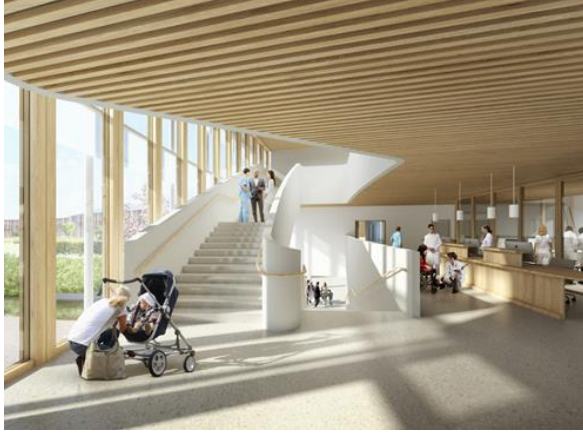
صورة (7) توضح وجود مساعدات علي جانبي السلم لاستخدامها للصعود