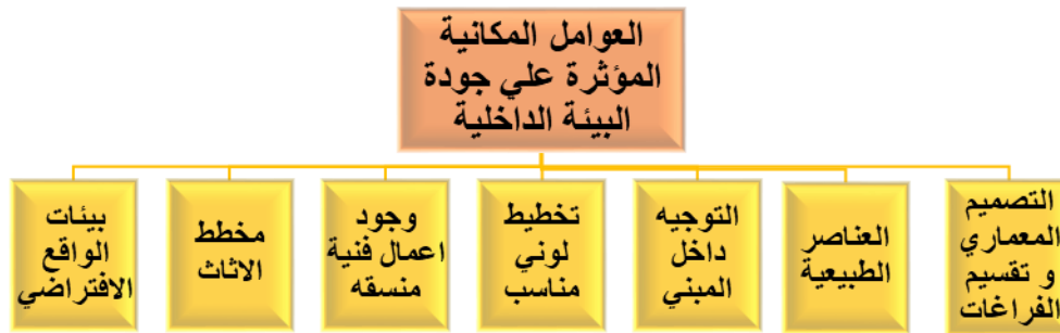
شكل (1) يوضح العوامل المكانية الخاصة بالمكان