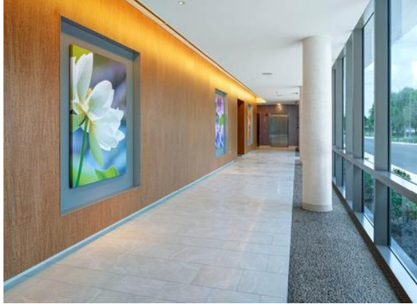
صورة (6) توضح ممر حركة مؤدي الي قسم اخر من اقسام المستشفى