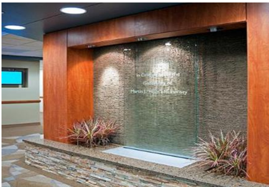
صورة (5) توضح استخدام الماء كعنصر جمالي داخل المستشفى

المناسب لكسر ملل الانتظار ، أو للراحة والتفكير والتدبير . كما ان توفير عنصر الماء في أي مكان يدعو إلى ترطيب وتنقية الهواء ، بل كثيرا ما يدعو ظهور الماء أمام الإنسان إلى الارتياح لما يسببه من إحياء نفسي يتقبل الوسط المناخي الذي يسود المكان. كما يعمل على تنظيم الحركة وتحديد السير. (1)(ص 270-277)