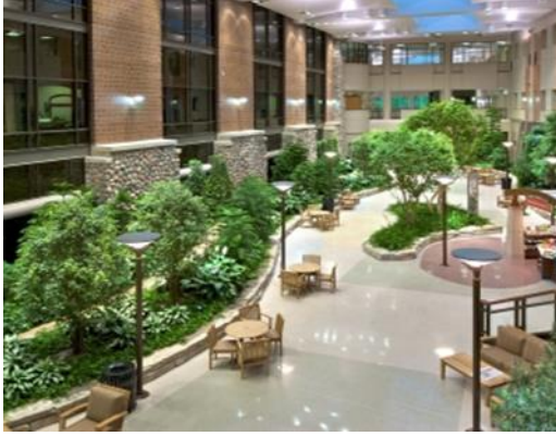
صورة (3) توضح استخدام النباتات ذو اللون الأخضر لاضفاء روح الهدوء النفسي