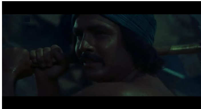
صورة رقم (٤) و (٥) و (٦) توضح أحجام مقربة ( close up ) توضح المسافة الواسعة أمام و حول الممثل

ونجد أن معلومات اللقطة المقربة لا تقتصر فقط على وجه الممثل وملامحه ، و لكن تتضمن معلومات أخرى مثل اللون والإضاءة والديكور .