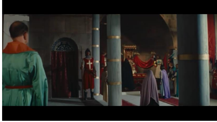
صوره رقم (١٣) و (١٤) لتوضيح استغلال خط رأسي في منتصف الكادر

وبعد استعراض نقاط الاختلاف الخاصة بأحجام اللقطات بالنسبة للسينما سكوب نجد أن جميع نقاط الاختلاف في الأحجام و التكوينات التي يتم اقتراحها تؤثر على الإيقاع العام للفيلم فهي تجعل الإيقاع أقل بطأً بشكل عام .