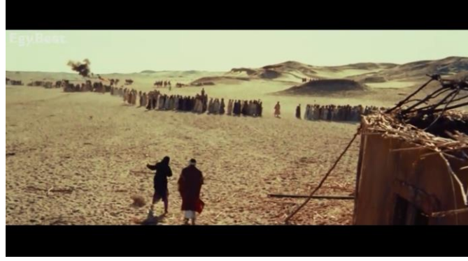
صوره رقم (١٥) و (١٦) توضحان مدى العمق في الكادر للسينما سكوب