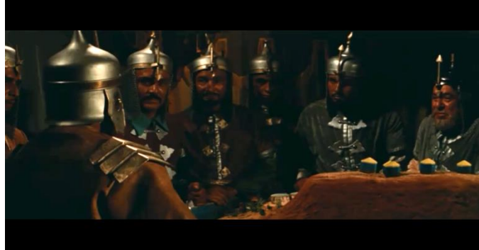
صورة رقم (٨) توضح ظهور أكثر من ٦ ممثلين في لقطة متوسطة واحدة