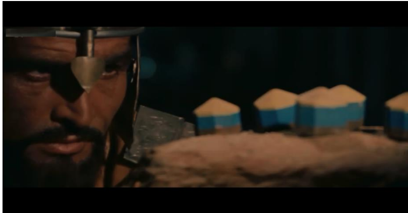
صورة رقم (٧) توضح ظهور جزء من الديكور يشغل ثلثي الكادر مع لقطة مقربة للممثل

ونجد أن معلومات اللقطة المقربة لا تقتصر فقط على وجه الممثل وملامحه ، و لكن تتضمن معلومات أخرى مثل اللون والإضاءة والديكور .