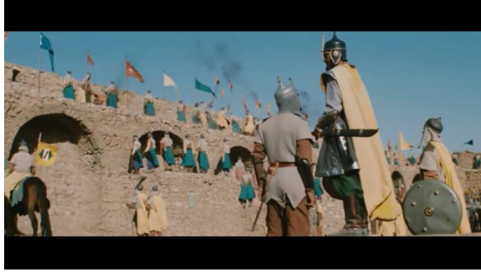
صورة رقم ( ١١ ) توضح لقطة عامة للممثل توضح مدى اتساع حجمها لاعداد كبيرة من الممثلين

ويستطيع المخرج عمل تكوين للقطة العامة باستغلال جزء من مقدمة الكادر يوضع ممثل أو جزء من الديكور ليكون هذا الجزء كاملاً ( لتصبح لقطة عامة متوسطة للممثل على سبيل المثال ) مع الاحتفاظ بالجزء الخلفي للقطة برؤية عامة واسعة تستوعب العديد من الممثلين و أجزاء الديكور .