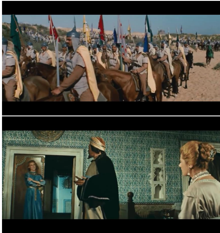
صوره رقم (٢) و (٣) توضحان إتساع التكوين الأفقي للسينما سكوب

و إذا اختلفت نسبة الخطوط الأفقية و الرأسية التي تحد الكادر فبالتالي يختلف التنسيق للتكوين الداخلي للقطعة ، وعلى حساب نسبة السينما سكوب فإن الخط الأفقي يأخذ مساحة أكبر من الخط الرأسى للإطار ( مساحة أكبر من ذلك الفرق في النسبة الأكاديمية ) ولذلك نجد أن توزيع مفردات و عناصر التكوين على المساحة الأفقية تكون أوسع بالنسبة للأثاث و الديكور العام للقطعة ، مما يعطي زاوية رؤيه أفقية أوسع من تلك الزاوية للنسبة الأكاديمية ( https://sites.google.com ) . و التكوين كلما زاد إتساعه كلما تطلب زمن أطول للقطعة لكي يتمكن المشاهد من إستيعاب أكبر عدد من المفردات التشكيلية للتكوين لذلك نلاحظ أن اللقطات الواسعة في نسبة السينما سكوب تستغرق وقتاً أطول من نظيرتها في النسبة الأكاديمية . و هذا من شأنه التحكم في الإيقاع لتقليل سرعته ، فيصبح إيقاع اللقطة أقل حتى يستطيع المشاهد الوصول لمعلومات الكادر .