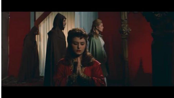
صورة رقم (٩) توضح ظهور عدد من الأشخاص في عمق الصورة وأجزاء من ديكور اللقطة

وقد إستغل المخرج يوسف شاهين في فيلم التطبيق ظل الممثل لكي يكون متجاور له في لقطة متوسطة .