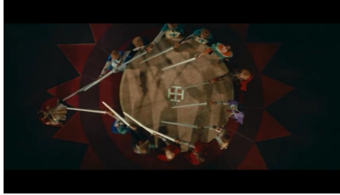
صورة رقم (١٧) توضح مدى اتساع الكادر لللقطة العلوية في السينما سكوب

يمكن لنسب السينما سكوب استيعاب جميع زوايا الرؤيا للكاميرا والاستفادة بجميع جمالياتها ، وتزداد تلك الجماليات مع السينما سكوب بسبب الشاشة العريضة التي تغطي معظم الديكور وتعطي فرصة أكبر لظهور اللون والإضاءة . وتتميز الزاوية العلوية في السينما سكوب بضخامتها وقوة تأثيرها فهي تضاعف تأثير النسبة الأكاديمية .