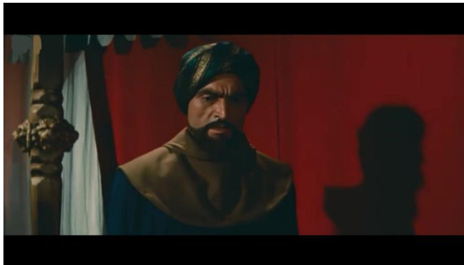
صورة رقم (١٠) توضح ظهور الممثل مع استغلال ظله في تكوين الكادر

وقد إستغل المخرج يوسف شاهين في فيلم التطبيق ظل الممثل لكي يكون متجاور له في لقطة متوسطة .