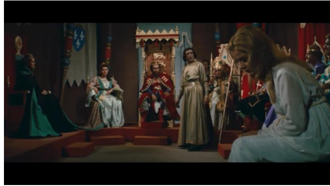
صورة رقم (١٢) توضح عمل تكوين باستغلال جزء من مقدمة الكادر

ويستطيع المخرج عمل تكوين للقطة العامة باستغلال جزء من مقدمة الكادر يوضع ممثل أو جزء من الديكور ليكون هذا الجزء كاملاً ( لتصبح لقطة عامة متوسطة للممثل على سبيل المثال ) مع الاحتفاظ بالجزء الخلفي للقطة برؤية عامة واسعة تستوعب العديد من الممثلين و أجزاء الديكور .