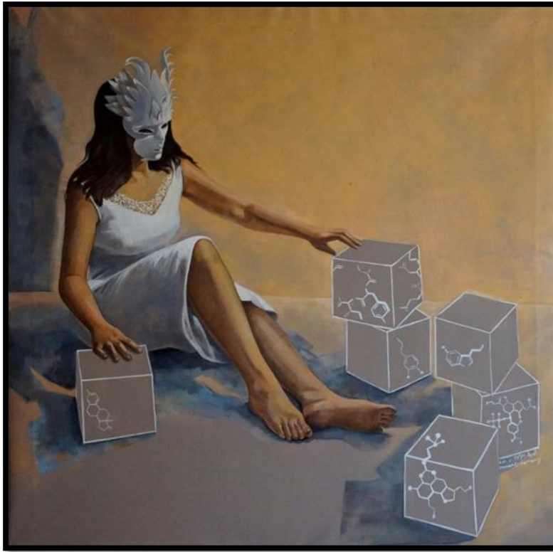
شكل رقم (١٢) - من أعمال الباحثة- الأوكسيتوسين -١٢٠ x ١٢٠ سم - زيت على توال - ٢٠٢٠

فجودة النوم تؤدي الى جودة اليقظة .في شكل رقم (١١) تظهر المرأة في حالة يقظة على الرغم من اتخاذها وضع النوم . اللوحة يسود فيها اللون الأحمر و الذي يتنافى مع سكينه و سلام النوم[٤].