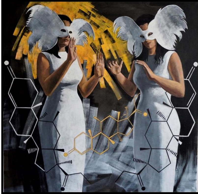
شكل رقم (١٨) - من أعمال الباحثة- كورتيزول- 100 x 100 سم - زيت على توال - ٢٠٢٠ Figure No. (18) – researcher artwork -Cortisol - 100 x 100 cm - oil on canvas – 2020

الكورتيزول هو هرمون ستيرويدية يفرز من قشرة الغدة الكظرية متصلة بالكلية. يفرز استجابةً للإجهاد أو لانخفاض مستوى هرمونات القشريات السكرية في الدم. الكثير من المركبات المصنوعة من الكورتيزول تستخدم لعلاج العديد من الأمراض المختلفة.. يتحكم في إفرازه جزء من الدماغ هو الفص الأمامي في الغدة النخامية. ينتج عن الإجهاد سواء النفسي أو البدني ويتسبب بزيادته في نوم قلق.