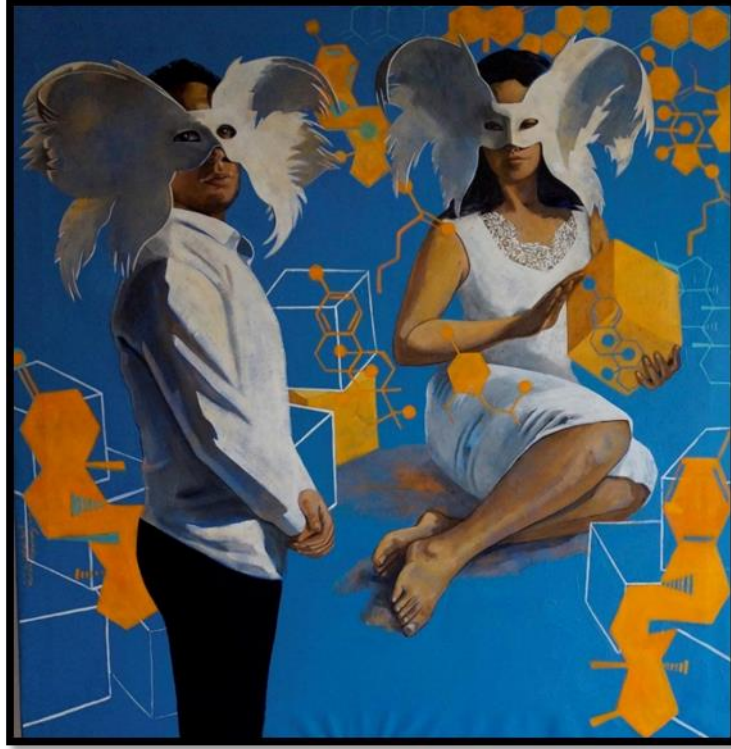
شكل رقم (٦) - من أعمال الباحثة - الاستروجين والتسترون-١٢٠ x ١٢٠ سم - زيت على توال - ٢٠٢٠

التسويق هو احد اشهر سمات عصرنا الحالي و الذي تعبر عنه لوحة شكل رقم (٥)، حيث استخدمت الفنانة الباحثة هذا العمل الصيغة الكيميائية للتسويق، متداخل مع الجسد الإنساني وظل الجسد الإنساني في الخلفية فالتسويق عواقبه وخيمة على الشخص و على كل ما هو محيط به. التسويق هو اجراء يتخذه العقل عندما يكون الانسان في اقصى مراحل القلق. اتخذت من التضاد اللوني بين الأحمر و الأسود و الأزرق لنقل حالة القلق، مع نظر بالعنصر الأدمي للخلف ليؤحي بتأثير التسويق المعرقل.