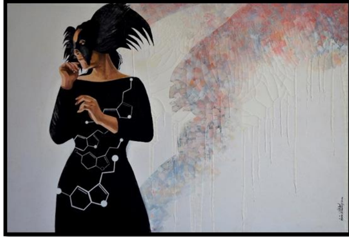
شكل رقم (٤) من أعمال الباحثة- اکتتاب - ١٢٠ x ٨٠ سم - زيت على توال - ٢٠٢٠