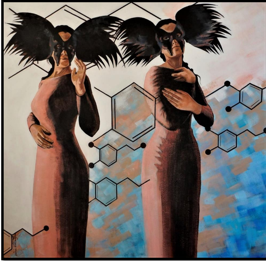
شكل رقم (٧) - من أعمال الباحثة - عدم اكتراث - ١٠٠ x ١٠٠ سم - زيت على توال - ٢٠٢٠