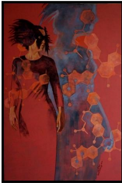
شكل رقم (٥) من أعمال الباحثة- تسويف - ١٢٠ x ٨٠ سم - زيت على توال - ٢٠٢٠

الهرمونات تشكل اقنعة يلبسها الانسان و يتعامل من خلالها في كثير من الأوقات دون دراية منه بذلك، اردت بالعنصر الأدمي في هذا العمل قناعها رداؤها الأسود، لكنها ظلها مفعم بالوان مبهجة . فالشخص المكتئب قد يكون الأكثر ابتسام و بهجة ظاهرية ، لكن بداخله يكمن صراع نتيجة هذا الخلل الهرموني[٤]. و من الجدير بالذكر ان الكثير من زوار المعرض تفاعلوا و تعاطفوا مع هذا العمل على وجه الخصوص بشدة و راوا فيه انعكاس لمشاعرهم الداخلية.