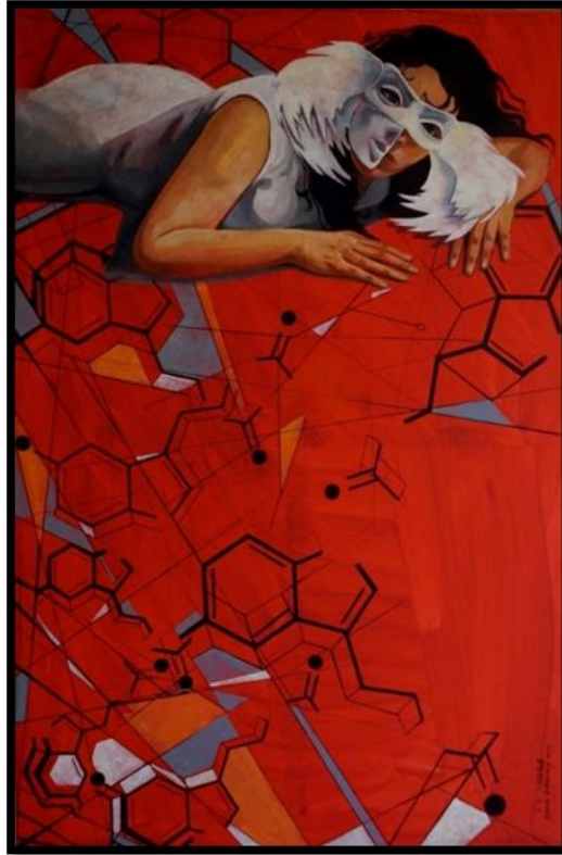
شكل رقم (١١) -من أعمال الباحثة- خلل الميلاتونين (أرق) - 120 x 80 سم - زيت على توال - ٢٠٢٠ Figure No. (11) - researcher artwork - Melatonin dysfunction (insomnia) - 120 x 80 cm - oil on canvas - 2020

يلعب هرمون الميلاتونين دوراً هاماً في دورة النوم والاستيقاظ الطبيعية الخاصة بك. وتعد المستويات الطبيعية للميلاتونين في الدم هي الأعلى في الليل. بعض الأبحاث تشير الى ان خلل مستويات الميلاتونين في جسم الانسان يسبب الكثير من