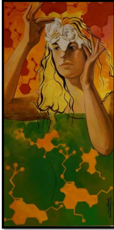
شكل رقم (٨) - من أعمال الباحثة- نور أدريالين- ٨٠ x ٤٠ سم - زيت على توال - ٢٠٢٠ Figure No. (8) – researcher artwork - Noradrenaline – 80X40 oil on canvas – 2020

اما في شكل رقم (٨) فيظهر قناع تلك الفتاة لا يغطي وجهها، ولكنه اشبه بالتاج فهو قناع للعقل الذي تلاعبت به الهرمونات فأظهر عكس ما يخفى في كثير من الأحيان [٦]. ننتقل الى مجموعة الناقلات العصبية الخاصة بالنوم ذلك العالم الموازي الذي ندخل الية و نخرج منه دون أي تحكم منا. هو زيارات يومية الى هذا العالم المليء بالإبداع. بعض الاحلام وردية الطابع و الاخر منها مخيف و لكن هذا لا ينفى صفة الابداع. ففي احلامنا تظهر مخلوقات ملائكية و تظهر مخلوقات مخيفة خيالية. هناك اصناف عديدة من الأحلام فهناك التصنيف الديني الذي ينقسم ال ثلاث أنواع وهم الرؤيا والحلم وحديث النفس وهناك أبحاث عن صحة وجود الفروق بين الرؤيا والحلم وحديث النفس وأصغاث الأحلام، وأن الحلم والرؤيا مُسميان للشيء ذاته، إلا أن الحلم يختلف عن الرؤيا وكذلك عن أصغاث الأحلام وحديث النفس، لكن في هذا البحث المنوط بثنائية العلم و الفن فسيتم تسليط الضوء على الحقيقة العلمية للأحلام فالكثير من الخبراء أرتئوا ان الأحلام قد تعكس الواقع الذي يعيشه الإنسان؛ لذا فإنه لا بد من إيلاء الاهتمام للأحلام، الأمر الذي من شأنه أن يساعد الفرد على فهم ذاته بشكل أفضل. وبحسب المنظور العلمي للأحلام، فإنها تحدث في إحدى مراحل النوم التي تُعرف بحركة العين السريعة، و معظم المشاعر التي يعيشها الشخص في حلمه تكون سلبية، وتتمثل عادةً بالخوف والعجز والقلق؛ لذا فإن الأحلام قد تُتيح للفرد التخلص من هذه المخاوف ضمن بيئة منخفضة الخطر، كما أنها تساعد المرء على مواجهة المواقف الخطرة التي رآها في نومه- عندما تصبح واقعية في حياته.