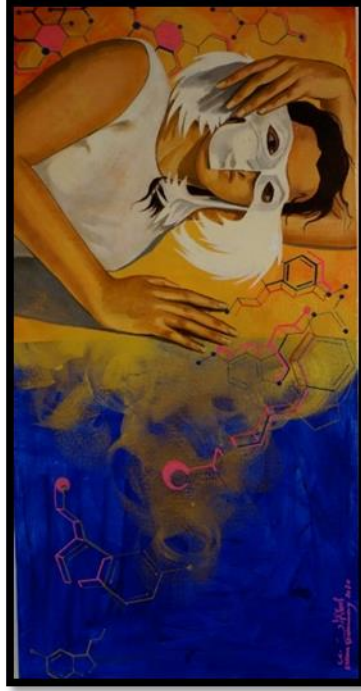
شكل رقم (١٠) -من أعمال الباحثة- أحلام ذهبية - 40 x 80 سم - زيت على توال - ٢٠٢٠ golden dreams - 40 x 80 cm - oil on canvas - 2020 Figure No. (10) - researcher artwork -