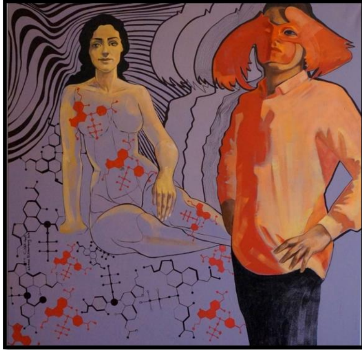
شكل رقم (١٥) - من أعمال الباحثة- اندورفين - 100 x 100 سم - زيت على توال - ٢٠٢٠