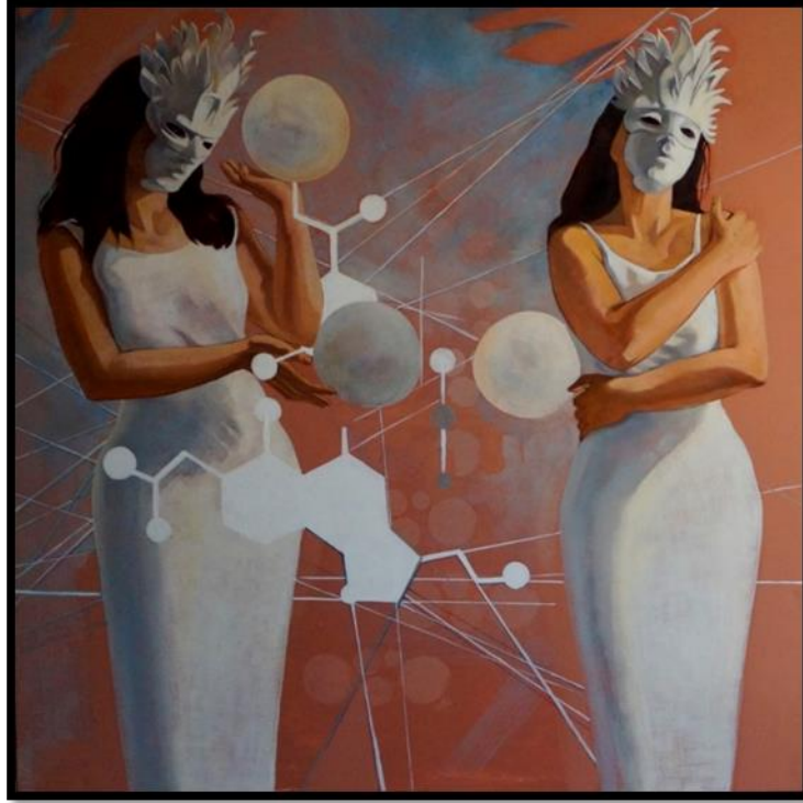
شكل رقم (١٤) - من أعمال الباحثة- ابداع ٢ - 100 x 100 سم - زيت على توال -2020 Figure No. (14) – researcher artwork - Creativity 2 - x 100 100 cm - oil on canvas - 2020

كيفية تحقق هذه الحالة الإبداعية المبهجة؟ ، يشكل تحدى في المجتمع المعاصر المليء بالتوتر. تعمل الطفرات في هرمونات التوتر مثل الكورتيزول على مقاومة تأثيرات تعزيز الإبداع للسير وتونين. بالإضافة إلى ذلك ، يميل الأشخاص المرهقون إلى الانغلاق على أفكارهم القديمة. و عدم البحث عن أي جديد. فالدراسات التي أجريت على قردة البابون ، أشارت الى أنه عند تعرضهم للإجهاد ، فإنهم يرفضون البحث عن مناطق جديدة (أو رقاء ، في هذا الشأن). اما بالنسبة للبشر ، فهم أيضا يلتزمون بأفكارهم القديمة و لكنهم يصبحوا أكثر ميلاً للالتزام بالألفة عندما يتعرضون لضغوط شديدة. يمكن أن يكون تؤثر جودة النوم بشكل سلبي على الإبداع. فالأبحاث توصلت الى إن الانسان يحتاج إلى ما يصل إلى ساعتين من النوم العميق كل ليلة حتى يتمكن الدماغ من استعادة المستويات المناسبة من السيروتونين. يمثل هذا النوع من النوم العميق أقل من ٣٠ في المائة من متوسط نوم الشخص. تميل مستويات السيروتونين إلى أن تكون أعلى في الصباح ، مما يجعلها الوقت الأمثل للإبداع و العصف الذهني و إيجاد حلول مبتكرة للتحديات.