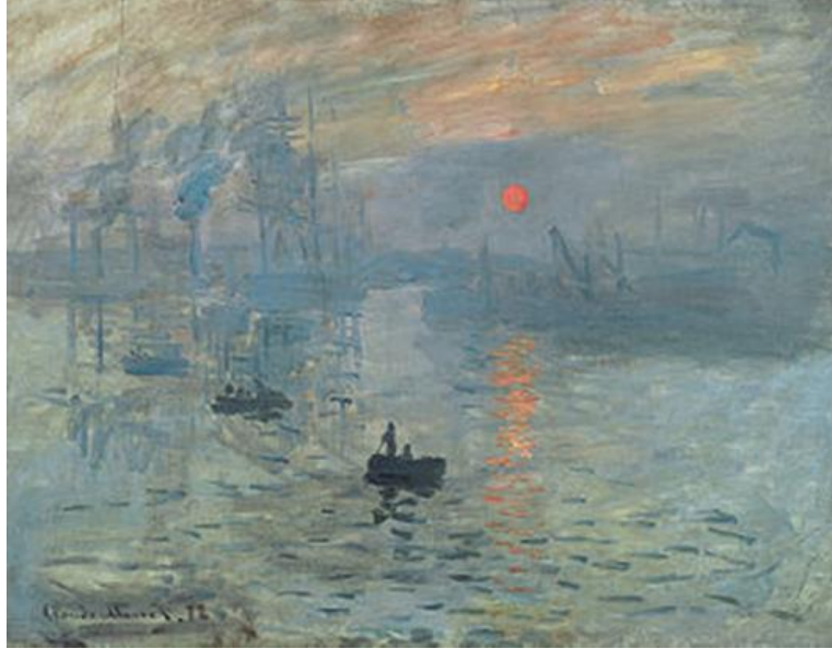
شكل رقم (٢) - كلود مونيه - تاثير - ١٨٧٢ - زيت على توال - متحف مارموتان مونيه - باريس- [٩]

Claude Monet, Impression, soleil levant (Impression, Sunrise), 1872, oil on canvas, Musée Marmottan ]9 [ Monet, Paris.