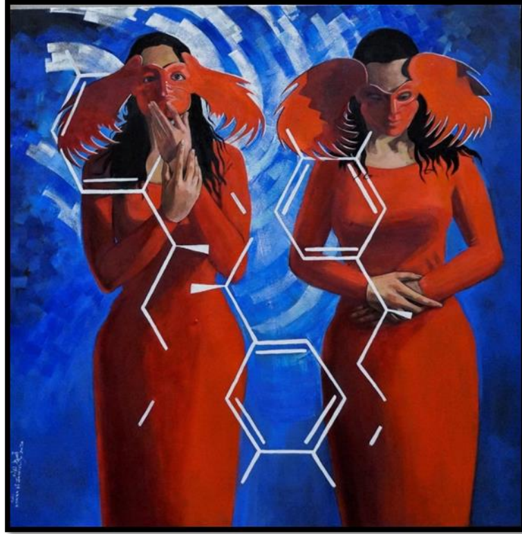
شكل رقم (١٧) - من أعمال الباحثة - ادريالين - 100 x 100 سم - زيت على توال - ٢٠٢٠