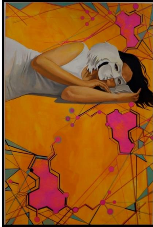
شكل رقم (٩) - من أعمال الباحثة - أحلام وردية - ١٢٠ x ٨٠ سم - زيت على توال - ٢٠٢٠ Figure No. (9) – researcher artwork - Pinky dreams - 120 x 80 cm - oil on canvas – 2020

ومن جانب آخر، قد لا تعكس الأحلام ما يعيشه الشخص ويواجه في حياته اليومية، إلا أنها تشير إلى مشاكله بطريقة ما، ومن الجدير بالذكر، أن حقيقة الأحلام علمياً تُشير إلى أن الدماغ يمكنه تذكير الشخص ببعض الفترات التي عانى خلالها من الناحية النفسية؛ لعدم قدرته على فعل أمرٍ يخشاه، كخوفه من خوض امتحانٍ لم يستعد له بشكلٍ كافٍ، وهذا النوع من الأحلام يُسهم بزيادة الثقة عند الشخص لتجاوز الاختبار على أرض الواقع. و من هذا نستنبط ان الاحلام هي منطقة لحل و تجاوز التحديات الواقعية و الوصول الى التصالح النفسي مع بعض مناطق الضعف في شخصياتنا.