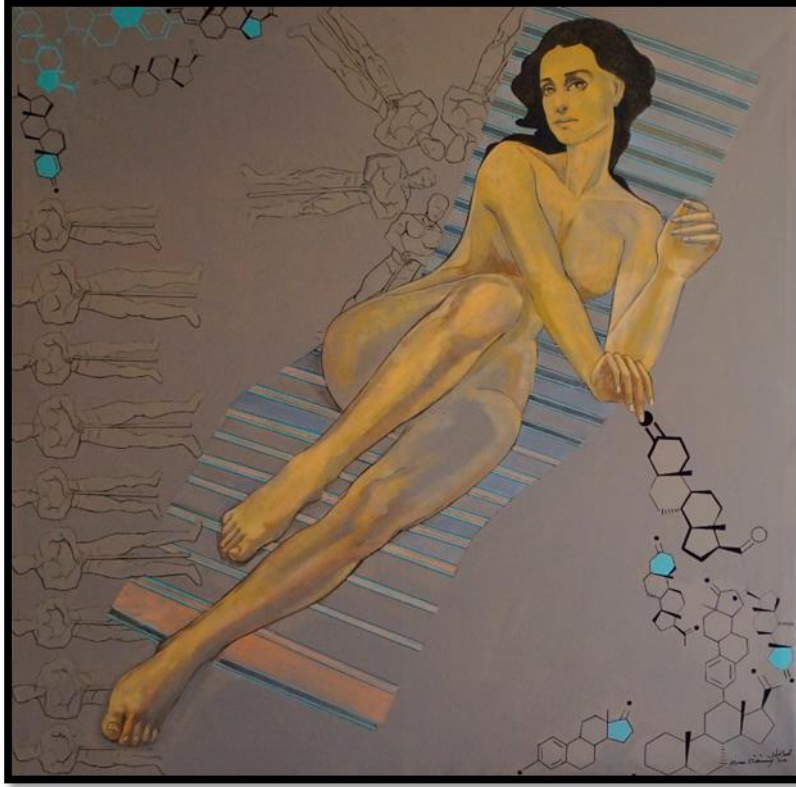
شكل رقم (١٦) - من أعمال الباحثة- بروجستيرون - 100 x 100 سم - زيت على توال - ٢٠٢٠