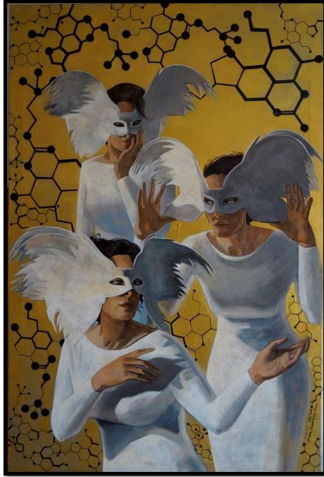
شكل رقم (١٣) - من أعمال الباحثة- ابداع 1- ١٢٠ x ٨٠ سم - زيت على توال - ٢٠٢٠