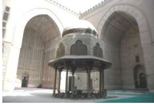
صورة (1) لقطة long shot لمنظر صحن مسجد السلطان حسن ، حيث بهو صحن المسجد وإيوان المسجد حيث التصميم المعماري والتشكيلي الرائع

ويعد استعراض كل ما سبق سوف أقوم بعرض نموذج تحليلي لكيفية إبراز دور الصورة الفوتوغرافيا الذي لا يمكن إهماله داخل أى من وسائل الإعلام المختلفة والتي تعرض الحضارة الإسلامية بالشكل الأمثل والمعير عن أهمية هذا التراث من شموخ وعظمة وقوة وتمتع غنى وفريد وجذاب من الزخارف والنقوش والإبهار اللوني والتقنى، والذي يبرز قيمة هذه الحضارة ويعرضها بشكلها الفعال أمام العالم أجمع ، وهى مجمعة من الصور الفوتوغرافية التي تعرض بعض من ملامح الحضارة الإسلامية لمسجد السلطان حسن أحد أهم المساجد الموجودة بمصر القديمة .