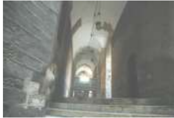
صورة رقم (3) لقطة long shot لمدخل مسجد السلطان حسن ، حيث البهو ودرجات السلم الحجرية والحوائط الحجرية والتي تدل على عبق التاريخ