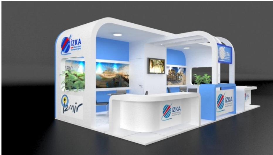
شكل ( 6 ) نموذج لجنح معرض

يمكن إدراك المفهوم الخاص بأجنحة المعارض من كونها أحد الوسائل الإعلانية الجيدة في نقل المعرفة لعدد كبير من المتلقين ، حيث تشكل دافعا" للإبداع والإبتكار في إنتاج الكثير من الرؤى الإعلانية ، وجمع العديد منها لإبراز النشاط العام للشركات المعلنه . وتشمل أجنحة المعارض كل ما يمكن عرضه لتوصيل أفكار ، ومعلومات معينة إلى جمهور المتلقين ، وتندرج محتوياتها من أبسط أنواع الوسائل ، والمصورات ، والنماذج ، إلى أكثرها تعقيداً كالشرائح والأفلام الرقمية والإعلانات التفاعلية.