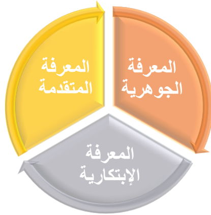
شكل ( 3 ) مستويات المعرفة البصرية