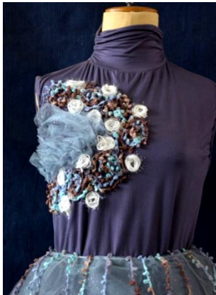
شكل (26) الخامات مثبتة على التصميم