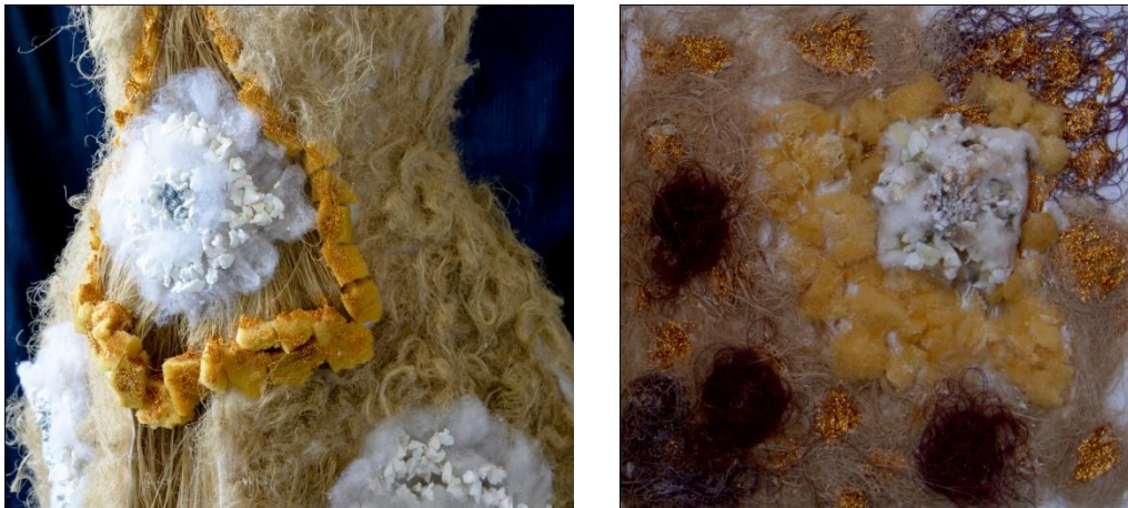
شكل (13) الخامات المستخدمة في التصميم الرابع