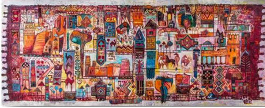
الشكل ٢ طه صبان (٢٠١٣)

منذ القدم والطبيعة أو البيئة التي يعيش بها الإنسان هي المصدر الأول الذي يستلهم منه في تلبية احتياجاته، والفن جزء من احتياجاته لتنقيس عن نفسه. كما أن الطبيعة مصدر كبير وثرى بالمشاهد والعناصر التي لا حصر لها. والمملكة العربية السعودية تمتاز بتنوع تضاريسها فمنها الساحلية والصحراوية والجبلية. فنجد العديد من الفنانين السعوديين تغنت أعمالهم الفنية بهذه المناطق، وذلك لقربهم وانتماءهم للطبيعة المحلية التي تربوا وعاشوا فيها. (الشكل ٢)