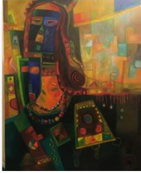
الشكل ٦ إبراهيم النغيثر - امرأة من التراث (١٩٩٧)

https://miskartinstitute.org/ar/artists/ibrahim-al-nughaythir