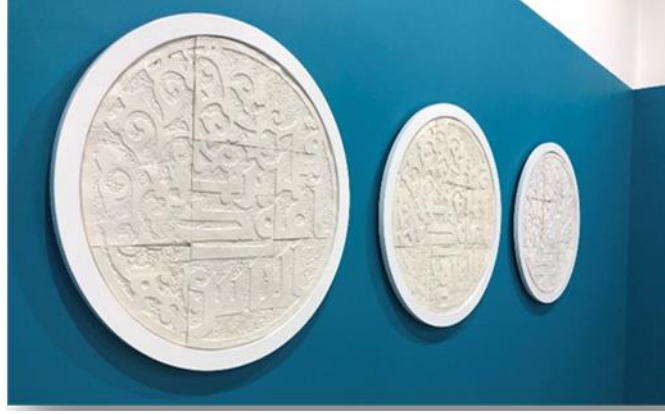
الشكل ٩ الفنان عمار سعيد جدارية خزفية

https://twitter.com/drabdulla/status/1371197329160691712/photo/3