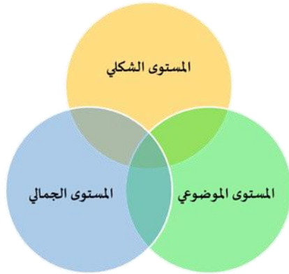
الشكل ٧ مستويات توظيف الهوية في العمل الفني تصميم الباحثة