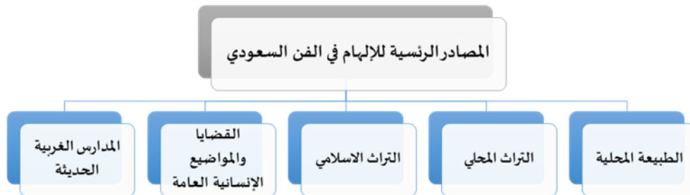
الشكل ١ مصادر الإلهام للفنان السعودي

والفنان على وجه الخصوص مرهف الإحساس دائم التأمل في جميع المجالات، باحثاً عما يسقي به أفكاره ويعمل على صياغتها بأعمال فنية مبتكرة، وغالباً ما تكون هذه المصادر من أصول زمانية أو مكانية، مادية كانت أو معنوية. والمملكة العربية السعودية غنية بالمصادر الرئيسية التي تشكل الملامح العامة في الفن السعودي، ويذكرها الرصيص (٢٠١٠) كالتالي: (٣) (الشكل ١)