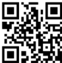
شكل 2 الباركود ثنائي الأبعاد

وهذا النوع يعطى معلومات اكثر تاخذ شكل مصفوفة وفى الغالب يكون على شكل صورة كما هو الحال فى الباركود الموجود على الهوية الشخصية والذى من خلاله يمكن استنتاج الرقم الوطني صاحب الهوية بالأبيض والأسود وأبضا يوجد منه انواع مختلفة نذكر منها - PDF417 – QR Code – Maxi Code – Data Matrix