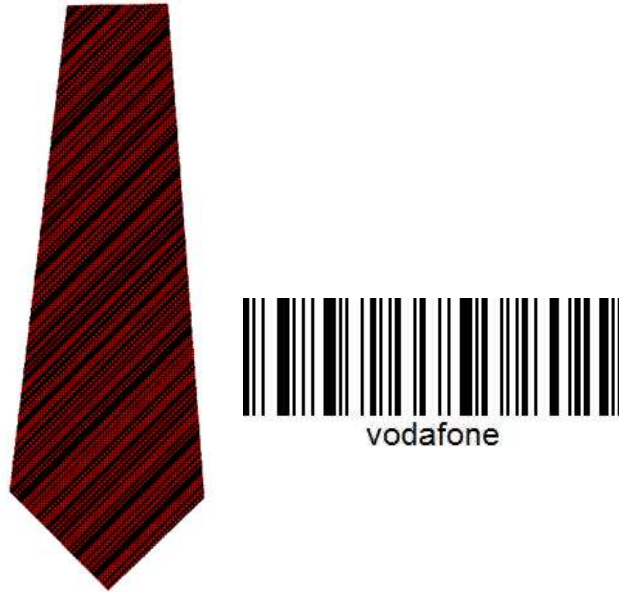
شكل 13 التصميم الثاني - شركة فودافون الباركود الأصلي و ترتيب الأقلام