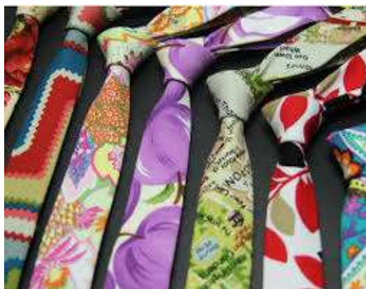
شكل 10 ربطة العنق المطبوعة

ويتميز هذا النوع من ربطة العنق بتنوع الاشكال المستخدمة فيه من زهور وحيوانات وحرية في توزيع الاشكال و الالوان وغالبا ما تصنع من الحرير الطبيعي و الصناعي ويمكن استخدامها في المقابلات و المناسبات حسب نوع الزخرفة