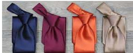
شكل 3 ربطة العنق السادة

هى اكثر انواع ربطة العنق انتشارا و استخداما ، ويمكن ارتداؤها مع القمصان السادة والمقلمة و الكاروهات بسهولة دون احتياج لعمل تناسق او تجانس بين باقى الملابس اثناء الاستخدام وهى تصلح لكافة الاوقات و المناسبات مثل العمل والمقابلات الرسمية و السهرات و المناسبات