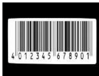
شكل 1 باركود احادي الابعاد

MSI/Plessey – RSS – Code 39 – Code 93 – Code 128 ISBN