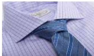
شكل 4 ربطة العنق الانجليزي

وهى تعد من اعرق و اقدم طرز ربطة العنق و التي تتميز بوجود تقليمات ذات ميل متجه من الكتف الأيسر ( ناحية القلب ) نزولا الي الجانب الأيمن من الوسط ولها تاريخ كبير وواسع فى الاستخدام فى الملابس الرسمية للجيش والجامعات والمدارس وغيرها وهى اي تصلح لكافة الاوقات و المناسبات مثل العمل والمقابلات و المناسبات و السهرات وايضا مع كافة القمصان