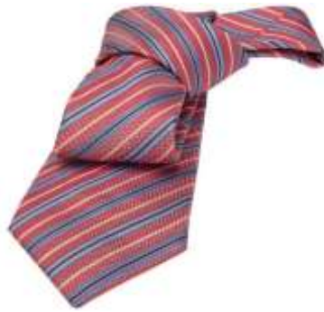
شكل 7 ربطة العنق ذات التقلييمات الزخرفية

ويتميز هذا النوع من ربطة العنق بوجود اقلام متنوعة الابعاد و الاشكال و الالوان و التى تعطى ملامس ومظهرية متنوعة ومميزة خاصة لأنها تكون منسوجة و ليست مطبوعة