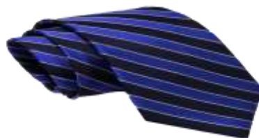
شكل 5 ربطة العنق الامريكية

وهى النظير المعاصر لربطة العنق الانجليزية والتي تتميز بأن تقليماتها تبدأ من جهة الكتف الأيمن نزولا للجانب الأيسر وذلك للتمييز بين المؤسسات الانجليزية و الأمريكية ويمكن استخدامها مع كافة القمصان