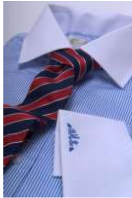
شكل 6 ربطة العنق لطلاب الجامعات

وهى تتميز بتقلييمات متساوية الحجم بطول ربطة العنق وتعد من الانواع المعاصرة والتي يمكن استخدامها مع القمصان السادة و الكاروهات ولكنها تعطى نتائج جيدة مع القمصان ذات الاقلام الرفيعة والضيقة جدا