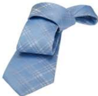
شكل 9 ربطة العنق الكاروهات

وهي تميز بوجود المربعات و المستطيلات الناتجة من تقاطع الاقلام الطولية مع العرضية ، وهذا النوع يفضل استخدامه في المقابلات غير الرسمية والنزهة الترفيهية اكثر من المقابلات الرسمية فهي للملابس غير الرسمية والتي زاد انتشارها الان بين الشباب وخاصة في فصل الصيف