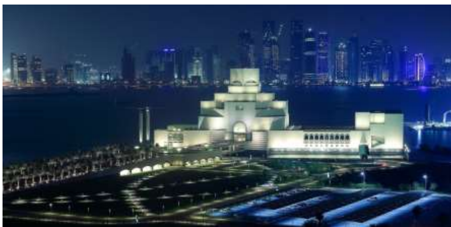
شكل (13) متحف الفن الإسلامي (الدوحة) 22

متحف الفن الإسلامي بالدوحة وقد صممه المهندس المعماري الأمريكي من أصل صيني أي إم بي Pei leoh Ming وهو الذي صمم الهرم الزجاجي أمام متحف اللوفر وقد أستلهم تصميم المتحف من قبة نافورة الضوء لمسجد أحمد بن طولون بالقاهرة وأخذ منها روح التصميم للمتحف وهذا نموذج علي كيفية رؤية الفنون وكيفية مزجها مع الفنون الحديثة.