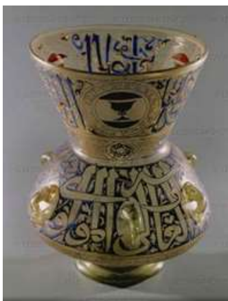
يظهر لنا هنا أهمية دور الخطوط الإسلامية وجماليتها في الكتابية على الأنية الزجاجية 20 العصر المملوكي القرن الرابع عشر ، مصر شكل ( 12 )

فالفن الإسلامي هو فن تعبيرى روحانى مرتبط بالدين و "إذا أدركنا أن الفن هو محاولة البشر تصوير حقائق الوجود وانعكاسها في نفوسهم في صورة موحية جميلة وأن مكان الفن والفنان يتحدد بمدى المساحة التي تشملها الحقيقة التي يشير إليها العمل الفني أو يرمز لها من كيان الكون إذا أدركنا ذلك فقد أدركنا في ذات الوقت أن الفن الذي ينبثق عن التصوير الإسلامي للكون والحياة والإنسان هو أرفع فن تستطيع أن تنتج البشرية". 21