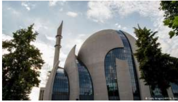
27 مسجد كولونيا الكبير في ألمانيا...تسامح ديني: تصميم هندسي غربي ألماني على الطراز الإسلامي العثماني شكل (18)