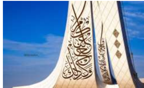
25 مسجد الكريستال - مدينة كوالالترينجانو, ماليزيا شكل (17)

إن الذي نحتاج إليه الآن هو الإبداع وليس التكرار والتقليد وذلك من خلال رؤية فنية خاصة بنا . حيث إن مسألة التراث إحتلت في ثقافتنا المعاصرة مكاناً بارزاً "وتصاعد الإهتمام بها سعياً إلي تلمس معالم تراثنا الأساسية وإدراك ما يتضمنه من قيم أسهمت إسهاماً كبيراً في عملية التطور الحضاري . ومن البديهي أن تهتم جميع الشعوب بتراثها وأن تبحث في ماضيها عن جذور ثقافتها الراهنة بما تمثله من إستمرار لها" 26