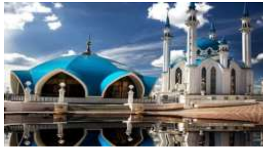
مسجد "قول شريف" في كازان | روسيا يمثل طرازاً معمارياً متميزاً وتحفة جمالية شكل (15) 24