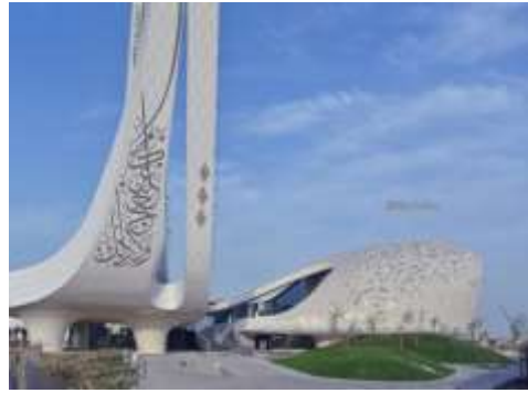
روعة التصميم في مسجد المدينة التعليمية في قطر شكل (7) و.