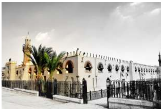
جامع عمرو بن العاص بني في مدينة القسطنطينية التي أسسها المسلمون في مصر بعد فتحها (القاهرة) شكل ( 4 ) 5

و قد شاع أستخدام الزجاج المعشق و الرصاص و الجبس و من أشهر الأمثلة الجامع الأموى بدمشق و جامع أحمد ابن طولون و جامع عمر ابن العاص