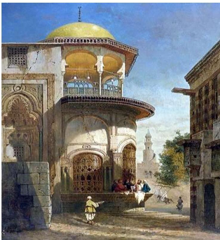
شارع فى القاهره القديمه للفنان Adrien Dauzats 14

إن الفن الإسلامي فن فريد من نوعه فله طابعه الخاص الذي يميزه فعندما تفتح كتاباً للمدارس الفنية والحضارات المختلفة سهل علي المتلقي قول هذا العمل ينتمي إلي الحضارة الإسلامية وذلك لعدة أسباب (اللون – التصميم-الفكر والمنظور المميز لهذا الفن) كلها عناصر متعددة تميز هذه الحضارة التي حافظت عل البيئة منذ مئات السنين فاستخدمت المواد المستدامة التي تتوافق مع البيئة من طوب لبن إلي الإهتمام بالإضاءة الطبيعية والتهوية الجيدة عن طريق المشربيات وملاقف الهواء والخصوصية والمحافظة علي حرمة المنازل وهي أهم ما يميز العمارة الإسلامية للمسكن والتي امتازت بجماليات عديدة فالمشربيات جاءت لتغطي الشبائيك وتقوم بعدة أدوار منها الإضاءة الساحرة الهادئة والتهوية والنظر إلي الخارج عن طريق فتحة لا تظهر من بداخل الشباك وينظر منه. وقد " كانت العمارة في مختلف عصور التاريخ ، من عصر قدماء المصريين إلي العصر الحديث هي الصورة الصادقة و التعبير الرقيق لحضارة الإنسان و تطوره و رقيه " (12) حيث أن" الثقافه و التقدم العلمى و الفنئ و الصناعى و التكنولوجى لن تقف عند حد و العماره ما هى إلا مرآه تنعكس عليها مجموعه من المتوازيات التى تسير جنباً إلى جنب مكونه ثقافه الشعب و مدينته تلك المتوازيات التى تمثل فيما يعبر عنه بطابع الشعب " (13) لقد تميزت العمارة الإسلامية بغنى مفرداتها المعمارية، واهتمامها بالنواحي الحياتية جميعها، فظهرت المباني الدينية و الأبنيه المدينه الخاصة بالقصور و المنازل و الأبنيه العامه و الحدائق العامه . و قد تميزت العمارة الإسلاميه بغنى مفرداتها إنها الحضارة الإسلامية التي عنت بكل ما يخص الإنسان وتعمل علي جعل حياته أفضل وأجمل