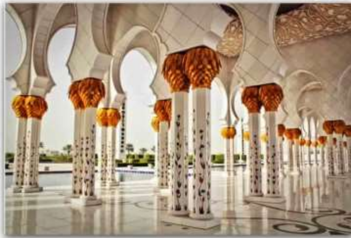
مسجد الشيخ زايد بن أبو ظبي تحفه معماريه مع روح الفن الحديث 29 شكل (20)

و نلاحظ هنا جماليات التصميم و استخدام اللون الذهبي ليبيرز جماليات الزخارف الفنية مع مزج روح الفنون الحديثه و جماليات الفن الإسلامي