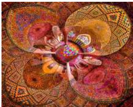
شكل (8) مسجد فاطمه ايران

و قد أهتم الفنان المسلم بدراسة الزخارف الهندسية من حيث التكوينات و الخطوط و اللون و كان يعتمد على دور الضوء و الظل في كثير من أعماله الفنية و تعددت أنواع الزخارف فمنها الهندسية و النباتية و الخطية و عناصر زخرفية مشتقة من الكائنات الحية كاستخدام الحيوانات في زخارفهم و كانوا يهتمون بصفة عامة بملء الفراغات بالأشكال و الألوان و الزخارف و لقد كان الفنان المسلم يفضل الإبتعاد عن المحاكاة و التقليد للكائنات الحية لذلك فقد إستخدم الزخارف النباتية و الزخارف الهندسية و تجلى ذلك في الأطباق النجمية مع التكرار و قد أهتم الغرب بهذه الزخارف و قاموا بدراستها و التأثير بها مثل ليوناردو دافنشي الذي قام بدراسة الزخارف الإسلامية و Gustav Klimt. غوستاف كليمت و تعتبر الخطوط من أهم الميادين التي تميز فيه الفنان المسلم . حيث ابتكر طرزاً مختلفة للكتابة و طوعها لتخضع لفكرة التصميم من خلال استخدامها كعنصر زخرفياً يمتلئ بالحركة و الجمال من خلال الخطوط المنحنية