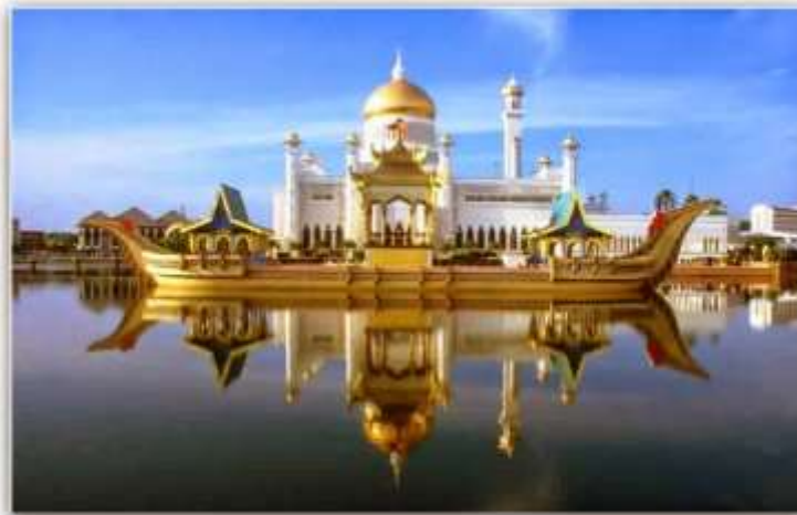
مسجد شواتنجر - الماني 28 شكل (19)

و نلاحظ هنا جماليات التصميم و استخدام اللون الذهبي ليبيرز جماليات الزخارف الفنية مع مزج روح الفنون الحديثه و جماليات الفن الإسلامي