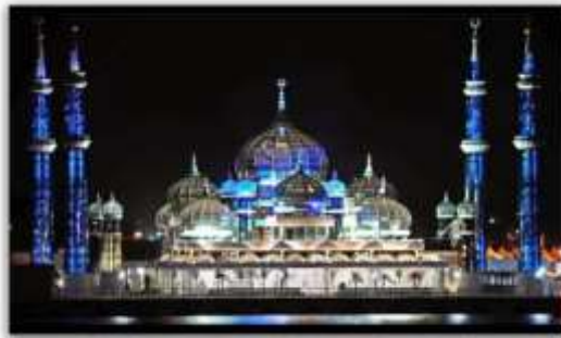
روعة التصميم في مسجد المدينة التعليمية في قطر شكل (16)