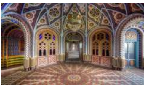
من تأثير الفن المعماري الإسلامي في أوروبا ؛ قلعة ساميزانو في مدينة فلورنسا الإيطالية شكل ( 3 ) 4

و قد أعتد الفن الأسلامى على التجريد و الرمزية و اهتم الفنان المسلم بروح المساواة بين الأفراد مثال لذلك الأربيسك الذى أعتد على الفرد كجزء فنجد القطعة الصغيرة هى الوحدة للتصميم الكامل و هكذا إلى عالم لا نهاية له . كما ظهرت الرمزية فى الفنون الإسلامية عن طريق إستخدام المربع و الدائرة فالمربع يمثل العلاقة بين العناصر الأربعة المكونة للطبيعة " الهواء - النار - التراب - الماء " .