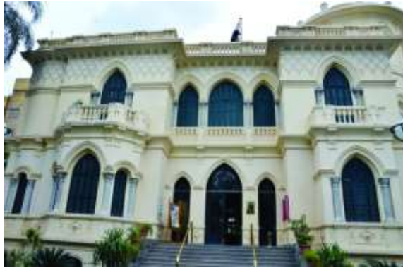
23 قصر الأميرة سميحة كامل بالقاهرة و هو تحفة معمارية إسلامية تبرز جمال و براعة الزخارف مع الوحدات المستخدمة في الواجهة شكل (14)