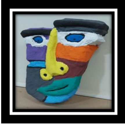
شكل رقم (6)