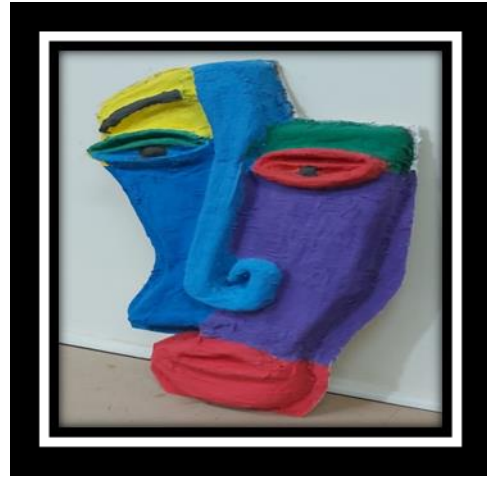
شكل رقم (1)