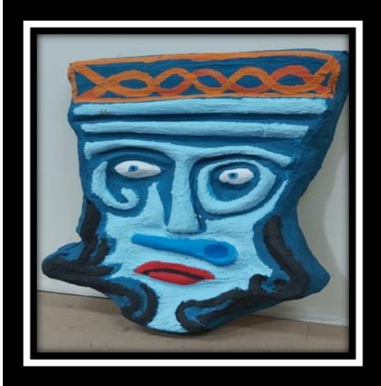
شكل رقم (18)