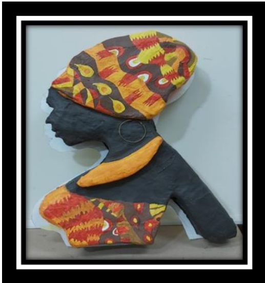
شكل رقم (14)