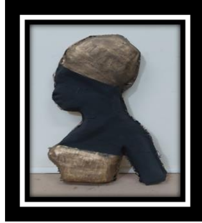
شكل رقم (5)