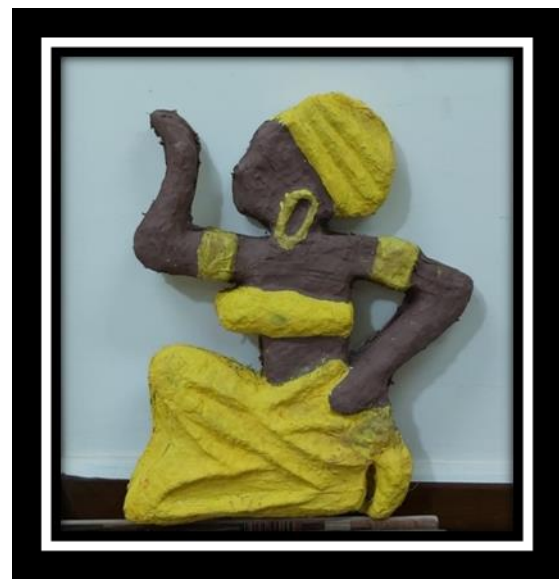
شكل رقم (9)