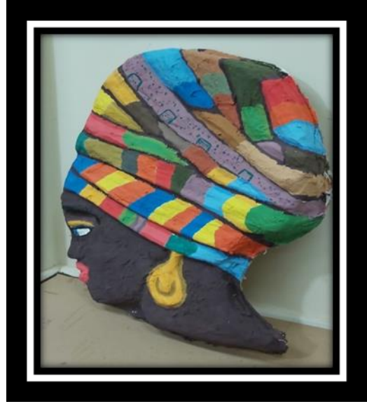
شكل رقم (23)