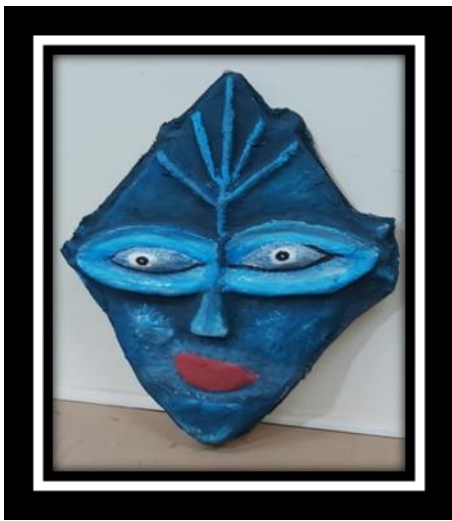
شكل رقم (4)