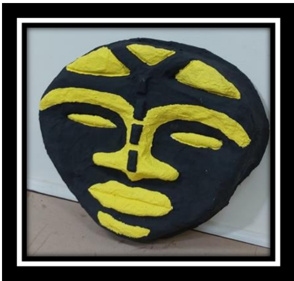
شكل رقم (16)