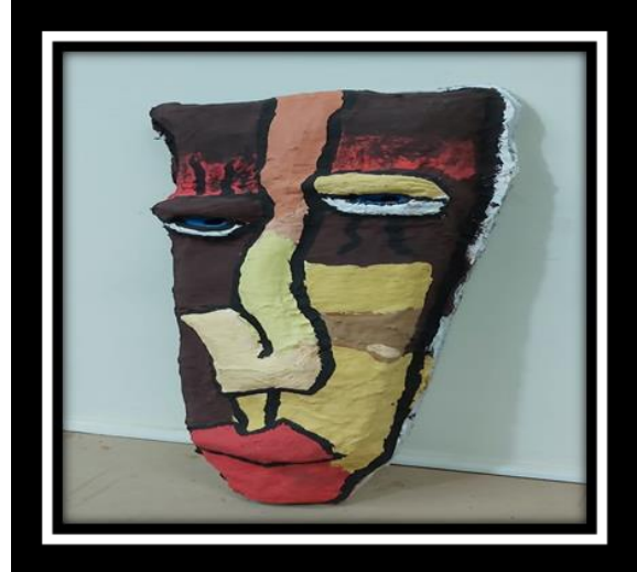
شكل رقم (17)