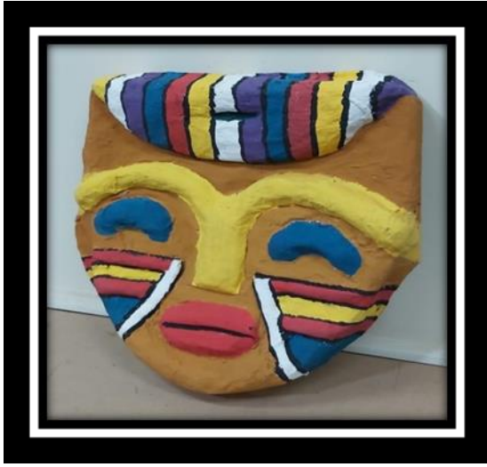
شكل رقم (24)