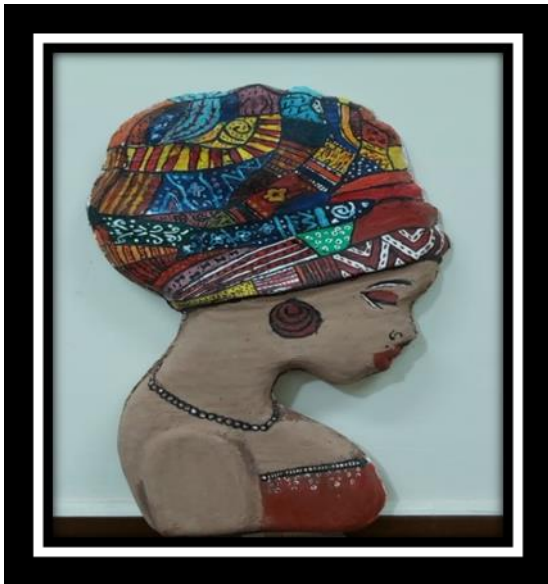
شكل رقم (20)