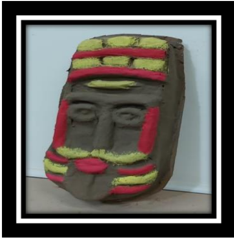
شكل رقم (2)