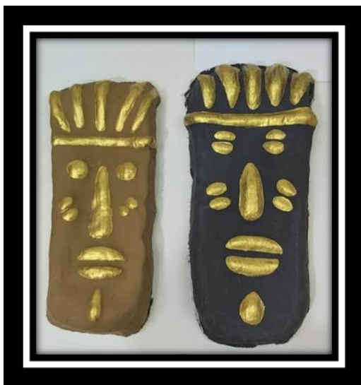
شكل رقم (22)