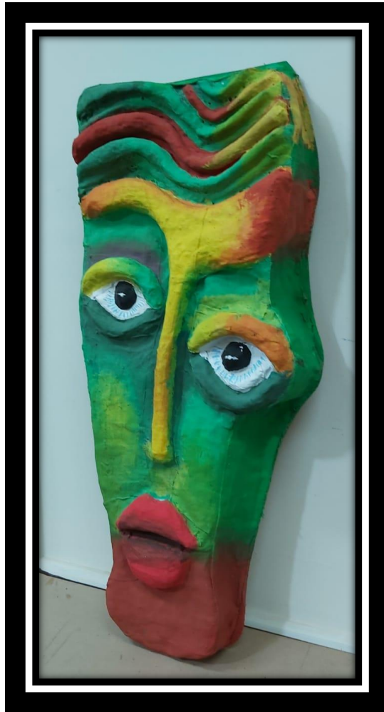
شكل رقم (25)