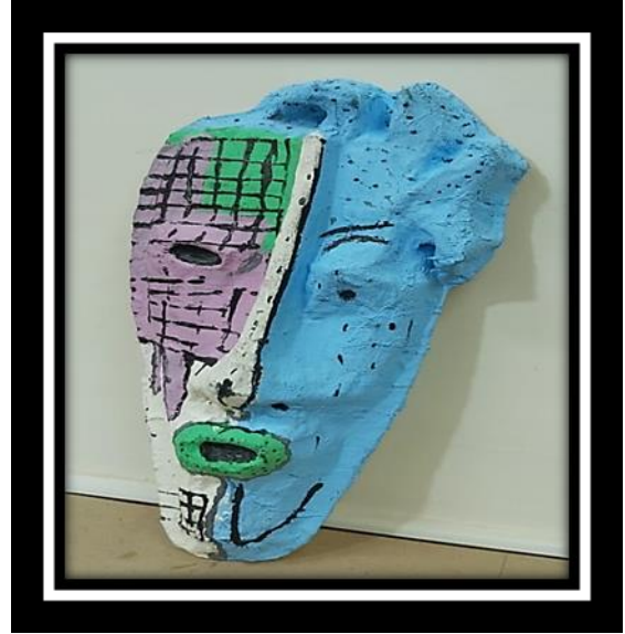
شكل رقم (11)