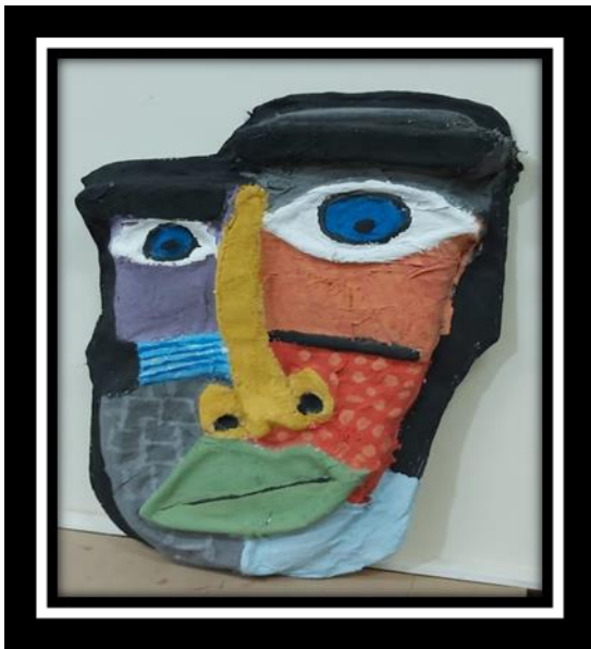
شكل رقم (8)