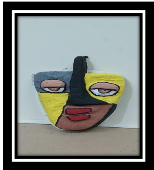
شكل رقم (13)