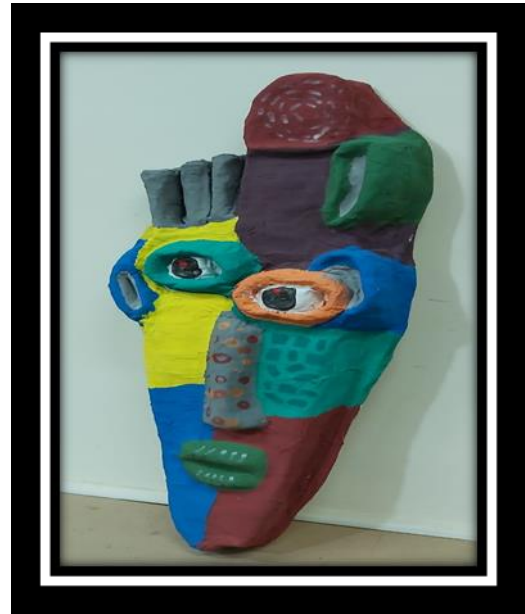
شكل رقم (7)