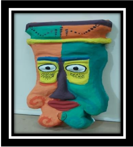
شكل رقم (12)