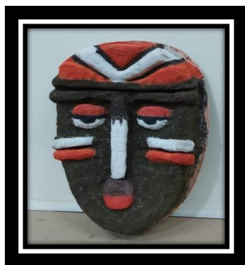
شكل رقم (21)