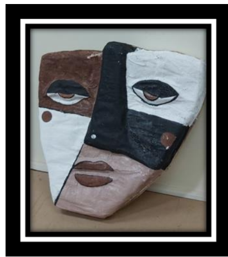
شكل رقم (3)