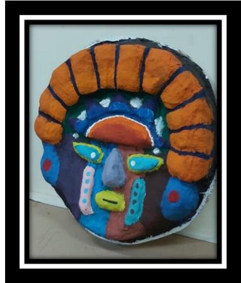
شكل رقم (15)