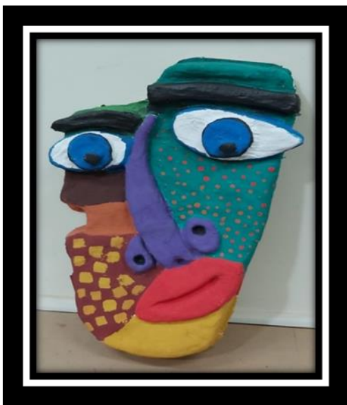
شكل رقم (10)