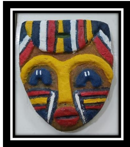
شكل رقم (19)