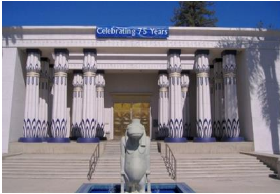
شكل رقم (14) متحف روزى كروسيان - سان خوزيه 1960 https://www.sfu-

ويعتبر متحف "روزي كروسيان" بمدينة "سان خوزيه" (شكل 14) بولاية "كاليفورنيا" الذي شيد عام 1960 آخر مبنى تم تشييده على النمط المصرى فى المرحلة الثانية، وهو يضم أكبر مجموعة من الآثار المصرية فى غرب الولايات المتحدة [30].