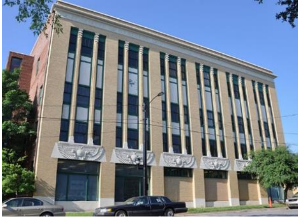
شكل رقم (32) محفل "شيلبى" - كارولينا الشمالية 1925

وفى المرحلة الأولى اعتمد الأسلوب التاريخى بنوعيه على الارتباط بطراز النيو كلاسيك فى 15 حالة بنسبة 52%، وأسلوب الحدائث فى حالة واحدة بنسبة 3%، وفى المرحلة الثانية اعتمد على الارتباط بطراز النيو كلاسيك فى خمس حالات بنسبة 23%، وأسلوب الأرت ديكو فى ثمان حالات بنسبة 36%، وأسلوب الحدائث فى سبع حالات بنسبة 32%. أما الحالات المحلية فقد اعتمد الأسلوب التاريخى المركب على الارتباط بطراز النيو كلاسيك فى حالتين بنسبة 22%، هما متحف الإسماعيلية وكلية الهندسة بالإسكندرية، وأسلوب الأرت ديكو فى حالتين بنفس النسبة، هما مداخل حديقة الحيون ومحطة قطار الأقصر.