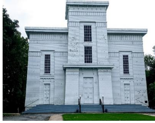
شكل رقم (3) كنيسة أولد ويلر - نيويورك 1844

https://ecampania.it/event/posillipo-il-mausoleo-schilizzi-ara-votiva-mortificata-dai-catenacci