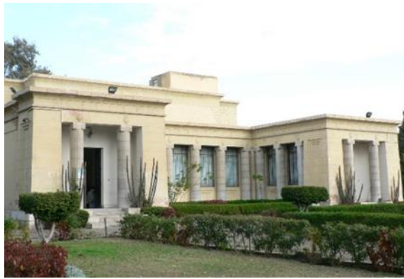
شكل رقم (22) متحف الإسماعيلية 1934