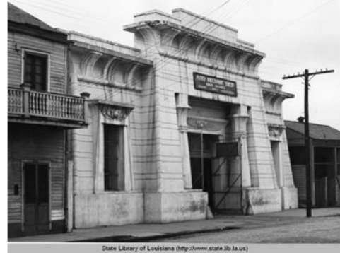
شكل رقم (7) مركز شرطة نيو أورليانز 1836