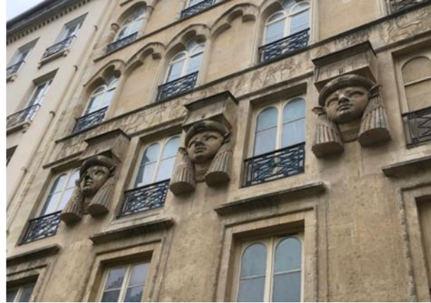
شكل رقم (31) واجهة عمارة سكنية - باريس 1828

https://soundlandscapes.wordpress.com/2017/04/18/place-du-caire-and-its-sounds