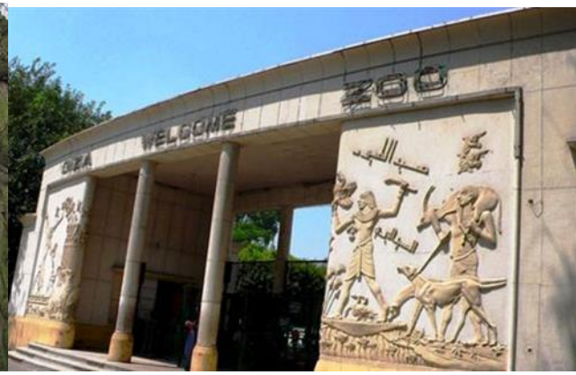
شكل رقم (23) مداخل حديقة الحيوان بالجيزة 1937