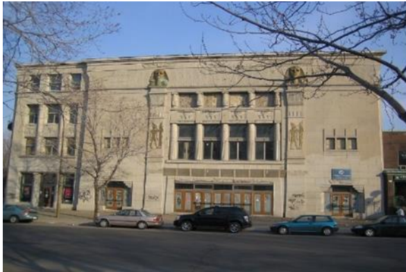
شكل رقم (30) مسرح الإمبراطورة - مونتريال 1927