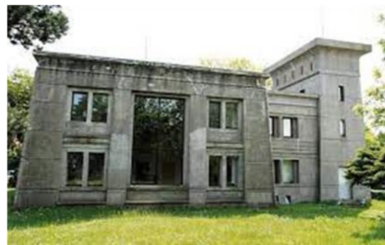
شكل رقم (11) فيلا تيفونيوم - كاليه 1891