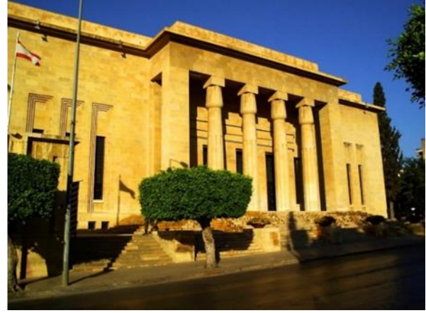
شكل رقم (27) متحف بيروت الوطنى 1930

https://en.wikipedia.org/wiki/Egyptian_Gate_of_Tsarskoye_Selo