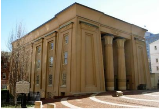
شكل رقم (10) كلية الطب - جامعة فرجينيا 1845

3-5-1-4 المباني التعليمية: شيد مبنى واحد في المرحلة الأولى في الولايات المتحدة عام 1845، وهو المبنى المصري كمقر لكلية الطب بجامعة فرجينيا بمدينة ريتشموند (شكل 10)، للمعماري "توماس سومرفيل"، وقد تحول لاحقاً إلى مبنى تذكاري للكلية، وتمت اعتباره معلم تاريخي وطني عام 1971 [26].