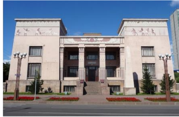
شكل رقم (13) متحف كراسنويارسك - روسيا 1914