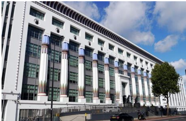
شكل رقم (16) مصنع كاريراس - لندن 1928