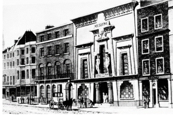
شكل رقم (18) مسرح بييرى المصرى - أوجدن يوتا 1924