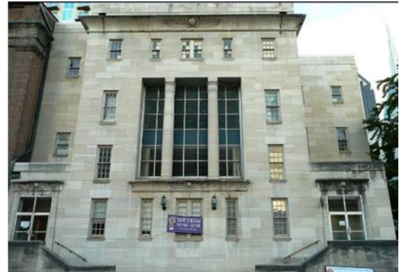
شكل رقم (29) كنيسة ناشفيل - نينيسى 1849

https://en.wikipedia.org/wiki/Empress_Theatre_(Montreal)