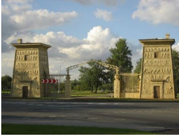
شكل رقم (28) بوابة منتزه سان بطرسبرج 1829

المصرية، المتمثلة في الأعمدة البردية والكورنيش المصرى، وكذلك محطة الأقصر (شكل 21) ومداخل حديقة الحيوان (شكل 23)، اللذان اعتمدا على الدمج بين طراز الأرت ديكو والمفردات المصرية، المتمثلة في الأعمدة المصرية والكورنيش المصرى والنقوش الهيروغليفية.