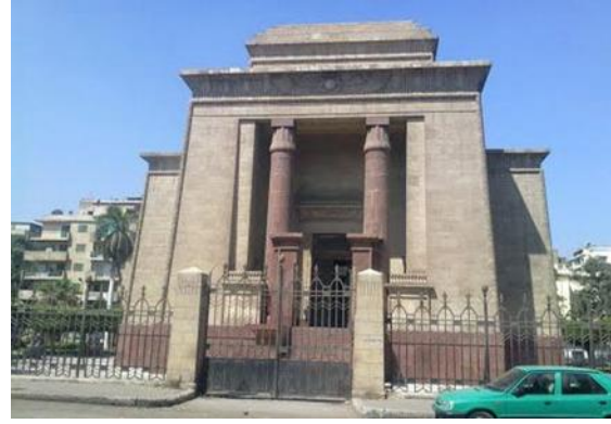
شكل رقم (19) ضريح سعد زغلول - القاهرة 1931