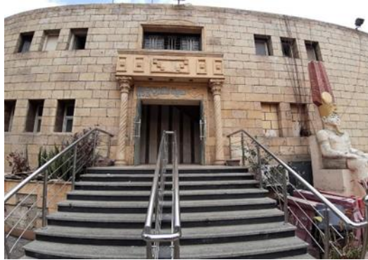
شكل رقم (26) ستوديو الجيب بحديقة المسلة تصوير ميدانى للباحث فى 11 أكتوبر

https://www.zoochat.com/community/media/zoo-antwerpen-egyptian-temple- elephant.176156/