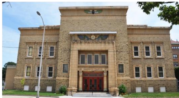
شكل رقم (5) محفل راسين - ويسكونسن 1923

https://www.roadarch.com/egyptian/ut.html