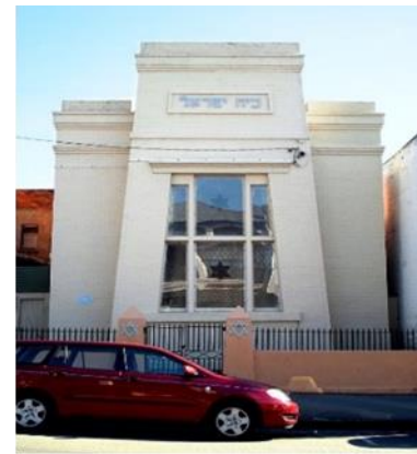
شكل رقم (1) كنيس لونسستون - أستراليا 1846