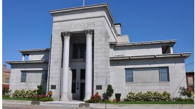
شكل رقم (9) بنك الإئتمان - وينونا 1914