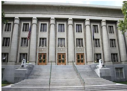
شكل رقم (6) محفل سولت ليك - يوتا 1927