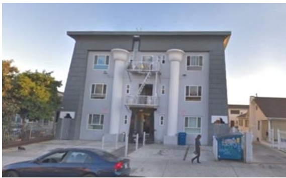
شكل رقم (12) مجمع ليكسنجتون - لوس أنجلوس 1926

5-1-3-5 المباني السكنية: شُيِّدت في المرحلة الأولى حالتين عمارة وفيلا سكنية، ومن أجمل أمثلة هذه المرحلة فيلا "تيفونيوم" (شكل 11) (الاسم الكلاسيكي لمعبد دندرة) التي شيدت عام 1891 بمدينة "ويسانت" بمقاطعة كاليه بفرنسا، للمعماري "إدموند دي فين"، وقد تم اعتبارها أثراً تاريخياً عام 1982 [27]. وظهرت في المرحلة الثانية ثلاث حالات عبارة عن عمارتين وفندق صغير، ومن أوضح الأمثلة مجمع "ليكسنجتون" (شكل 12) الذي شيد عام 1926 بمدينة "لوس أنجلوس"، للمعماري "جيري كلوز" [28].