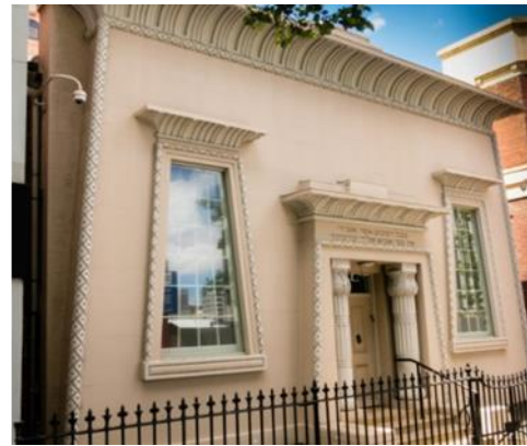
شكل رقم (34) مجمع أوزيريس السكنى - لوس أنجلوس 1928