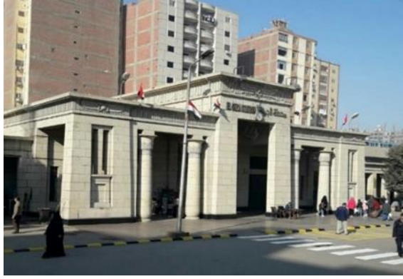
شكل رقم (20) محطة الجيزة 1931