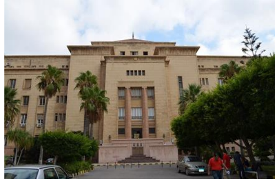
شكل رقم (25) كلية الهندسة جامعة الإسكندرية 1941