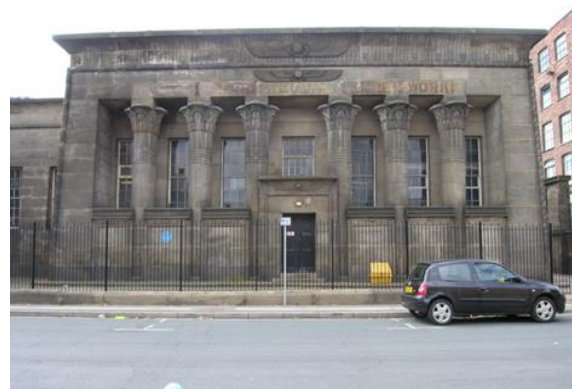
شكل رقم (15) مصنع تيمبل ووركس - ليدز 1840

https://www.victoriansociety.org.uk/news/temple-mill-leeds