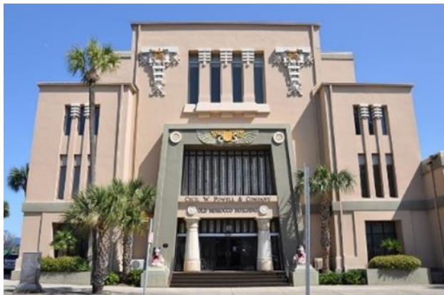
شكل رقم (2) كنيس يهود المغرب - فلوريدا 1911

1-1-3-5 الوظائف المرتبطة بالعقيدة: في المرحلة الأولى تصدرت وظائف العقيدة المرتبة الأولى، بعدد 13 مبنى بنسبة 45%، من خلال خمسة معابد يهودية، وأربع كنائس، ومحفلين ماسونيين، وضريحين. ونفس الأمر في المرحلة الثانية بعدد سبعة مباني بنسبة 32%، من خلال معبد يهودي واحد وستة محافل ماسونية. وبالنسبة للمعابد اليهودية يعتبر كل من كنيس "هوبارت" و"لونسستون" (شكل 1) اللذان شيئا عامي 1845 و1846 بولاية "تسمانيا" في أستراليا من أقدم الحالات القائمة المعتمدة على الأسلوب المصري، وقد قام بتصميمها المعماري "ريتشارد لامبيث"، ولا يزالان يؤديان وظيفتهما حتى الآن [17]. ويعتبر كنيس يهود المغرب (شكل 2) بمدينة "جاسونفيل" بفلوريدا من أقدم الأمثلة الأمريكية، وقد شُيد عام 1911 للمعماري "هنري كلوزو"، وفي عام 1984 تحول إلى مبنى مكاتب [18]. أما الكنائس فأقدم الأمثلة كنيسة "أولد ويلر" (شكل 3) بنيويورك التي شيدت عام 1844، للمعماري "مينارد لافيفر" [19]. وبالنسبة للمحافل الماسونية فمن أوضح الأمثلة محفل مدينة "راسين" (شكل 5) بولاية ويسكونسن الذي شيد عام 1923، ومحفل مدينة "سولت ليك" (شكل 6) الذي شيد عام 1927 بولاية يوتا، ولا يزال المبنى قائم بوظيفتهما للآن [20]. ومن أوضح أمثلة الأضرحة ضريح أسرة "شيلتري" (شكل 4) الذي شيد عام 1889 بمدينة نابولي بإيطاليا للمعماري "ألفونسو جويرا"، وفي عشرينات القرن العشرين قامت بلدية نابولي بتحويله إلى ضريح للزعماء الوطنيين [21].