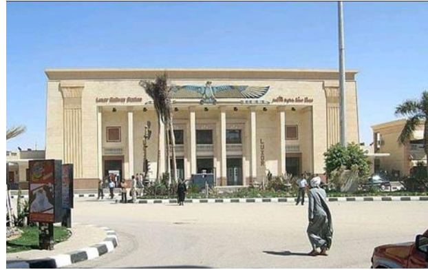
شكل رقم (21) محطة الأقصر 1931