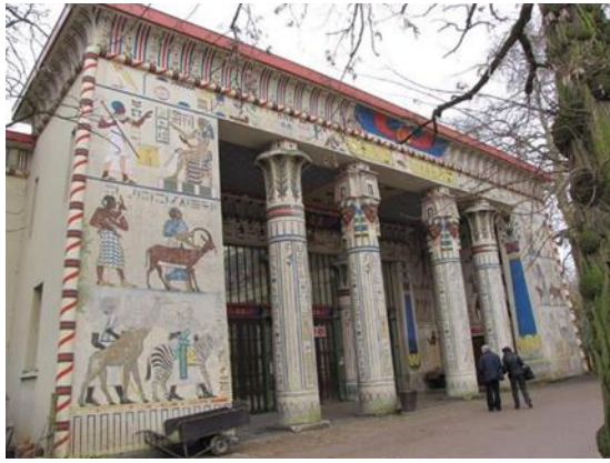
شكل رقم (24) حديقة حيوان أنتويرب 1856