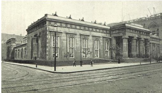
شكل رقم (8) محكمة وسجن مدينة نيويورك 1838

2-1-3-5 المباني الحكومية والتذكارية: ظهرت جميع الحالات في المرحلة الأولى بالولايات المتحدة، حيث شُيّد مبنيين حكوميين هما مركز شرطة "نيو أورليانز" (شكل 7) للمعماري "بنجامين بيسون" عام 1836 [22]، وقاعة العدل أو محكمة مدينة نيويورك الملحق بها سجن (شكل 8) للمعماري "جون هافيلاند" عام 1838، وكلا المبنيين تم هدمهما لاحقاً [23]. كذلك شُيّد مبنى تذكاري واحد في الفترة من 1848 إلى 1884، هو مسلة "واشنطن" الشهيرة للمعماري "روبرت ميلز"، وهي من أشهر المباني مصرية الطابع في الولايات المتحدة، ويبلغ ارتفاعها 169م [24].