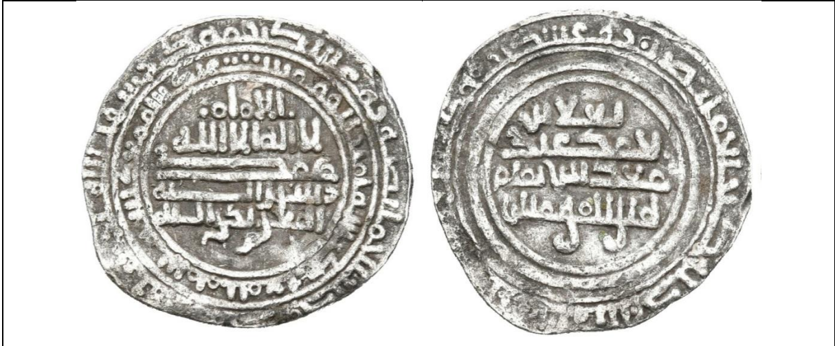
لوحة رقم (١): درهم فضي باسم يعلا بن أحمد، الوزن (١,٥٧ جرام)، القطر (٢٠ ملم) (٤)