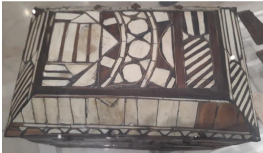
( لوحة رقم ٧): الجزء العلوي للغطاء.