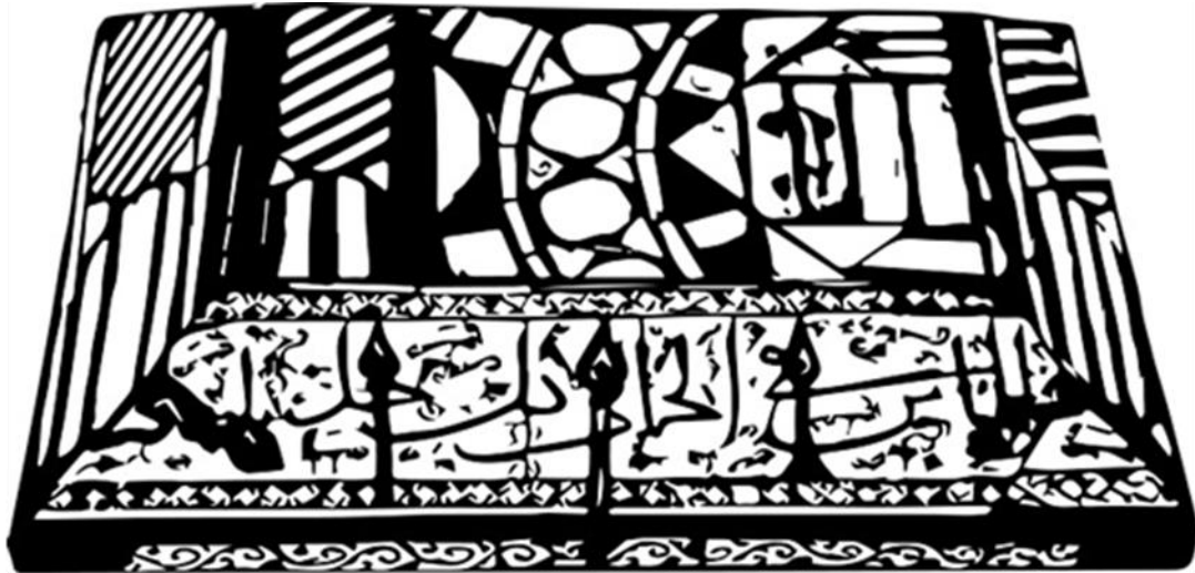
(شكل رقم ٢): رسم توضيحي لغطاء الصندوق (من عمل الباحث).