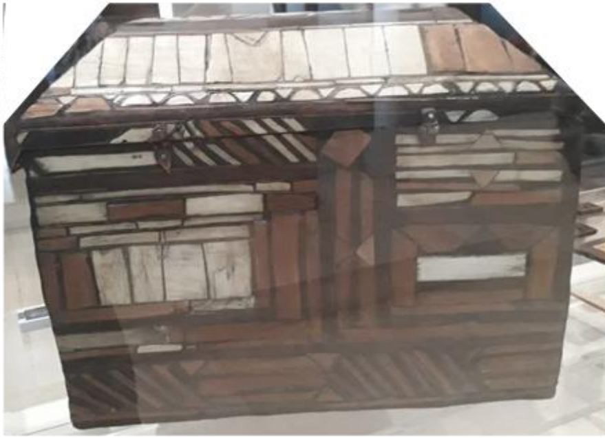
( لوحة رقم ٣): الجانب الخلفي للصندوق.

مجلة العمارة والفنون والعلوم الإنسانية - المجلد الثامن - عدد خاص (٧) المؤتمر الدولي الحادى عشر - التحديات الحضارية في ظل الألفية الثالثة (تراث - تكنولوجيا - تصميم)