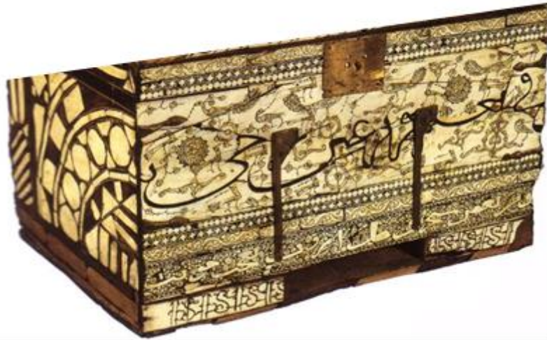
(لوحة رقم ٢): الواجهة الأمامية للصندوق.