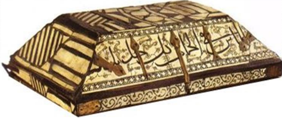
( لوحة رقم ٦): غطاء الصندوق.