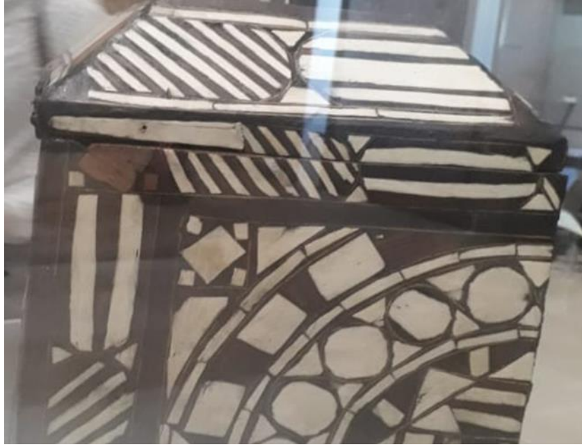
( لوحة رقم ٥): الجانب الأيسر للصندوق.