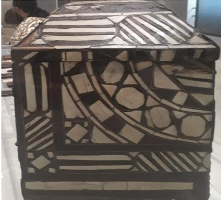
( لوحة رقم ٤): الجانب الأيمن للصندوق.