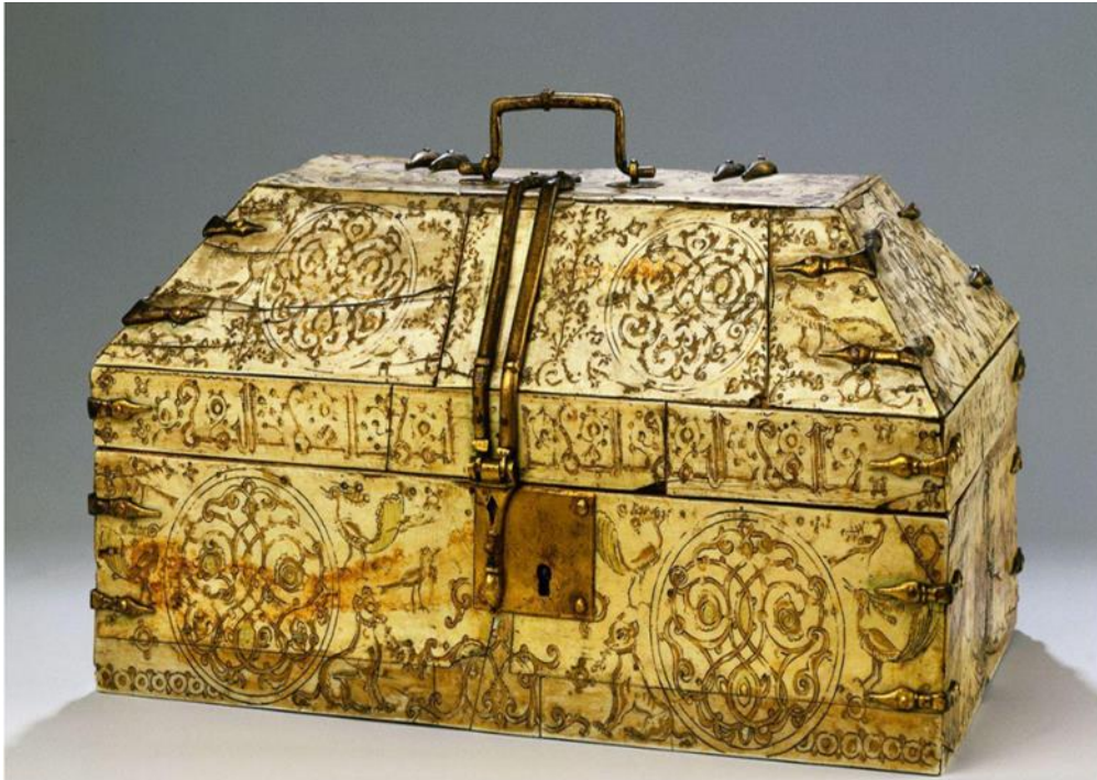
( لوحة رقم ٩): صندوق من الخشب المطعم بالعاج ينسب إلى صقلية، حوالي القرن ١٧هـ / ١٣م، محفوظ بمتحف الفن الإسلامي ببرلين.

http://islamicart.museumwnf.org/database_item.php?id=object;ISL;de;Mus01;13;ar •