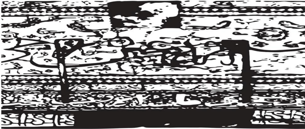
(شكل رقم ١): رسم توضيحي للواجهة الامامية لصدوق الخشبي محفوظ بمتحف الفن الإسلامي ينسب لصقلية حوالي القرن ٧ هـ / ١٣م، عثر عليه بدير الملاك غبريال بالقيوم (من عمل الباحث).