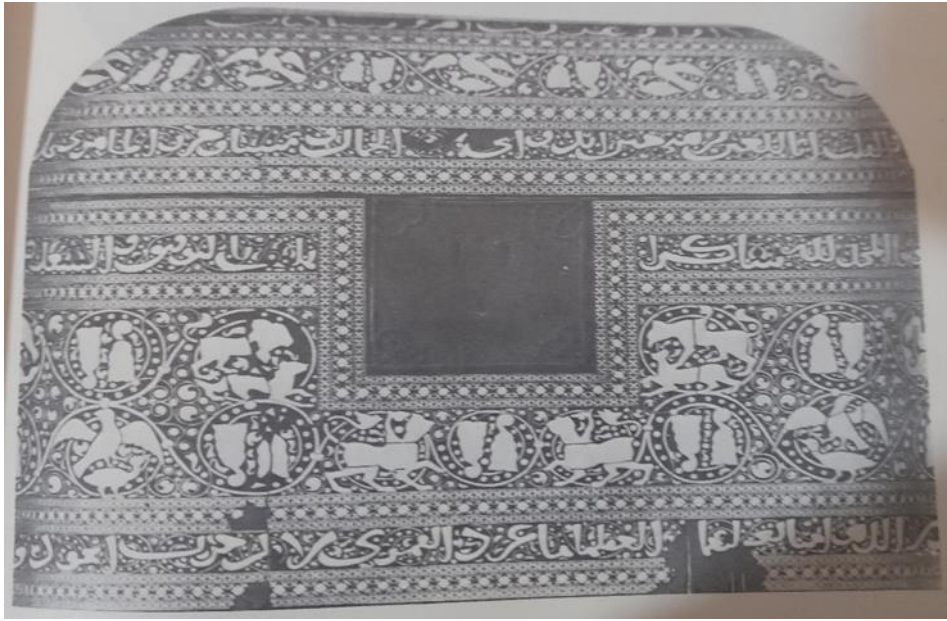
( لوحة رقم ٨): صندوق كبير من الخشب المطعم بالعاج ينسب إلى صقلية حوالي القرن ١٢هـ / ١٢م، محفوظ في مبنى ملحق بالكابلا باللاتينا (نقلا عن: رسلان، عبد المنعم. الحضارة الإسلامية في صقلية. لوحة رقم ١٠٣).