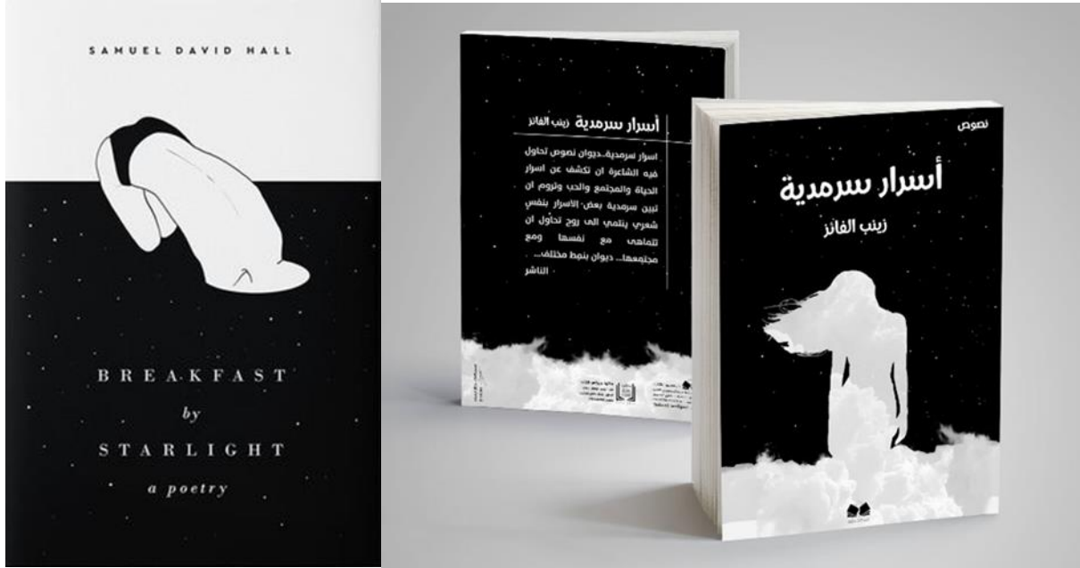
شكل رقم (٤): رسم توضيحي لمعالجات جرافيكية لغللاف الديوان الشعري أبيض وأسود ٢٧

ومن هنا فإن الشعر يعد مثقل بضمون فكري، يمثل حالة نفسية تمتزج بإنفعالات الحياة ويستند إليها بطريقة يصعب نقلها بشكل كامل أو مباشر عن طريق الكلمة لذا تتطلب إنشائية الفكرة في تصميم غلاف ديوان الشعر بشكل خاص: