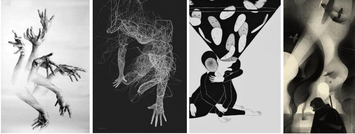
شكل رقم (٢): رسم توضيحي لمعالجات جرافيكية أبيض وأسود

الوقت ذاته يرمز إلى الإكتئاب والموت والشر، وعادة يتصف الأشخاص الذين يجبون اللون الأسود بالإرادة القوية والغموض والاحترام. (شكل رقم ٢)