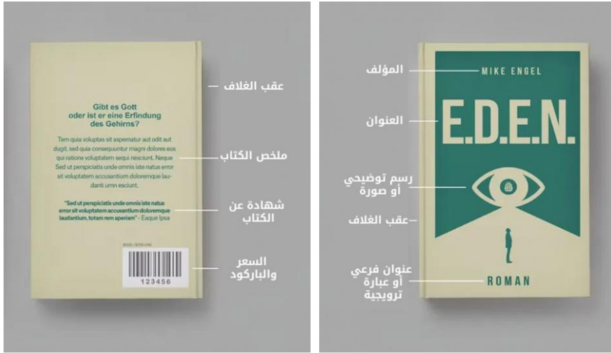
شكل رقم (١): رسم توضيحي لغلاف الكتاب والبيانات التواجدة علي سطحه ١٠

وباختلاف أنواع الكتب تختلف تصاميم الأغلفة لتحقيق العملية الإتصالية، وسيتم تناول غلاف الكتاب الأدبي (ديوان الشعر) على وجه الخصوص لما له من طابع خاص يخاطب الوجدان، حيث يمثل حالة وجدانية تربط بين كلمات الشاعر ورسوم المصمم للغلاف.