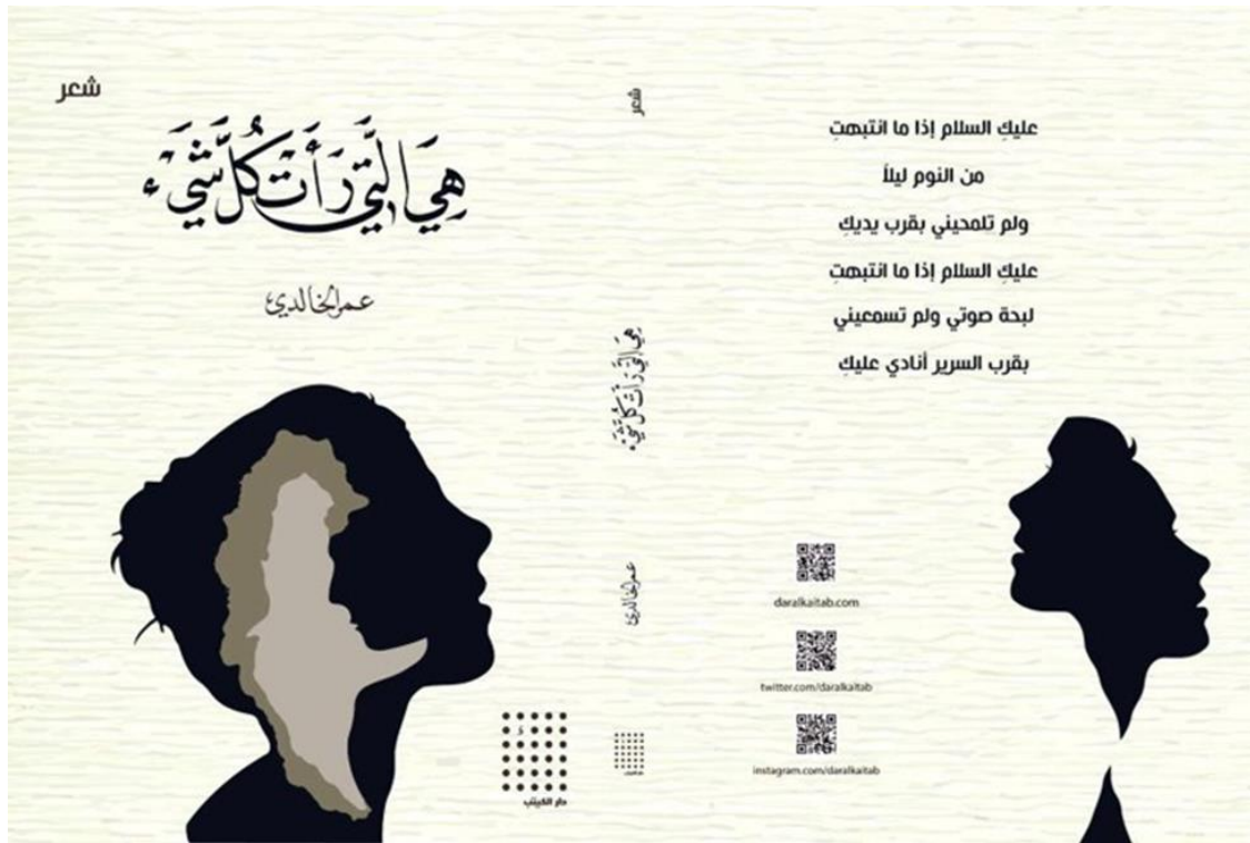
شكل رقم (٥): رسم توضيحي لغلاف كتاب ديوان شعر (هي التي رأت كل شيء) باللون الأبيض والأسود للشاعر: عمر الخالدي ٣١

لتقوم هذه الدراسة بطرح مدخلاً تكون محاوره بمثابة حلول تصميمية لما تضيفه المعالجة الأبيض والأسود من علاقات جمالية سريعة الإدراك للمتلقي مخاطبة لوجدانه معبرة عن مشاعر وخيال. النموذج التحليلي رقم (١): (شكل رقم ٥)