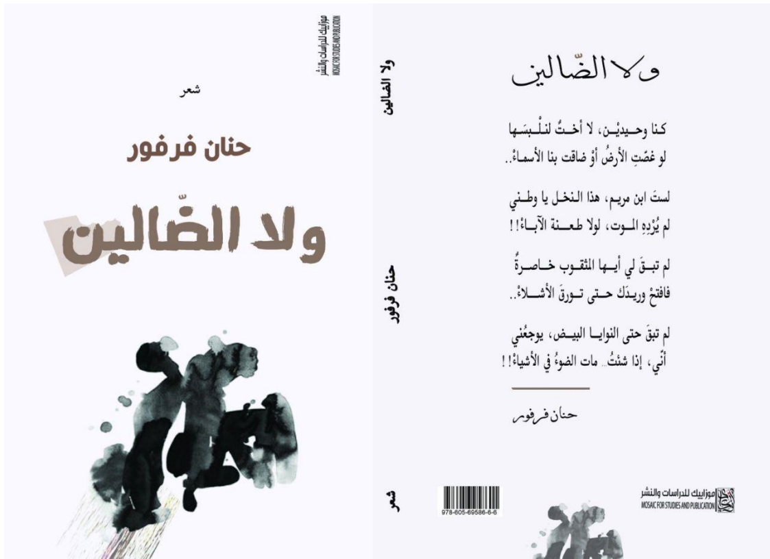
شكل رقم (٦): رسم توضيحي لغلاف كتاب ديوان شعر (ولا الضالين) باللون الأبيض والأسود للشاعر: حنان فرفور ٣٢