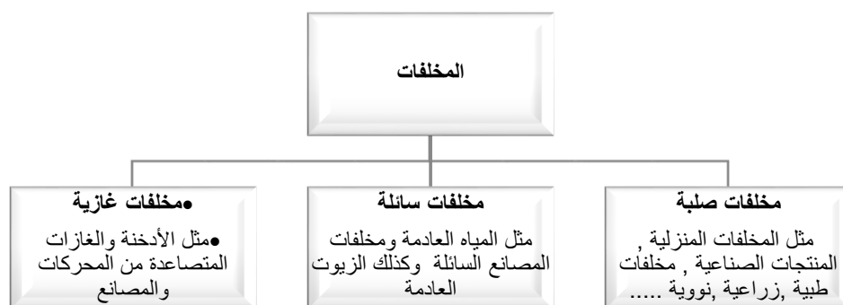
شكل رقم (٢) يوضح التقسيم العام لأنواع المخلفات

قيمة لها، معيبة أو ليس لها استخدام " ليشمل المفهوم الموضوعي لها لأن المخلفات بالنسبة لشخص قد تكون مفيدة لشخص آخر. وللمخلفات أنواع متعددة يمكن تصنيفها إلى ثلاثة أنواع كما هو موضح بالشكل رقم (٢)