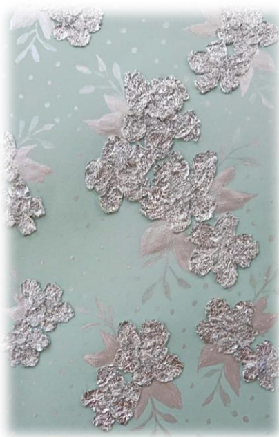
تصميم رقم (٣)