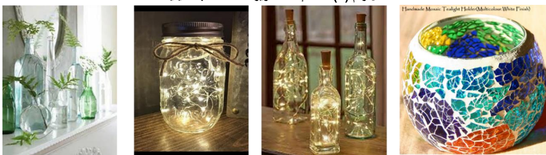
شكل رقم (٤) أمثلة لإعادة تدوير المخلفات الزجاجية