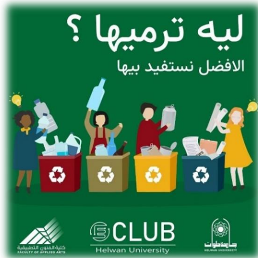
شكل رقم (٨) يوضح بوستر لمعرض خاص بإعادة التدوير و علاقته بريادة الأعمال بكلية الفنون التطبيقية جامعة حلوان

و في ضوء التجربة التصميمية أقيم معرض بالكلية يمثل مبادرة لنشر ثقافة إعادة التدوير بإسم " ليه ترميها - الأفضل نستفيد بيها " كما هو موضح في الإعلان المصاحب للمعرض شكل رقم (٨)