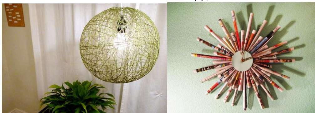
شكل رقم (٥) أمثلة لإعادة تدوير المخلفات الورقية