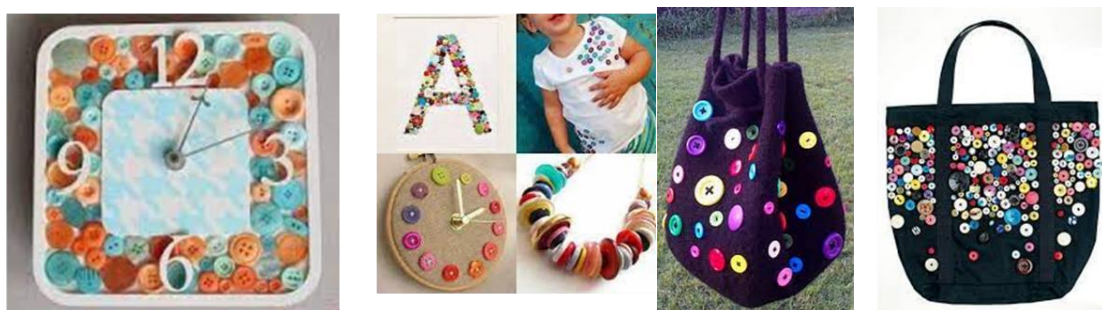
شكل رقم (6) أمثلة لإعادة تدوير مخلفات أدوات الحياكة "الازرار"