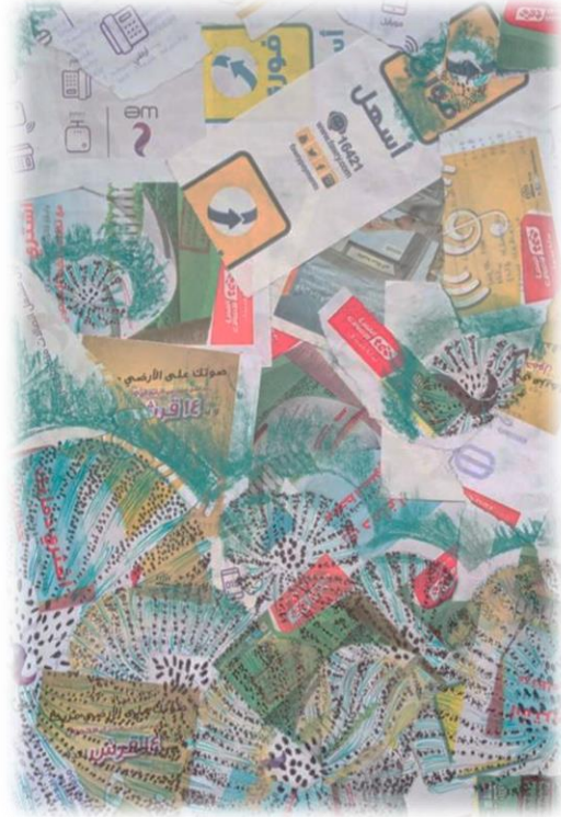
تصميم رقم (٩)

و في ضوء التجربة التصميمية أقيم معرض بالكلية يمثل مبادرة لنشر ثقافة إعادة التدوير بإسم " ليه ترميها - الأفضل نستفيد بيها " كما هو موضح في الإعلان المصاحب للمعرض شكل رقم (٨)