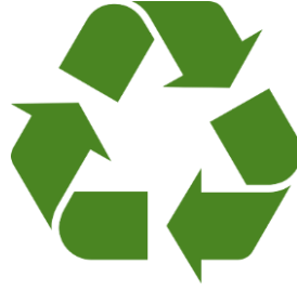
شكل رقم (١) يوضح شعار " العلامة الدولية " إعادة التدوير ( https://en.wikipedia.org/wiki/Recycling )2015

و تعرف إعادة التدوير بأنها عملية اعادة تصنيع واستخدام مخلفات المنتجات , أي استخدام المنتج لأكثر من مرة واحده واسترجاع المواد الغير مرغوبة والمهملة علي شكل مخلفات مثل الورق و المطاط والزجاج والاستفادة منها مباشرة أو استخدامها كمواد خام في انتاج مواد جديده ذات فائدة اقتصادية وبيئية , بينما تعرف القمامة "المهملات" : على انها خليط متباين الاجزاء تختلف من مدينة الى اخرى، ومن شارع الى اخر، ومن منزل الى منزل اخر باختلاف الشعوب والسكان ومستوى معيشتهم، ويختلف مقدار القمامة عن كل مواطن حسب دخله، وعلى السلوك الاجتماعي والعادات الخاصة به، وعن طريق اعادة تدوير هذه المخلفات وتوظيفها على مجموعة من التطبيقات العملية تم تنفيذها بشكل تفصيلي من قبل تصميمات يدوية لطلاب الفرقة الأولى بمادة نظم تصميم بكلية الفنون التطبيقية جامعة حلوان حيث وفرت المواد الخام للطلاب و أضفت حسا وجمالا الى التصميمات ، كما انها تساعد على تقليل الفضلات الى ادنى حد ممكن، وتعزيز التنظيف في مجال النظافة الشخصية والتنظيف الصحي.