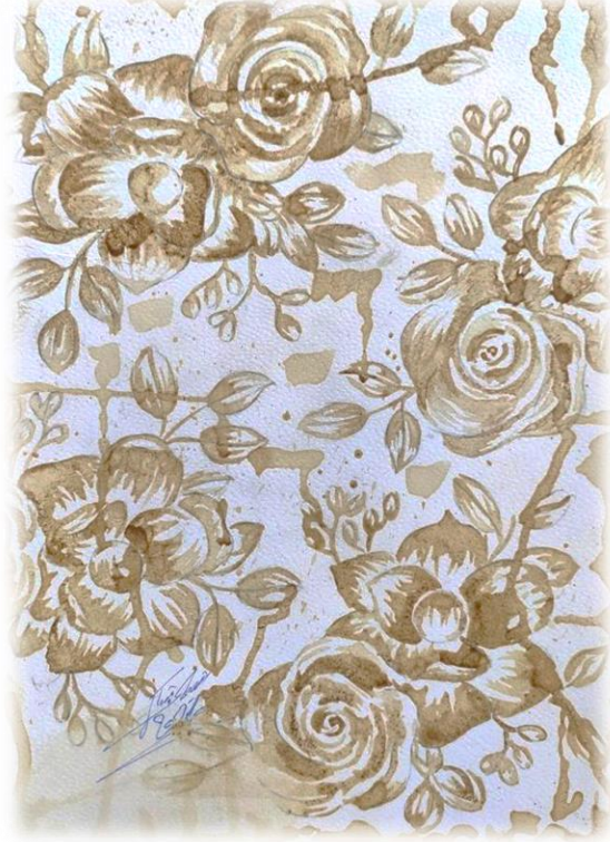
تصميم رقم (١)

تصميم رقم (٢) : إعتد تكوين هذا التصميم علي المزج بين قصاصات الأوراق , الدانتيل , بقايا الأقمشة , ورق المجلات , في تداخل يماثل فن الكولاج مع إضافة العنصر النباتي للزهرة و استخدام البصمات المختلفة للدمج بين الوحدات و بعضها. يظهر الإنسجام اللوني في إستخدام مجموعة لونية متوافقة , و يتسم التصميم بالحدائثة ليناسب ملابس الكاجوال كما هو موضح في التوظيف المقترح