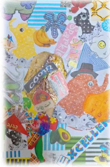
تصميم رقم (٤)

تصميم رقم (٥) : قوام هذا التصميم إعادة إستخدام مخلفات الكرتون و تفرغها من بعض المناطق و من ثم إستخدام الألوان و عمل تصميم مكون من الزهور و يتضح أسلوب التهشير و التنقيط لإبراز الشكل , بينما ظهرت الخطوط الأفقية للكرتون في التصميم بشكل شرائط مستقيمة تكرر بشكل إيقاعي للربط بين العناصر و لتحديث تنغيماً واضحاً وخلق حركة في التصميم , و قد أستخدمت درجات البني و البيج للكرتون و الالوان المحايدة مما يوحي بالهدوء و الإنسجام و يتناسب مع طبيعة التوظيف المقترح