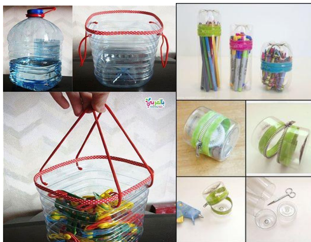
شكل رقم (٣) أمثلة لإعادة تدوير المخلفات البلاستيكية