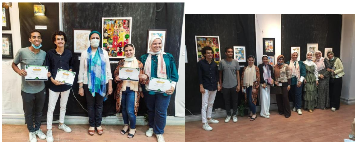
شكل رقم (٩) يمثل بعض الصور الفعلية للمعرض