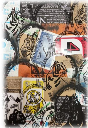
تصميم رقم (٧)