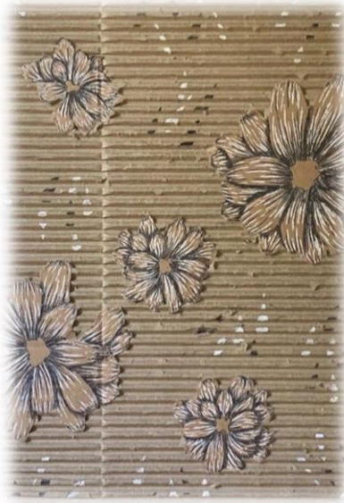
تصميم رقم (٥)