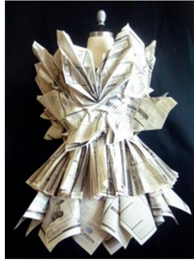
شكل رقم (7) أمثلة لأزياء منمفة بإعادة تدوير المخلفات

الاستراتيجية التصميمية : الاستراتيجية التصميمية هي طريقة أو خطة مجملية منظمة يتم استخدامها بمرونة، من أجل تنظيم المحتوى وتحقيق التفاعل وتوجيه المتلقي، وتساعد المتلقي على إدراك أشكال المعرفة والمعلومات وتتكون من مجموعة محددة من الأنشطة و الإجراءات المرتبة من أجل تحقيق بعض الأهداف المحددة في فترة زمنية محددة . و إعادة التدوير كاستراتيجية تصميمية لها تأثير كبير في إبراز التصميم بأسلوب مختلف يجذب انتباه المتلقي ويثير اهتمامه , كما أنه أضاف لطلاب الفرقة الأولى جوا من المتعة والترفيه أثناء الدراسة و التصميم .