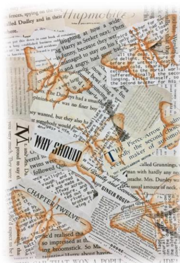
تصميم رقم (٦)

تصميم رقم (٧) : تناول التصميم إعادة تدوير و استخدام مخلفات الألعاب الورقية " الكوتشينة , ONO " , قصاصات أوراق المجلات حيث الكتابات المتنوعة في الحجم و اللون , و توزيع وحدات من النور و العناصر الحيوانية داخل اطارات هندسية دائرية متنوعة في الحجم و المسافة , وبذلك أشتمل التصميم على طاقات حركية كامنة ، ناشئة من الخطوط المنحنية للدوائر وأشكال العناصر الثابتة في الإتجاه، مما يثير إحساساً بالحيوية والحركة. هذا فضلاً عن الإيقاع الناشئ من القصاصات ذات المساحات المترابكة بأوضاع وأحجام متفاوتة، والموجودة في خلفية التصميم بمعالجات لونية وإضاءات متنوعة، والتي ساعدت على خلق نوع من الوحدة والترابط بين الشكل والأرضية , الإستعانة بالقيم الموجية والسالبة للأبيض والأسود لتحقيق التباين اللوني بصورة واضحة تعكس الإحساس بالوضوح .