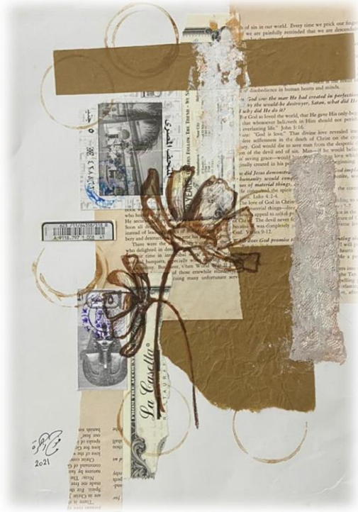
تصميم رقم (٢)