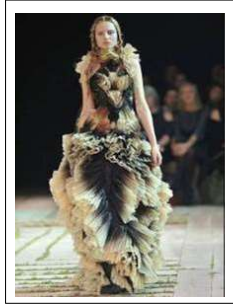
الدمج بين التصميم البناني من خلال التشكيل "بالكسرات و التصميم المصبوغ Mcqueen2010(10)"

الجانب التطبيقي : أفكار مبتكرة توضح معالجة سطح الخامة من أعمال الطلاب