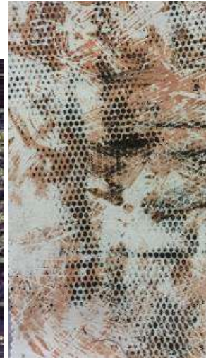
تجارب تشكيل سطح الخامة مستخدما أساليب الطباعة بتقنيات بالمونوبرنت و الطباعة بالفويل