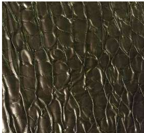
تجارب تشكيل سطح الخامة مستخدما أساليب التكسير للخامة ( الكشكشة ، البليسية ) علي خامات مطبوعة بأسلوب الديجيتال