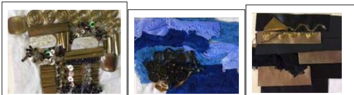
تجارب تشكيل سطح الخامة منقذة باستخدام خامات مختلفة كالنحاس و الخرز و الجلد وخامات متنوعة من الأقمشة