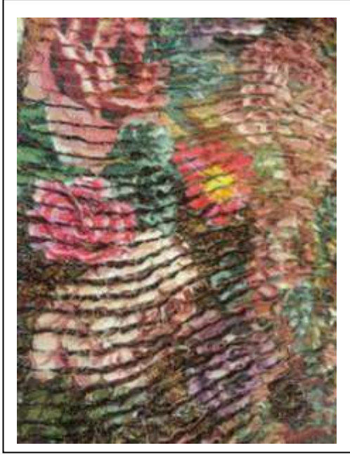
تصميم يعتمد علي الدمج أسلوب الكسرات و Galtier 2016(10)الخامة المطبوعة