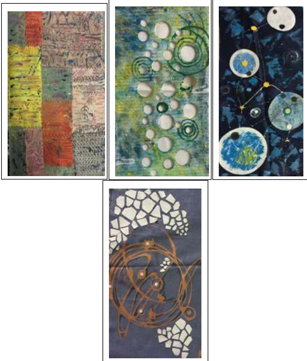
تجارب تشكيل سطح الخامة منقذة باستخدام اسلوب الكولاج و القص بالليزر واساليب الطباعة "المونويرنت" و الشابلونة