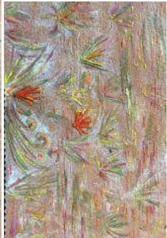
تجارب تشكيل سطح الخامة مستخدما أساليب الطباعة بتقنيات الطباعة بالمونوبرنت و التطريز