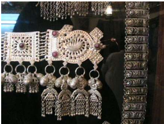
شكل (8) قطع من الحلي النسائية حزام للخصر (تصوير الباحثة معرض شخصي لأحد المهتمين بالمنطقة)