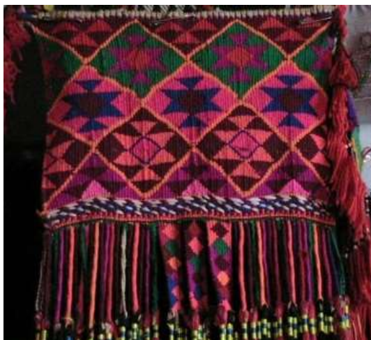
شكل (2) قطعة من السدو تابعة لمنطقة أبها