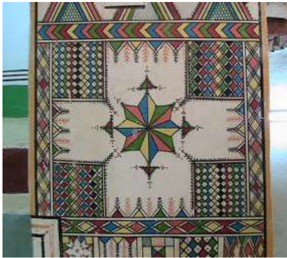
شكل (6) جدار مزين بالوحدات الزخرفية (القط العسيري)