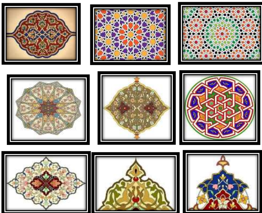
الشكل رقم "13" بعض الوحدات من الفن الإسلامي والتي تم الاستفادة منها في تطبيق المزج بين الوحدات