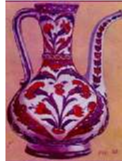
الشكل رقم "11" أمثلة لزخارف نباتية