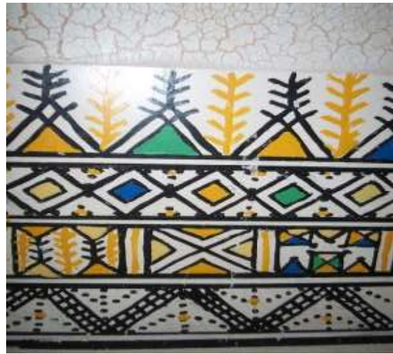
شكل (5) جدار عسيري مزين بالوحدات الزخرفية (القط العسيري) (تصوير الباحثة متحف رجال ألمع في جنوب المملكة)