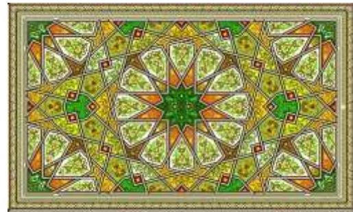
الشكل رقم "10" أمثلة لزخارف هندسية