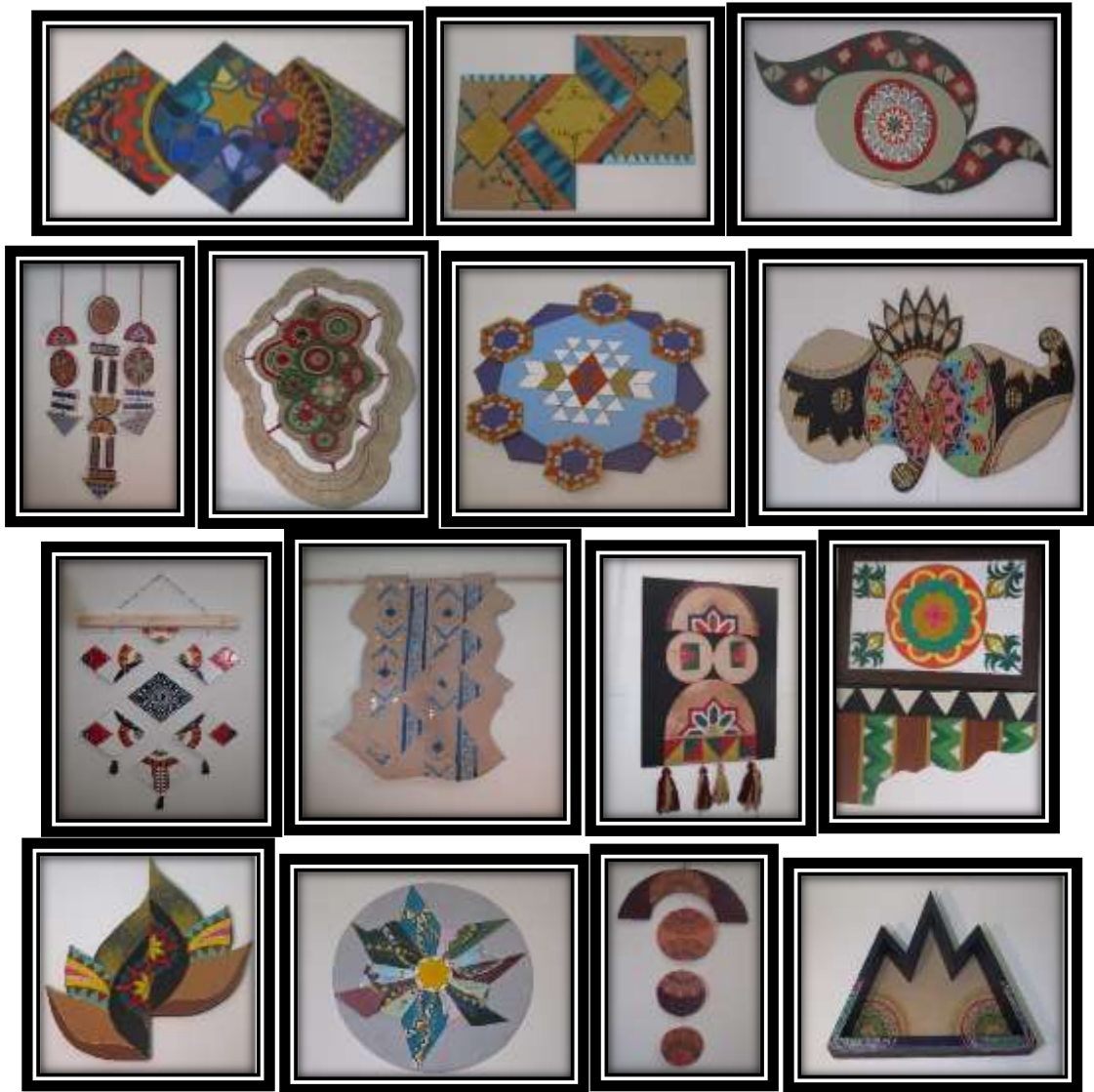
الشكل رقم "14" نماذج من تنفيذ الطالبات