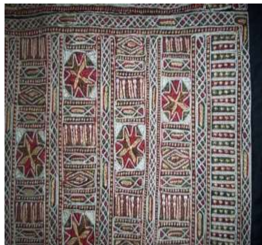
شكل (1) قطعة من الزي النسائي مزينة بالكامل بوحدات شعبية ومطرزة بالخيوط وحبات الخرز (تصوير الباحثة متحف رجال ألمع في جنوب المملكة)