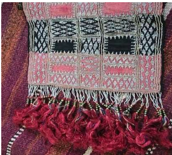
شكل (4) قطعة مزينة بحبات الرصاص لغطاء الشعر النسائي لقبائل مدينة الطائف