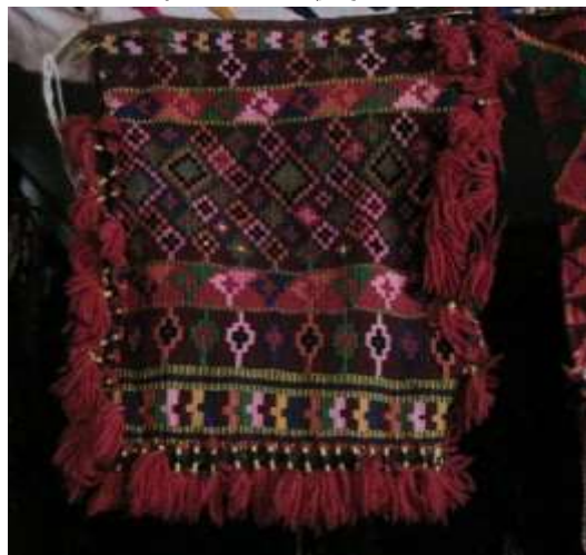
شكل (3) قصعة من نسيج السدو تابعة لخميس مشيط بمحافظة أبها (تصوير الباحثة معرض شخصي لأحد المهتمين بالمنطقة)