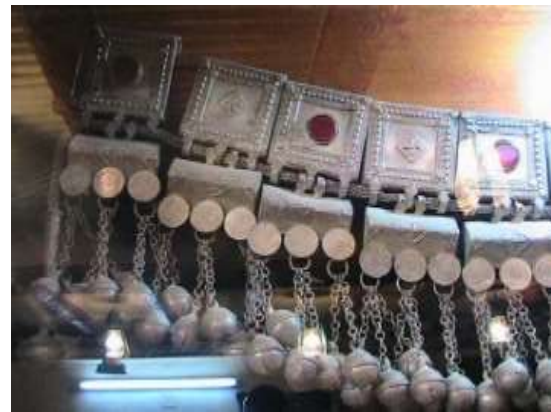
شكل (7) قطع من الحلي النسائية حزام للخصر (تصوير الباحثة معرض شخصي لأحد المهتمين بالمنطقة)