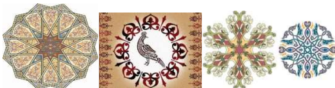
الشكل رقم "9" يوضح اشكال لوحات زخرفية اسلامية. المصدر

Significant Form وهو ما نجده في الوحدة الزخرفية (9).