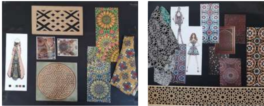
شكل (3،4) لوحة الصيغه رقم (3،4) التراث الاسلامي كمبعث لتصميم طباعة المنسوجات