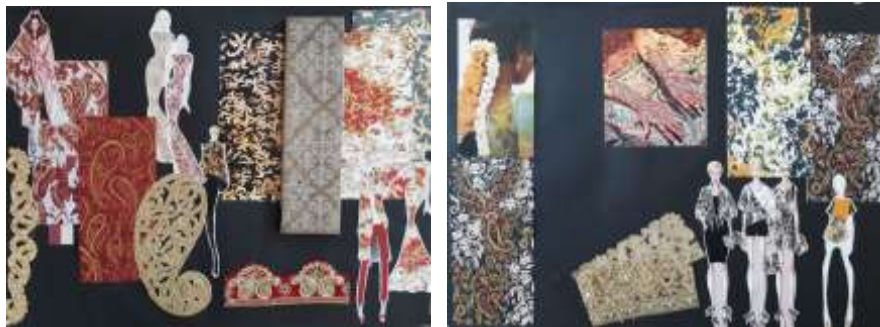
شكل (10,9) لوحة الصيغه رقم (10,9) تراث الفن الهندي كمبعث لتصميم طباعة المنسوجات