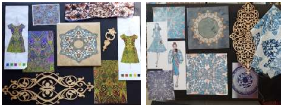
شكل (1،2) لوحة الصيغة رقم (2،1) التراث الاسلامي كمبعث لتصميم طباعة المنسوجات