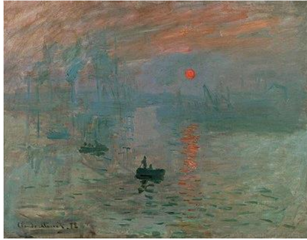
شكل ٨ الانطباع، الشروق Impression, Sunrise، كلود مونييه Claude Monet، متحف مارموتان مونييه، باريس ١٨٧٢

الصباح الضبابي وانعكاس الشمس على الماء. التكوين ويضم ميناءً هادئاً به عدة قوارب صغيرة ومركب أكبر في الخلفية و ينصب التركيز الرئيسي في اللوحة على شروق الشمس. يتم وضع خط الأفق عالياً جداً في التكوين، تاركاً جزءاً كبيراً من القماش مخصصاً للماء والسماء. يخلق هذا الموضع إحساساً بالتمدد ويسمح للمشاهد بالتركيز على تشغيل الضوء واللون في هذه العناصر. أما عناصر قطرية: يتضمن التكوين عدة عناصر قطرية، مثل صف القوارب والانعكاسات في الماء. تخلق هذه الأقطار طاقة ديناميكية وتوجه عين المشاهد عبر المشهد. يساهمون في الحركة الشاملة وإيقاع اللوحة. موازنة العناصر: في حين أن هناك إحساساً بعدم التناسق في التكوين، لا يزال مونييه يحقق توازناً بصرياً. يتم موازنة القوارب الأكبر حجماً على الجانب الأيمن بالقوارب الأصغر الموجودة على اليسار. يساعد وضع الشمس وانعكاسها أيضاً على خلق شعور بالتوازن داخل التكوين.