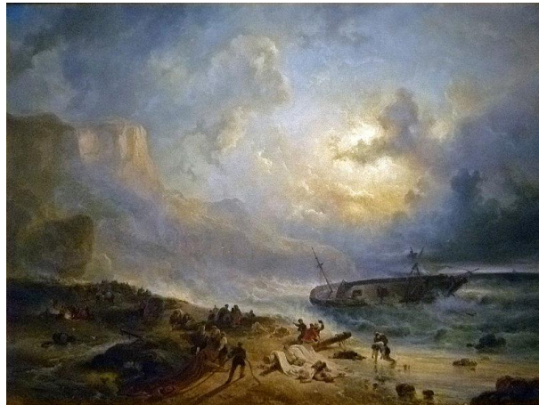
شكل ٦ حطام محطم قبالة ساحل صخري off a Rocky Coast hipwreck و اجاند نيوجين Nuijen Wijnand، متحف ريجكس، أمستردام ١٨٣٧

اما في عمل حطام محطم قبالة ساحل صخري off a Rocky Coast hipwreck لواجاند نيوجين, Nuijen Wijnand عام ١٨٧٣ (شكل ٦) نجد ان الحطام كبيرًا بما يكفي ليكون "بقايا" مركب. اعتمادًا على المكان الذي تحطمت فيه المركب وشدة التأثير، قد يكون هناك عدد من الناجين. يمكن أن يكون هذا مرتبطًا بقصة الإنقاذ الفرنسي. التصميم متوازن بلجذب انتباه المشاهد إلى حطام السفينة المركزي. قد يتم وضع السفينة نفسها بعيدًا عن المركز، مما يخلق إحساسًا بالحركة وعدم الاستقرار اما السواحل الصخرية والأمواج المتلاطمة و التناقضات بين الضوء والظل للتأكيد على الحطام والطبيعة المضطربة للمشهد.