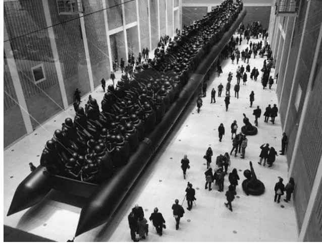
شكل ١٤ قانون الرحلة Law of the Journey، اي ويوي Ai Weiwei، المعرض الوطني في براغ ٢٠١٧

العمل عبارة عن تجهيز في الفراغ حيث استخدم الفنان قاربًا قابلاً للنفخ بطول ٢٣٠ قدمًا مليئًا بأكثر من ٣٠٠ شخصية لاجئين كبيرة الحجم مصنوعة من المطاط والبلاستيك. يهدف العمل إلى زيادة الوعي بأزمة اللاجئين العالمية ومحنة النازحين. فالقارب رمز قوي للهجرة والرحلات المحفوفة بالمخاطر التي يقوم بها اللاجئون بحثًا عن الأمان وحياة أفضل. استخدام الحجم الكبير اعطى احساس بالهيبة للعمل مع علاقته بحجم اللاجئين خلق الاحساس بالديناميكية اما اللون الاسود فربط العناصر ببعض.١٣