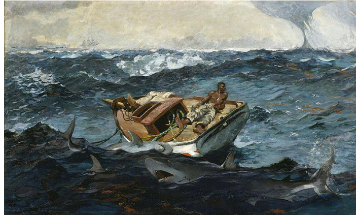
شكل ٧ وينسلو هومر Winslow Homer تيار الخليج The Gulf Stream, ١٨٩٩, متحف متروبوليتان للفنون

ففي عمل "تيار الخليج" لوينسلو هومر (شكل ٧) ، يصور هوميروس شخصًا وحيدًا تقطعت به السبل على متن قارب صغير في وسط بحر عاصف. ضربت الأمواج العاتية المركب، مما يرمز إلى ضعف وعزلة الفرد في مواجهة قوى الطبيعة. تعكس اللوحة المناظر البحرية المتغيرة والتحديات التي يواجهها البحارة في عصر التصنيع وتقدم التكنولوجيا. التصميم أكد على الشعور بالتوتر والضعف فمركز العمل رجل أسود وحيد يهرب في قارب صغير وسط أمواج مضطربة. يبدو القارب صغيرًا وهشًا مقارنة بالامتداد الشاسع للمحيط، مما يؤكد عزلة الرجل وحجم الخطر الذي يواجهه. أما الألوان و تناقضها يؤكد على الشعور بهول الموقف و استخدام اللون الابيض يجذب العين له.