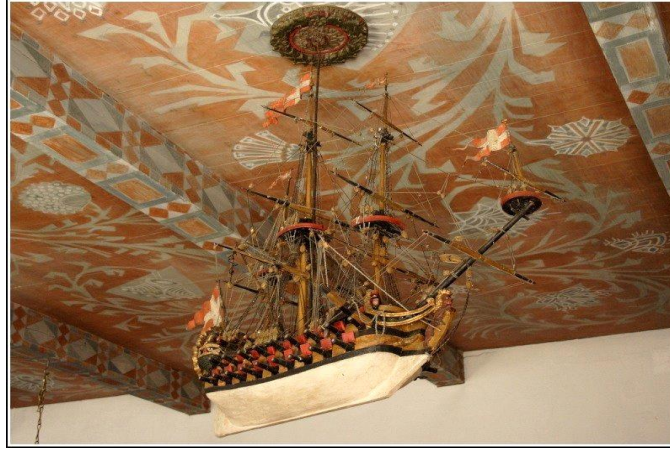
شكل ٥ مركب ندرية هولندية في الكنيسة الهولندية of Alkmaar Laurenskerk-Grote of Sint، القرن السابع عشر والثامن عشر.