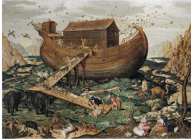
شكل ٣ سيمون دي مايل، Myle Simon de مركب نوح على جبل أرارات Noah's Ark on the Mount Ararat, ١٥٧٠

تُصوّر اللوحة التابوت الجاثم على جبل أرارات، حيث استقر بعد الطوفان طبقا للرواية المسيحية، والحيوانات التي تركت الفلك في وسط اللوحة تنزل الحيوانات على المنحدر بشكل مثالي النظام، مثل الخنازير والخيول والنعام والأبقار والأغنام. تنتشر الحيوانات أيضًا حول الفلك، على سبيل المثال الفيلة والجمال والأسد (يلتهم حصانًا) كل هذا مع البشر في عالم جديد.