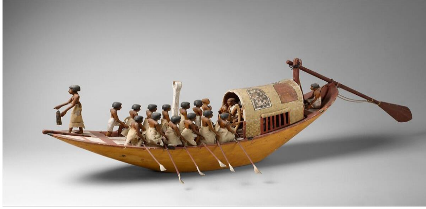
شكل ٢: زورق متنقل يجري التجديف، الأسرة ١٢، الاسرة المتوسطة، التاريخ ١٩٧٥- قبل الميلاد

استمرت المركب في لعب دور مهم في الفن خلال فترتي القرون الوسطى وعصر النهضة. غالبًا ما تم استخدام شكل المركب كرمز للخلاص والحماية، لا سيما في الفن المسيحي، حيث كان يُنظر إلى المركب على أنها تمثيل لمركب نوح. غالبًا ما كانت تُصوّر مركب نوح على أنها مركب كبيرة تحمل الحيوانات والناس إلى بر الأمان أثناء الفيضان التوراتي. تم استخدام هذه الصورة كرمز للخلاص والحماية والتأكيد على أهمية الإيمان والطاعة لأوامر الله. كان يُنظر إلى التابوت على أنه إناء يحمل المؤمنين إلى عالم جديد مطهر يرمز إلى الرحلة الروحية نحو الفداء.