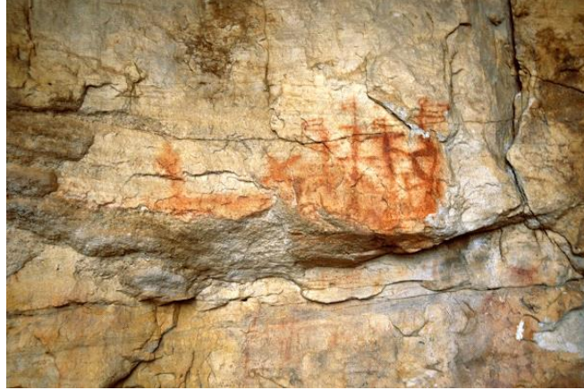
شكل ١ "بورترفيل جالون" "Porterville Galleon"، فنان مجهول، جنوب غرب كيب بجنوب إفريقيا، ١٧٥٠-١٧٥٠ المصدر: https://africanrockart.britishmuseum.org/thematic/contact-rock-art-south-africa/

تكوين العمل الفني ديناميكي. يخلق الجالون المعلق إحساساً بانعدام الوزن ويقترح لحظة متجمدة في الوقت المناسب. إن موقعها في إطار شفاف يعزز الشعور بالضعف والهشاشة، كما لو كانت المركب معلقة في حالة من عدم اليقين الدائم. فالعمل استعارة للطبيعة غير المستقرة للمساعي البشرية والطبيعة سريعة الزوال للإنجازات. إنه يقترح التوازن الدقيق بين التقدم والضعف، مع التركيز على الطبيعة المؤقتة للإنجازات البشرية وعدم اليقين المستمر في المستقبل.