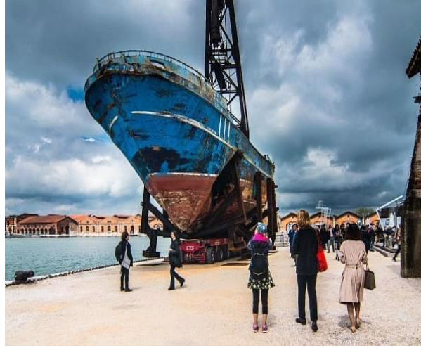
شكل ١٢ كريستوف بوشيل Christoph Büchel مركب برشلونة "The Barca Nostra"، بينالي فينيسيا ٢٠١٥

كما نجد في حطام مركب برشلونة "The Barca Nostra" كريستوف بوشيل "Christoph Büchel" (شكل ١٢) تجهيز حطام المركب التي تمثل حادث الغرق المأساوي الذي راح ضحيته ٨٠٠ شخصا من المهاجرين من جنسيات مختلفة. اقلعت المركب من طرابلس عام ٢٠١٥ وتم انتشائها قبالة الشواطئ الإيطالية و تحولت الى مشروع للفنان " كريستوف بوشيل وسوف تظل معروضة طوال فترة البينالي ثم يتم تحويلها الى نصب تذكاري دائم تخليدا لهؤلاء الضحايا الذين لقوا حتفهم في عرض البحر. استخدام حطام سفينة بهذا الحجم اكد على واقعية الحدث و بشاعة الحادث و استخدام اللون الازرق اضى واقعية للعمل و اعطى احساس بالحزن.