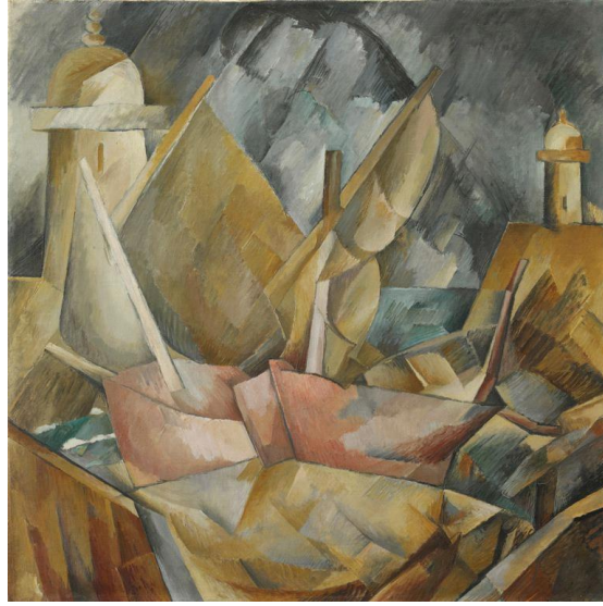
شكل ٩ جورج براغ Normandie en Port , الميناء الصغير في نورماندي , معهد شيكاغو للفنون , ١٩٠٩

الوان العمل متجانسة، تهيمن عليها درجات الألوان الترابية والأزرق الناعم، لإثارة الشعور بالهدوء والبيئة الساحلية. يتميز التكوين بأشكال مبسطة ومجزأة هندسيًا، مما يعكس تأثير الجماليات التكعيبية. تنقسم أشكال القوارب والمباني والمناظر الطبيعية المحيطة إلى جوانب وطائرات متداخلة ومتشابكة مع بعضها البعض.