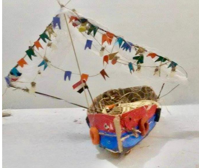
شكل ١٧ نموذج من الماكيت للتصور المبدئي للعمل

عمل فن الصوت والفيديو على تعزيز التجربة الغامرة، واستكشاف الجوانب السمعية والبصرية للعمل الفني. يتعمق التحليل في اختيار المشهد الصوتي وتجاوز العناصر المرئية، لاستجابة عاطفية متزايدة وتعميق تفاعل المشاهدين مع الموضوع. العمل مليء بالتفاصيل معقدة، مثل الألواح الخشبية، والمسامير الصدئة، والطلاء المتكسر. دمجت العيوب بدقة لنقل الإحساس بالبلى، مما يرمز إلى الخسائر المادية التي تتحملها المراكب والأفراد الذين سافروا عليها ودمج أشياء يومية مثل دمىة للاطفال و رسالة من طفلة لأم مما يوفر لمحات من التجارب التي تمت مواجهتها خلال هذه الرحلات الخطرة.