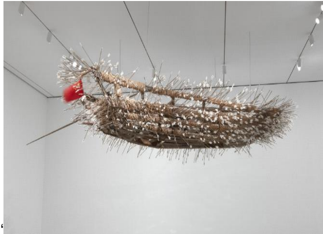
شكل ١١ استعارة سهام عدوك Borrowing Your Enemy's Arrows لتساي قوه تشيانغ Qiang Cai Guo ١٩٩٨، متحف الفن المعاصر، نيويورك

العمل معلق في الهواء لخلق تجربة تفاعلية مع المشاهدين و علاقة اللون المركب بألوان بالاسهم أكد على مضمون العمل الفني اما العلم الاحمر بنسبته البسيطة جذب المشاهدين للعمل. ١١