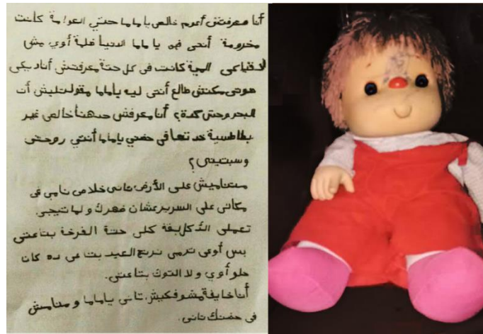
شكل ١٨ جزء من العناصر المستخدمة في العمل

عمل فن الصوت والفيديو على تعزيز التجربة الغامرة، واستكشاف الجوانب السمعية والبصرية للعمل الفني. يتعمق التحليل في اختيار المشهد الصوتي وتجاوز العناصر المرئية، لاستجابة عاطفية متزايدة وتعميق تفاعل المشاهدين مع الموضوع. العمل مليء بالتفاصيل معقدة، مثل الألواح الخشبية، والمسامير الصدئة، والطلاء المتكسر. دمجت العيوب بدقة لنقل الإحساس بالبلى، مما يرمز إلى الخسائر المادية التي تتحملها المراكب والأفراد الذين سافروا عليها ودمج أشياء يومية مثل دمىة للاطفال و رسالة من طفلة لأم مما يوفر لمحات من التجارب التي تمت مواجهتها خلال هذه الرحلات الخطرة.