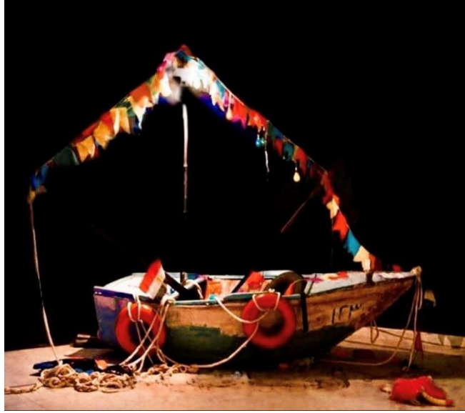
شكل ١٩ التجهيز النهائي للعمل

اما الاضاءة ركزت على شعور المهاجرون أثناء رحلاتهم بتقنيات إضاءة مختلفة لتحقيق التأثير المطلوب. شجع العمل على التفكير في القصص الإنسانية المضمنة في العمل الفني وتعزيز فهم أعمق للواقع الذي يواجهه المهاجرون.