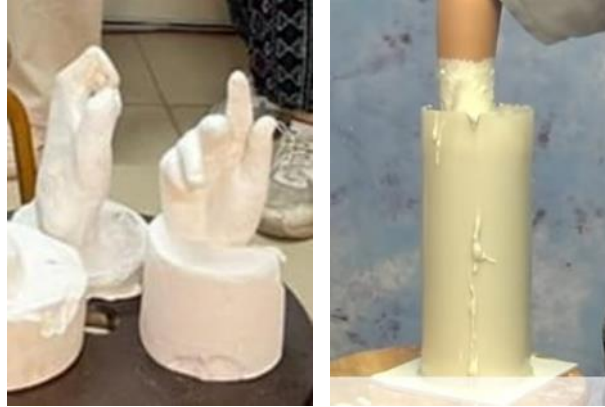
شكل (١٠) المرحلة الأولى - استخدام الألجينات لتنفيذ نموذج

مجلة العمارة والفنون والعلوم الإنسانية - المجلد التاسع - عدد خاص (١١) المؤتمر الدولي الرابع عشر - "التراث الحضاري بين التنظير والممارسة" ٥- يتم تجهيز خليط من الأسمنت الأبيض وصبه داخل قالب الألجينات. ٦- بعد تمام جفافه يتم إزالة الألجينات من حوله وتنظيف النموذج برفق.