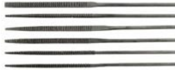
شكل (٢) المبارد