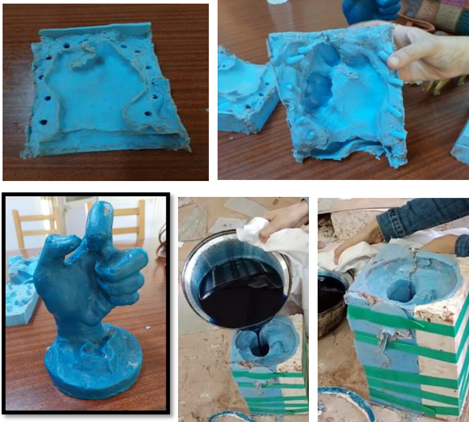
شكل (١١) المرحلة الثانية - تنفيذ قالب سيليكون ربر وصب الشمع داخله

يتم عمل قالب سيليكون ربر من من جزء أو جزئين بنفس مراحل التنفيذ التي تمت في التطبيق الأول ثم يصب الشمع بداخله بعد تمام الجفاف، ويتم إخراجها من القالب واستخدامه في مرحلة إنتاج منتج نحتي مصمت بطريقه الشمع المفقود.