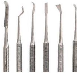
شكل (٣) الملاوق