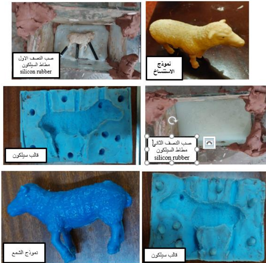
شكل (٧) مراحل استساح نموذج جاهز باستخدام مطاط السيلكون silicon rubber