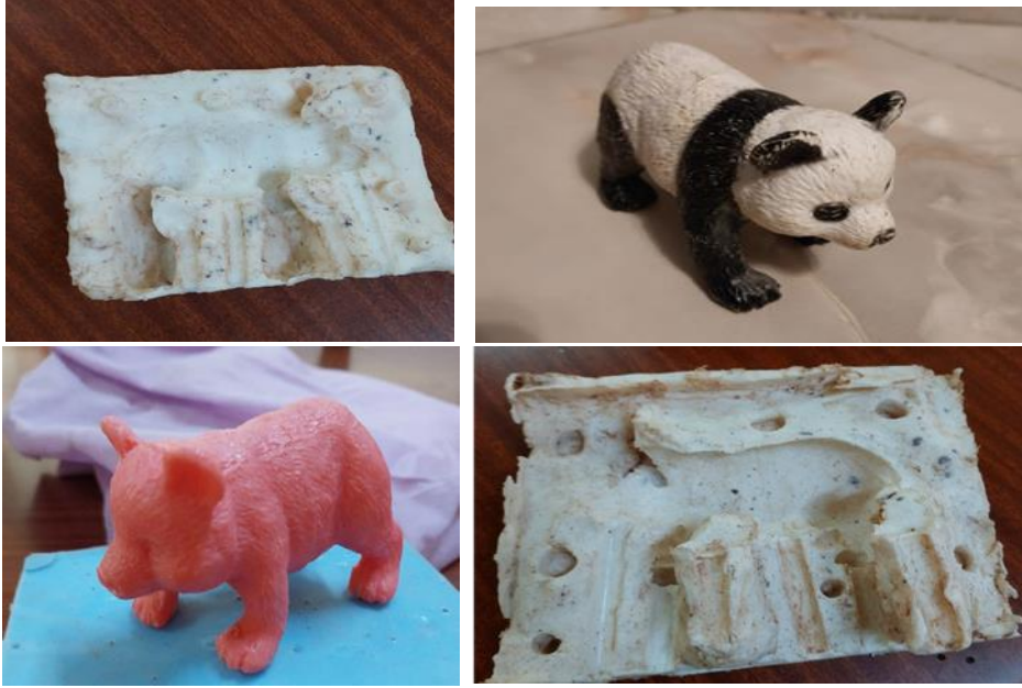
شكل (٨) مراحل استنساخ نموذج جاهز رقم ٢ باستخدام مطاط السيلكون silicon rubber