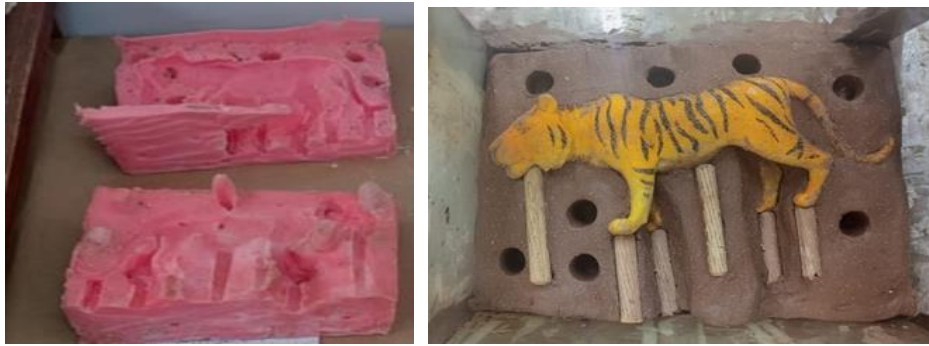
شكل (٩) مراحل استنساخ نموذج جاهز رقم ٣ باستخدام مطاط السيلكون silicon rubber