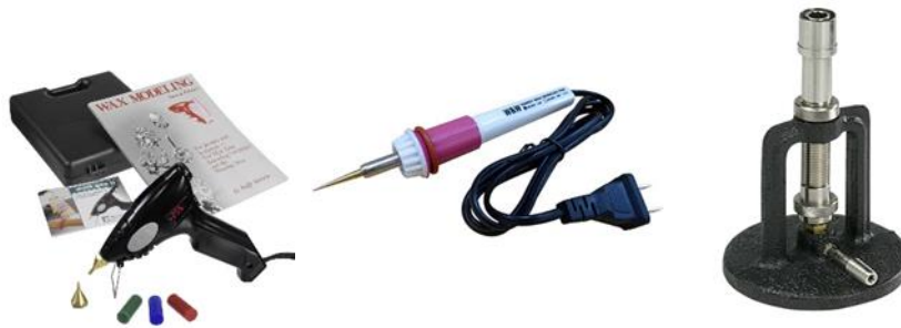
شكل (٥) أدوات التسخين ومصادر الحرارة