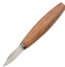
شكل (١) السكاكين