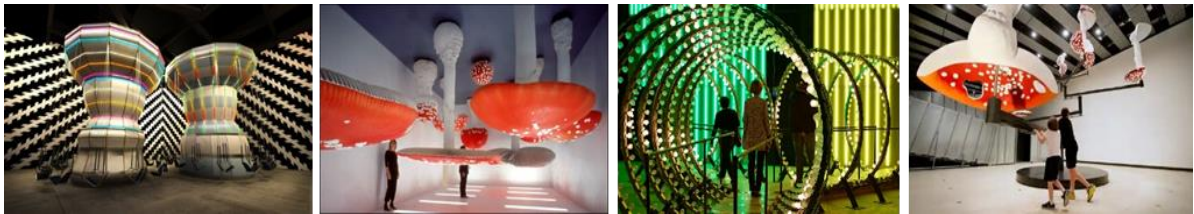
CARSTEN HÖLLER شكل (4) معارض التفاعل - كارستن هولر https://www.itliquid.com/installations-carsten-holler.html

الاعمال هي بمثابة إستعراضات شاملة فيمكنك التجول وأنت ترتدي خوذة تقلب العالم رأساً على عقب. يمكنك التلاعب بالفطر العملاق أو شعورك بتطويل أنفك، مثل بينوكيو. يمكنك أن تتدلى من آلة طائرة، تصبح خفيف الوزن وحرًا، أو تأخذ قبضة من الحبوب التي قد تجعلك تطير أيضًا. يحتوي "مختبر الشك" الذي يتجلى في الأشياء المتنوعة مثل الألعاب الدوارة والزلاقات الانزلاقية والنظارات المقلوبة، على غالبًا نكهات لعبة أو هلوسية أو فكاهية مظلمة من أجل استفزاز التجربة والتأمل. من خلال طباعته الفوتوغرافية لعجلات الفيريس والألعاب الدوارة والأفعوانيات حيث تم "تشويه" الألوان لإنشاء صور ترفض التسجيل؛ أو أفلام "الوميض" التي تم التقاطها من منظورات متعددة وعرضها تتابعيًا لإنشاء إحساس بالحركة؛ أو محصول من الفطر السحري معلق بالمقلوب من السقف، يهدف هولر إلى إثارة الإرباك وبذلك، تحفيز لحظات ما قبل الاستشعار من الإحساس النقي. تركز هذه النماذج بشكل خاص على طبيعة العلاقات البشرية. شكل 4