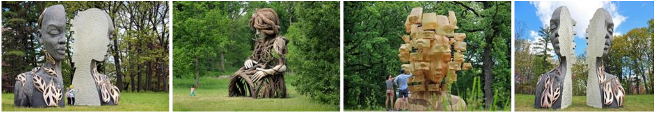
شكل (9) تثبيبات مستوحاة من الطبيعة في حديقة مورتون The Morton Arboretum