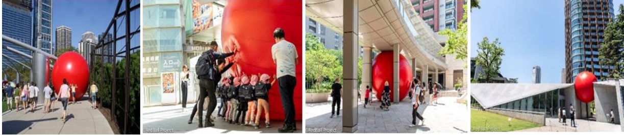
شكل (1) كرة الشاطئ العملاقة - كيرت بيرشكي Kurt Perschke

شيكاجو وتورونتو إلى تايبيه وأبوظبي. حيث تنتقل يوميًا من موقع إلى آخر (تم تنفيذه في 32 مدينة حول العالم). يفتح المشروع بطريقة فكهية تصورنا للفضاء الحضري وينعش علاقتنا بالبيئة المحيطة بنا يوميًا بطابع مرح. شكل 1 - "القوة الحقيقية للمشروع هي ما يمكن أن يخلقه لأولئك الذين يعيشون تجربته"، "إنه يفتح بابًا لتخيل ماذا لو؟" (7)