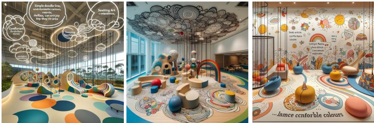
شكل (18- ب) المقترح التصميمي الثالث للباحثة باستخدام تقنية الذكاء الاصطناعي Doodle Me Do - (22) Bing Copilot