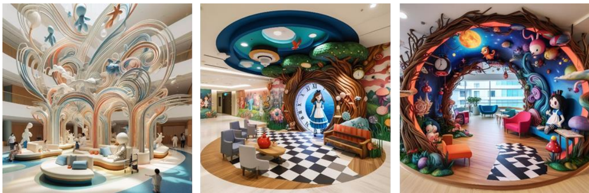
شكل (17- ب ) المقترح التصميمي الثاني للباحثة باستخدام تقنية الذكاء الاصطناعي Exaggerated Dream - (22) Bing Copilot