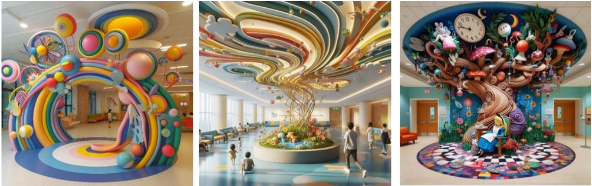
شكل (17- أ ) المقترح التصميمي الثاني للباحثة باستخدام تقنية الذكاء الاصطناعي Exaggerated Dream - (22) Bing Copilot

The Prompt written by the researcher : generate a photo of an installation art in the foyer of a pediatric health center, inspired by ALICE IN WONDER LAND THEME- Children can enjoy as they move through the area, create seating area, playing kids area, seating features, , sliding ramps, slopes. create an environment that promotes relaxation, and complements their healing journey,