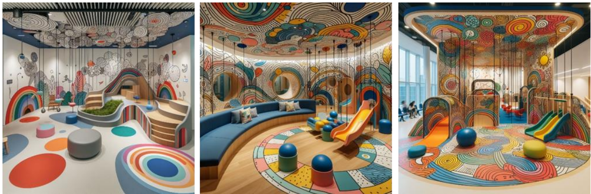
شكل (18- ج) المقترح التصميمي الثالث للباحثة باستخدام تقنية الذكاء الاصطناعي Doodle Me Do - (22) Bing Copilot

- تساهم الألوان والخامات في تحسين العواطف عند الأطفال عن طريق تحسين عواطفهم الجسدية (طمانينة، علاج، شفاء) من خلال تهدئة الطفل ورفع مستوى الراحة عنده، وتسريع عملية العلاج عند الطفل، والتحفيز على الشفاء لديه .