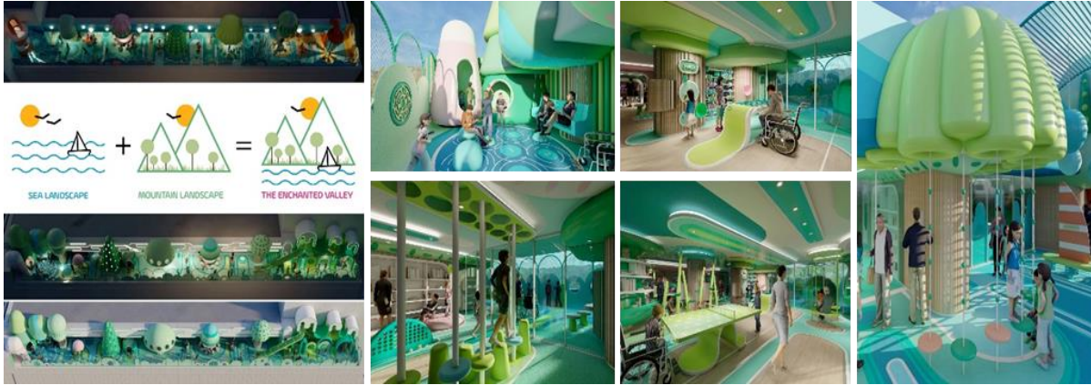
شكل (11) فن التجهيز في الفراغ وتقنياته

https://100architects.com/project/enchanted-valley