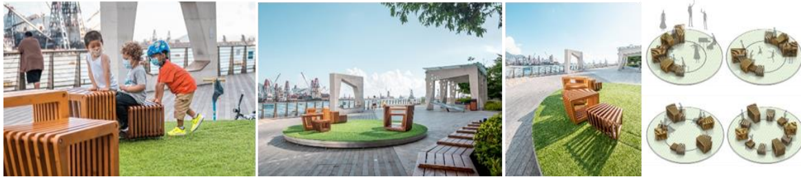
شكل (7) مشروع الحلقة الإجتماعية Social Ring

هو تدخل حضري مبتكر يشجع على تفاعل المجتمع ومشاركته أكثر خلال الأوقات التي تتطلب التباعد الاجتماعي. من خلال تصميمه لـ 10 طاولات ومقاعد قابلة للتحويل داخل حلقة دائرية، يتم تشجيع المستخدمين على تكوين الأثاث وفق احتياجاتهم، سواء كان ذلك للتباعد الاجتماعي أو التجمع الاجتماعي، من مواعيد رومانسية إلى حفلات موسيقية صغيرة. فهو ينوع نسيج المدينة على طول الممر البحري لتحسين رفاحية ومشاركة المجتمع، ويظهر شكلاً جديداً مرناً للتجمع مع الحفاظ على التباعد الاجتماعي. شكل 7 (12)