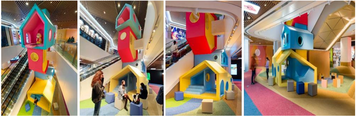
شكل ( 12 ) فن التجهيز في الفراغ وتقنياته

/https://100architects.com/project/cuckoo-house