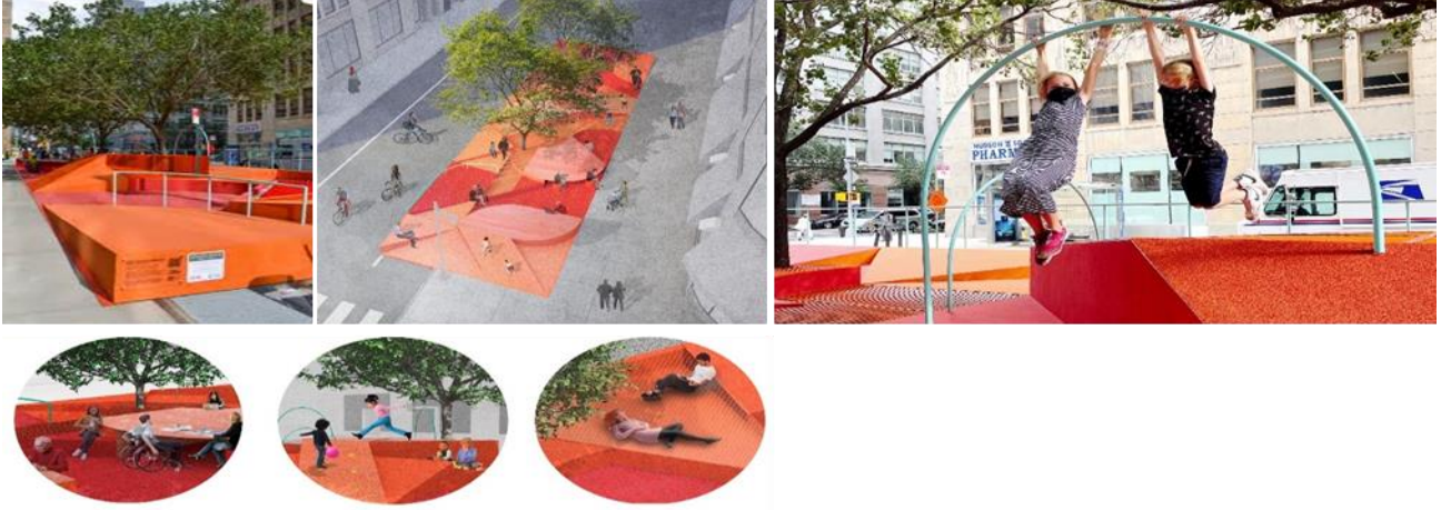
Restorative Ground شكل (6) مشروع الأرضية المُرمة

** ان فن التجهيز في الفراغ يعمل كتدخل حسي يقدم استراتيجيات بسيطة تنشط استجابة تهدئة في جسم المتلقي. تخفف هذه الاستراتيجيات من التوتر والقلق واضطرابات العواطف. ان علاج التكامل الحسي هو نهج علاجي يستخدم لمساعدة الأفراد الذين يعانون من صعوبات في معالجة الحواس. كذلك للتعافي فيما بعد الصدمات و الازمات الصحية الجائحة بالمجتمع , يوفر العلاج فرصًا للأفراد للمشاركة في تجارب حسية منظمة وعلاجية في بيئة غنية بالحواس ( التجهيز في الفراغ كأداة ( كنماذج المشاريع التالية : (الباحثة)