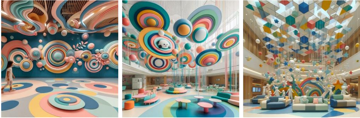
شكل (16- أ ) المقترح التصميمي الأول للباحثة باستخدام تقنية الذكاء الاصطناعي - THE HERO (22) Bing Copilot

خلق بيئة تعزز الاسترخاء، وتكمل رحلة الشفاء، وتقلل من القلق، وتوفر شعورًا بالأمان لهؤلاء المرضى الصغار وتعزز الأمل والمرونة ولحظات الفرح لهم . وترفيه للتفاعلات الاجتماعية مما يشجع على التجمع والتفاعل بين مستخدمي الفراغ . شكل ( 16 أ-ب-ج )