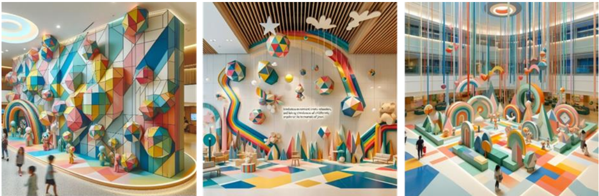
شكل (16- ج) المقترح التصميمي الأول للباحثة باستخدام تقنية الذكاء الاصطناعي - THE HERO (22) Bing Copilot