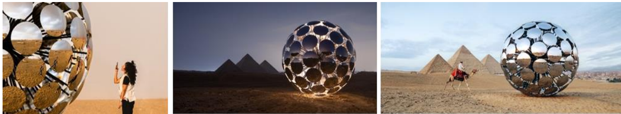
شكل (8) كرة - ORB أهرامات الجيزة

/https://mymodernmet.com/spy-giza-installation