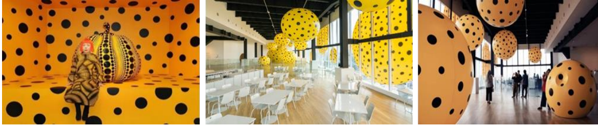
في سنغافورة Museum MACAN متحف ماكان - Yayoi Kusama شكل (2) الحياة قلب قوس قزح - يايوي كوساما /https://manual.co.id/article/yayoi-kusama-museum-macan-jakarta