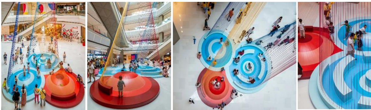
شكل ( 15 ) فن التجهيز في الفراغ وتقنياته