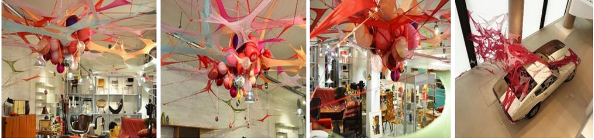
شكل (10) أعمال مؤسسة مادلين بيركهيمر – Madeleine Berkhemer Foundation تجهيزات مصنوعة من الاقمشة http://www.madeleineberkhemer.com/?cat=6