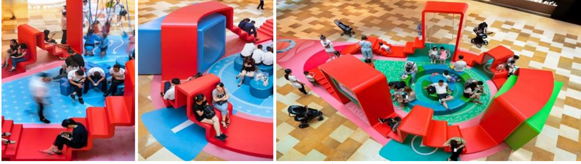
شكل ( 13 - أ ) فن التجهيز في الفراغ وتقنياته

/https://100architects.com/project/twin-ribbons