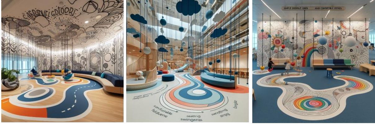
شكل (18- أ) المقترح التصميمي الثالث للباحثة باستخدام تقنية الذكاء الاصطناعي Doodle Me Do - (22) Bing Copilot