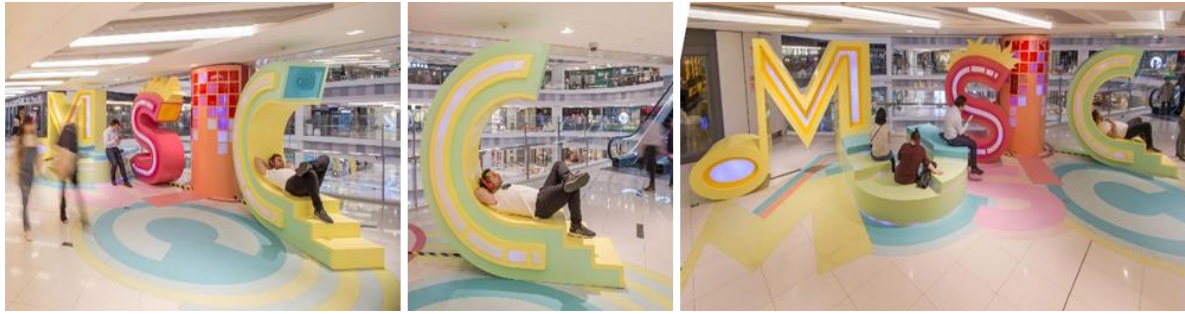
شكل ( 14 ) فن التجهيز في الفراغ وتقنياته