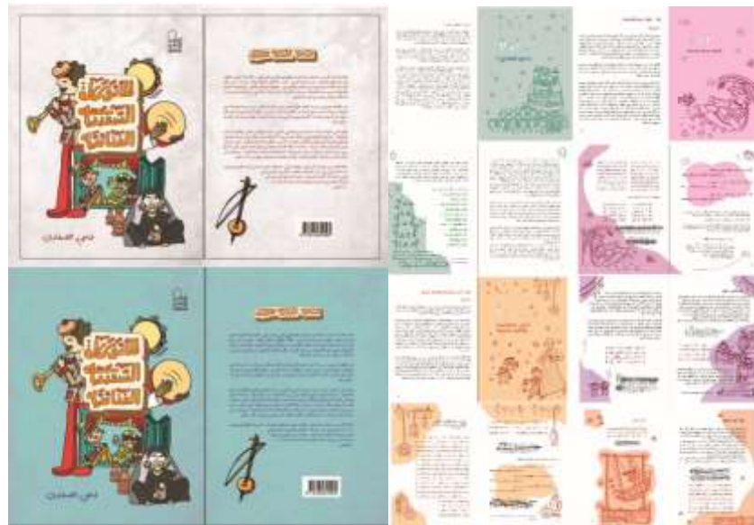
شكل (1)، (2) غلافان لكتاب "المأثورات الشعبية الغنائية"، 16 صفحة داخلية للكتاب، 2023.