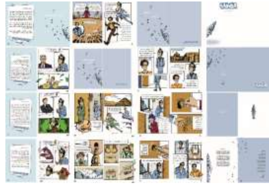
شكل(9)، (10)، غلاف كتاب " الصفارة"، 24 صفحة داخلية للكتاب، 2023.