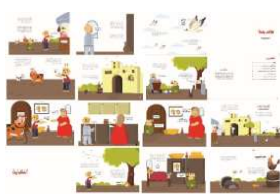
شكل(5)، (6)، غلاف كتاب " نواذر جحا "، 30 صفحة داخلية للكتاب، 2023.