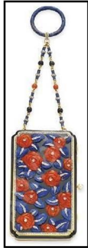
شكل (٩) حقيبة مستحضرات تجميل صغيرة الفن الزخرفي Art Deco ، للفنان سوثيربي's sotheby's المكان : سانت مورتييز (جنوب شرق سويسرا) نقلًا عن (17)