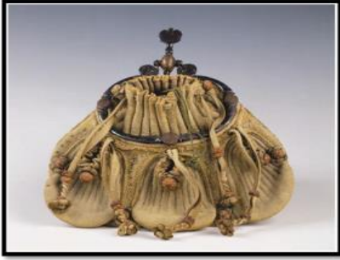
شكل (٢) حقيبة للنقود مصنوعة من القماش مع إطار معدني وحامل مصنوع من المعدن حتى يُعلق من حزام الشخص، وترجع لعام ١٤٠٠" نقلاً عن (12)