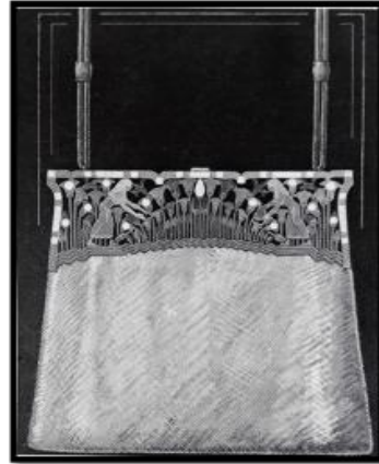
شكل (٧) حقيبة يد مسانية من الفن الزخرفي Art Deco الفنان: كارتية Cartier، المكان: لندن نقلًا عن (17)