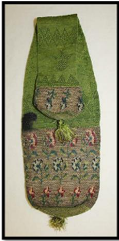
شكل (٤) حقيبة ترجع إلى أوائل القرن الثامن عشر، من بريطانيا مكان الحفظ: متحف ميتروبوليتان رقم الحفظ / التسجيل: ١٤٩٠٥، ١٩٧٦ نقلاً عن (22)