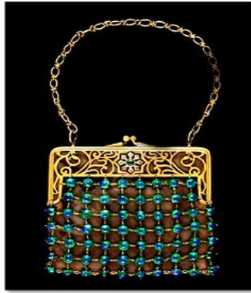
شكل (٨) حقيبة ترجع إلى فن أرت نوفو نقلًا عن (23)