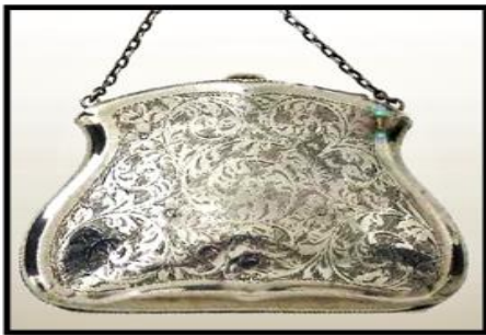
شكل (٦) حقيبة مصنوعة من المعدن، للفنان تشيستر T&S، ترجع لعام ١٩١٩ من فن آرت ديكو نقلاً عن (15)