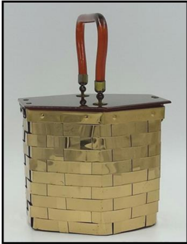
شكل (١٠) "حقيبة سداسية الشكل مصنوعة من خامة المعدن والبلاستيك، ترجع لعام ١٩٥٠ نقلًا عن (21)