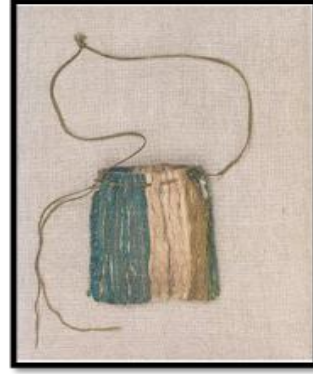
شكل (١) كيس نقود مصنوع من القماش يرجع إلى القرن الثالث عشر نقلاً عن (24)