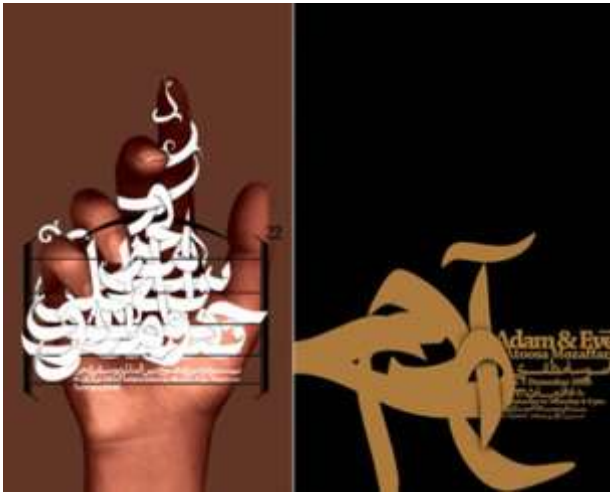
Farhad Fozuni / Iran

تمثل التبوغرافيا عنصرا مهما من عناصر التصميم التي يمكن أن تتعدى دورها اللغوى وتقدم شكلا أو تعبيراً بصريا و تمثل خطأ أو ملمساً أو شكلاً (8)