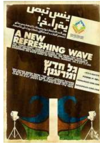
Yaronimus Maximus / Israe