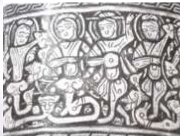
شكل (3) شمعدان كتبغا كامله 694هـ/1294م و تظهر فيه الكتابه مع الصورة (20)

و يستخدم المصمم عند التعامل مع الكتابه ثلاثة عناصر: المساحة والصورة المرئيه المتكونه من كل عناصر التصميم و الخط أو الفونت الكتابى كلغه او صوره ورغم أن الصورة هى أي عنصر مرئى فى التصميم ؛ إلا أننا نستطيع اعتبار الكتابه فى التصميم جزء من المفهوم الأشمل للصورة، و التيبوغرافيا هى أكثر من مجرد اختيار نوع الخط فى التصميم، ويحدد الفراغ بين الحروف الشكل المرئى للكلمه صورته فى النهايه.