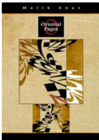
Oriental Typography Posters ByMalik Anas

تمثل التعبيرية حركة فنيه حديثه ظهرت في ألمانيا في بدايه القرن العشرين و ارتبطت بالشعر و الرسم و تعبر عن الانفعال الشخصى و تحقيق التأثير العاطفى من أجل استحضار الحالة المزاجية أو الأفكار لدى القارئ أو المشاهد و سعى الفنانون التعبيرية إلى التعبير عن معنى التجربة العاطفية بدلاً من الواقع المادي. تم تطوير التعبيرية كأسلوب مبتكر قبل الحرب العالمية الأولى ظلت شعبية خلال جمهورية فايمار ، وخاصة في برلين. امتد تأثيرها إلى أنواع مختلفه من الفنون، بما في ذلك الهندسة المعمارية التعبيرية والرسم والأدب والمسرح والرقص والأفلام والموسيقى يقول الفنان العالمى ادجار ديجا " إن الفن ليس ماترى و لكن ما تجعل الآخرون يرونه " (10)