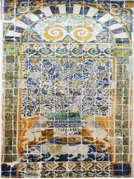
Carreau de céramique du musée du Bardo avec le vocabulaire des formes florales, animales et architecturales