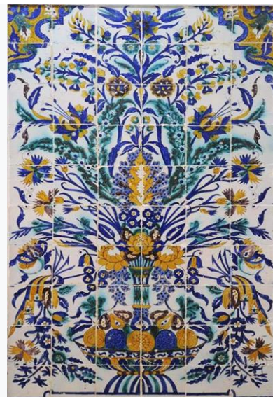
Carreau de céramique au musée du "Bardo" avec un vocabulaire plastique