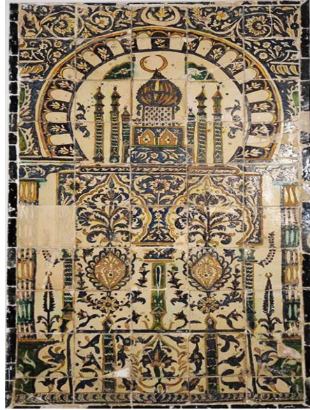
Carreau de céramique du musée du Bardo avec vocabulaire floral et architectural