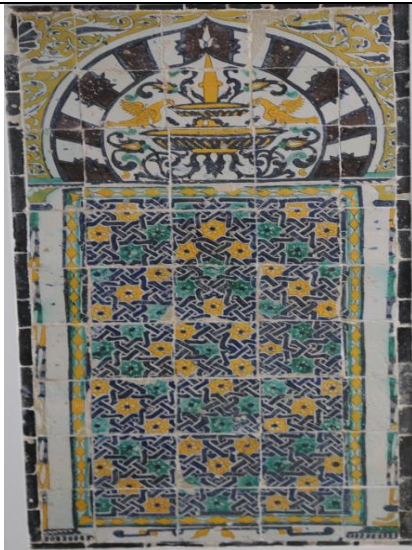
Carreau de céramique du musée du Bardo avec un vocabulaire sur la formation géométrique, animale et végétale

. La décoration de ce nouveau type a connu une croissance constante du développement de la forme patrimoniale (végétale, animale et architecturale), et la zone de décoration a été élargie pour occuper le plus grand espace laissé par la porcelaine d'Iznik, qui a donné une céramique décorative. Porcelaine andalouse et porcelaine d'Iznik réunies. Ce type se distingue par ses motifs floraux, architecturaux, techniques et parfois animaliers tels que les oiseaux, et comprend divers types de lignes d'écriture (Diwani, Moroccan, Thuluth, etc.).