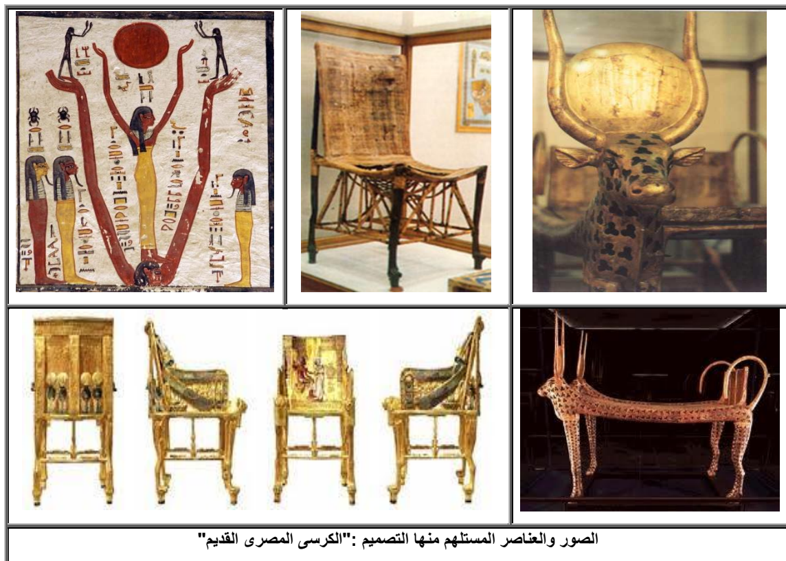
الصور والعناصر المستلهمة منها التصميم: "الكرسى المصرى القديم"