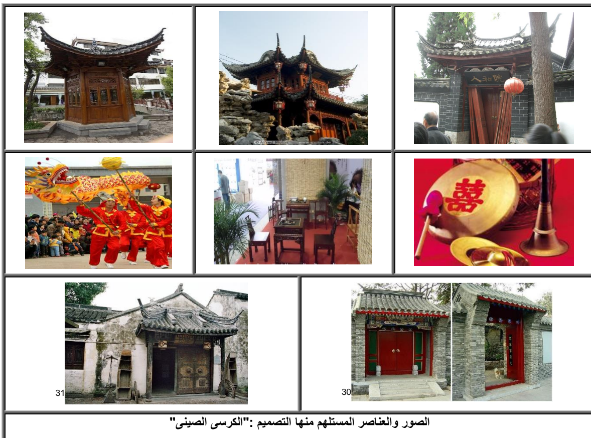
الصور والعناصر المستلهم منها التصميم: "الكرسي الصيني"

- واللون الأحمر الذي يمثل الشمس، هو المسيطر في اللوحات المرسومة على الصخور (الجداريات) التي أبدعها الصينيون قبل آلاف السنين، فقد كان الأحمر مرادفا للمهابة والثروة والشرف، وكانت أسوار المدينة المحرمة والقصور الإمبراطورية حمراء وسقفها صفراء. الأصفر هو الآخر له مغزى عند الصينيين، فهو مرتبط بمفهوم العناصر الخمسة (الخشب، النار، الماء، المعدن، والتراب). 29